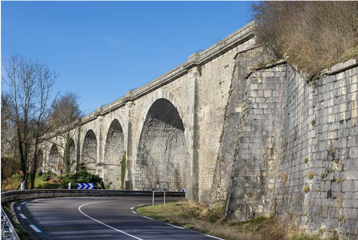
Vue depuis la route départementale, à l'est. 39, Salins-les-Bains, lieudit : Saint-Joseph