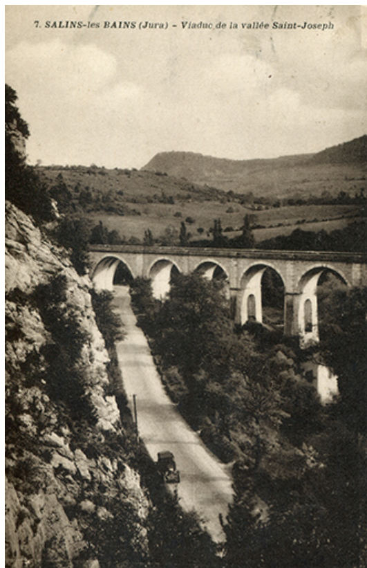
Salins-les-Bains (Jura) - Viaduc de la vallée de Saint-Joseph, s.d. [début 20e siècle]. 39, Salins-les-Bains, lieudit : Saint-Joseph