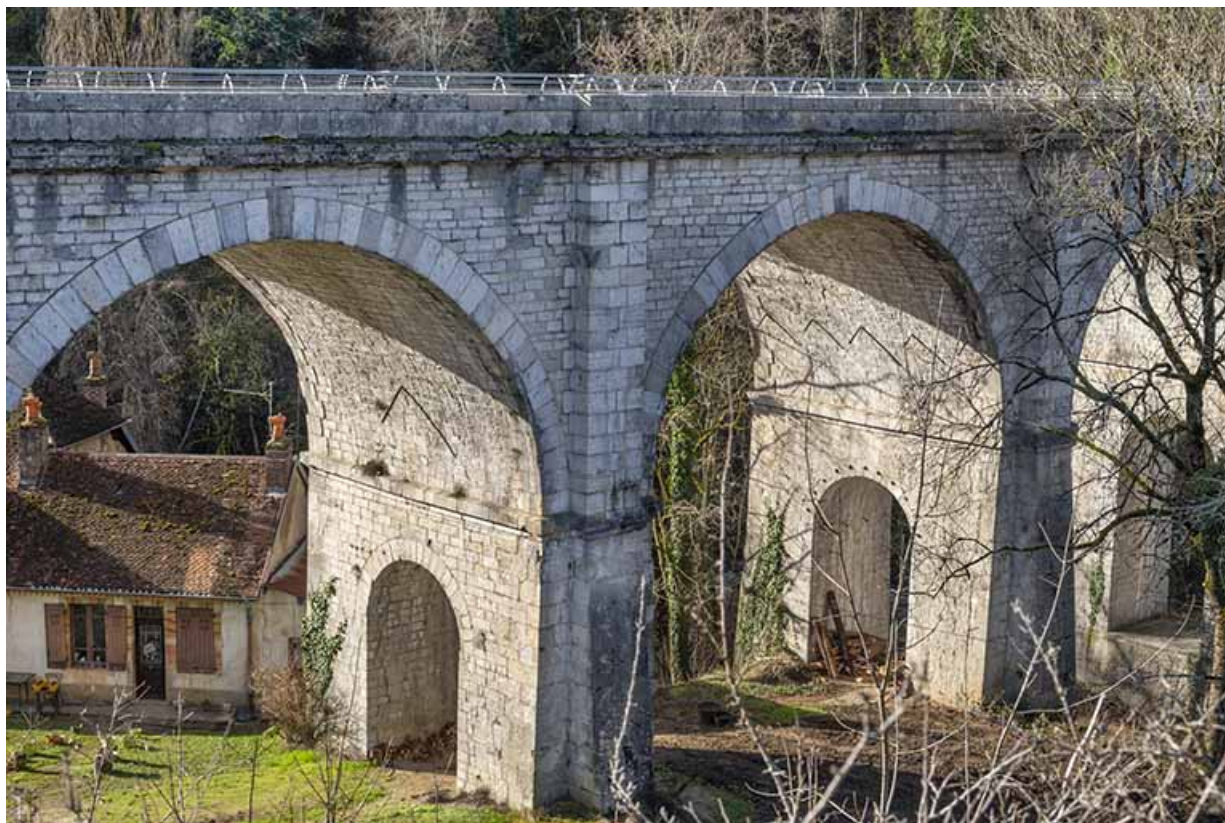
Vue sur les arches, depuis le nord-est.

39, Salins-les-Bains, lieudit : Saint-Joseph