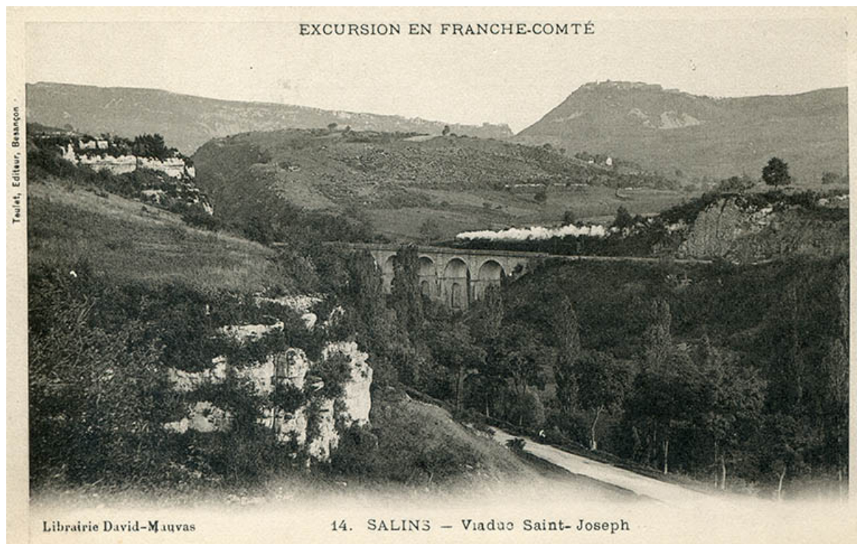
Salins-les-Bains - Viaduc de Saint-Joseph, s.d. [fin 19e ou début 20e siècle]. 39, Salins-les-Bains, lieudit : Saint-Joseph