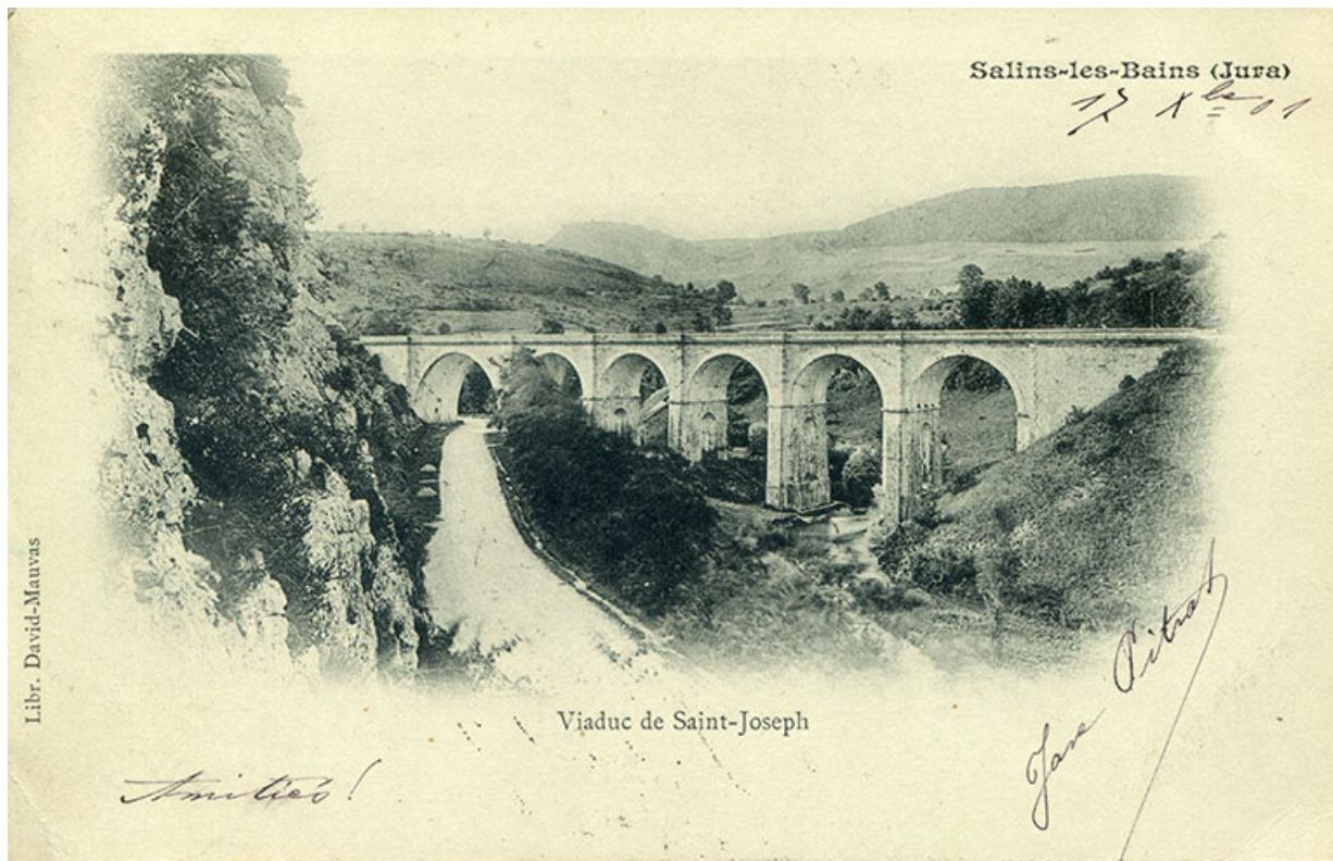
Salins-les-Bains (Jura) - Viaduc de Saint-Joseph, s.d. [fin 19e siècle].

39, Salins-les-Bains, lieudit : Saint-Joseph