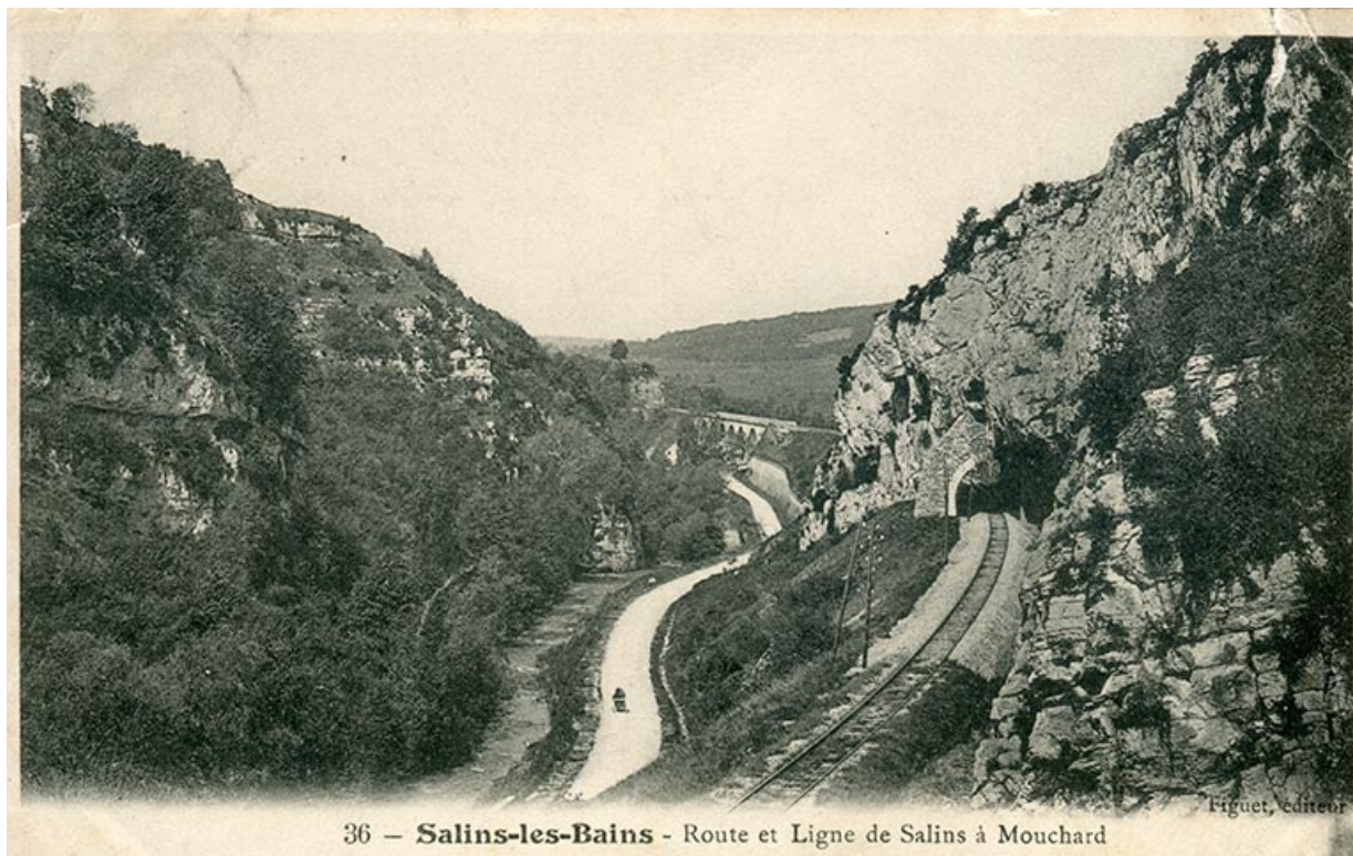
Salins-les-Bains – Route et ligne de Salins à Mouchard, s.d. [fin 19e ou début 20e siècle].

39, Salins-les-Bains, lieudit : Saint-Joseph