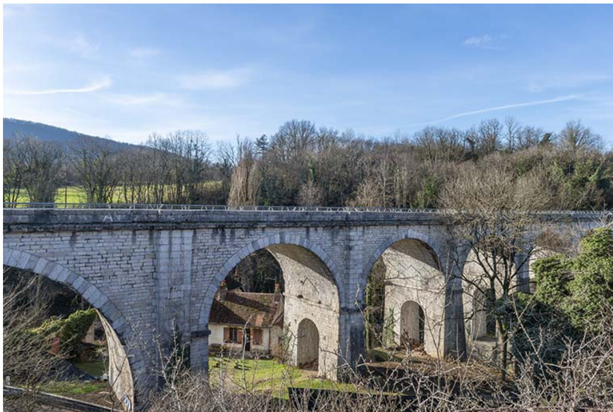
Vue de trois quarts, depuis le nord-est.

39, Salins-les-Bains, lieudit : Saint-Joseph