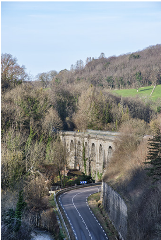
Vue rapprochée du viaduc, depuis l'est. 39, Salins-les-Bains, lieudit : Saint-Joseph