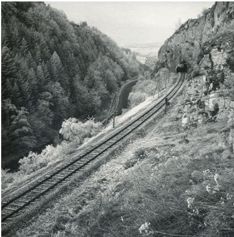
Vue perspective sur la voie ferrée, s.d. [3e quart 20e siècle].

39, Salins-les-Bains, lieudit : Saint-Joseph