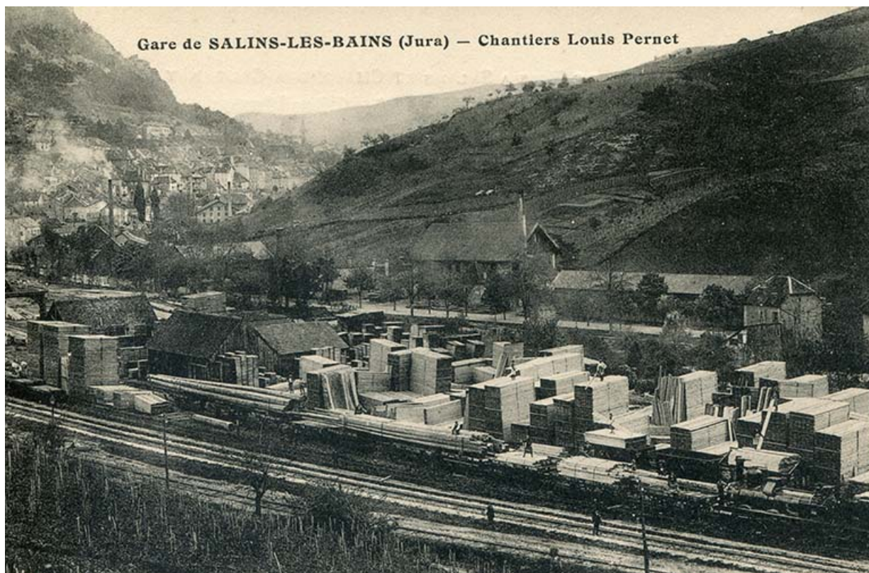
Gare de Salins-les-Bains - Chantiers Louis Pernet, s.d. [fin 19e ou début 20e siècle]. 39, Salins-les-Bains