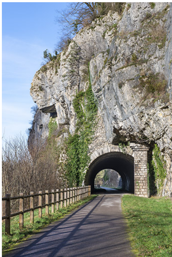
Vue du tunnel depuis l'est.