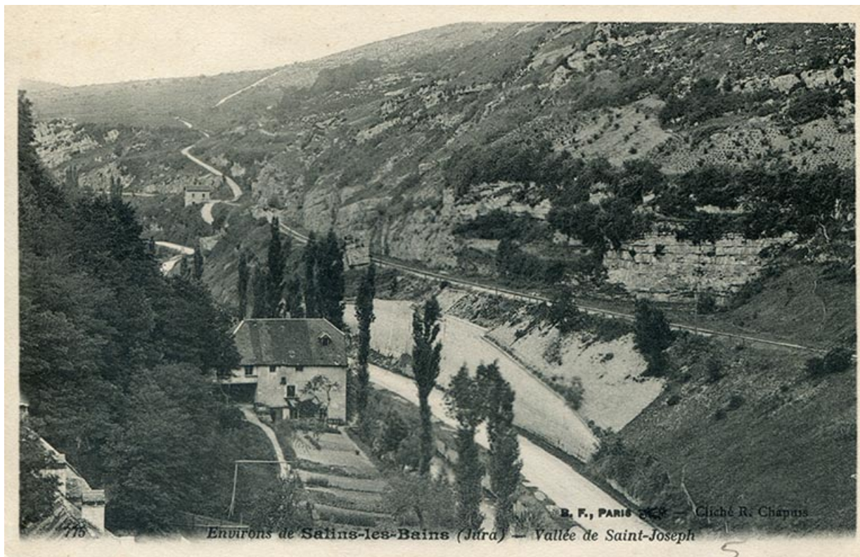
Environs de Salins-les-Bains (Jura) – Vallée de Saint-Joseph, s.d. [fin 19e ou début 20e siècle].