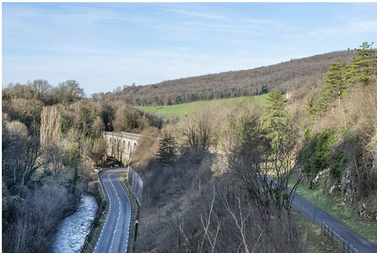
Vue d'ensemble : rivière, route départementale, viaduc et voie verte. 39, Salins-les-Bains