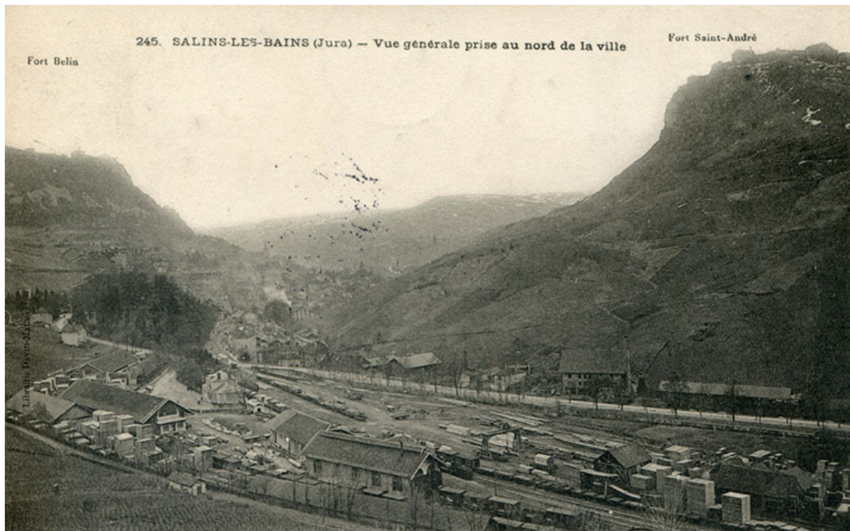
Salins-les-Bains (Jura) – Vue générale prise au nord de la ville, s.d. [fin 19e ou début 20e siècle]. 39, Salins-les-Bains