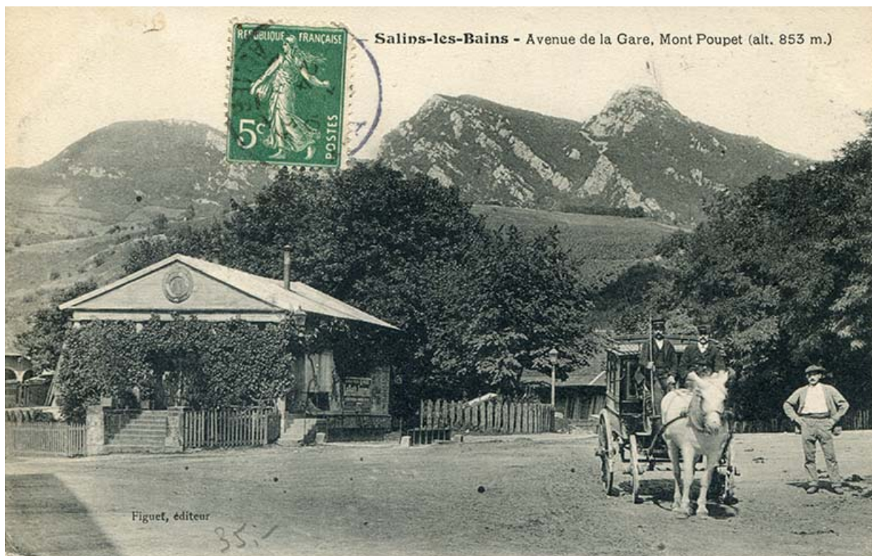
Salins-les-Bains - Avenue de la gare, Mont Poupet, s.d. [fin 19e ou début 20e siècle].

39, Salins-les-Bains place du Souvenir français