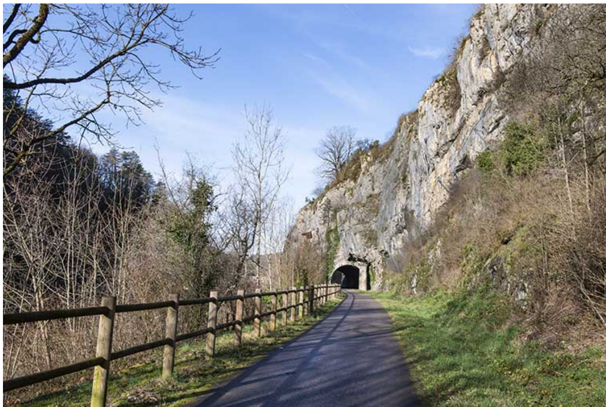
Vue depuis l'est : voie verte et entrée du tunnel. 39, Salins-les-Bains