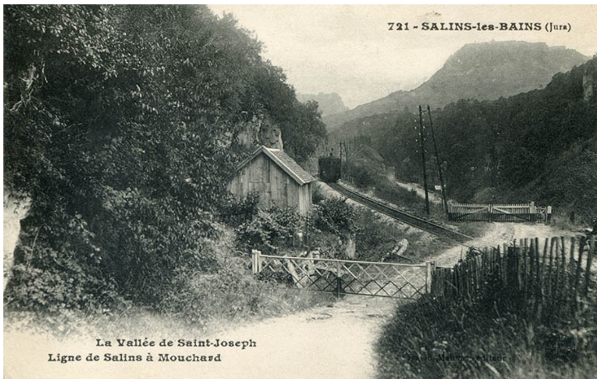
Salins-les-Bains (Jura) – La vallée de Saint-Joseph - Ligne de Salins à Mouchard, s.d. [fin 19e ou début 20e siècle]. 39, Salins-les-Bains