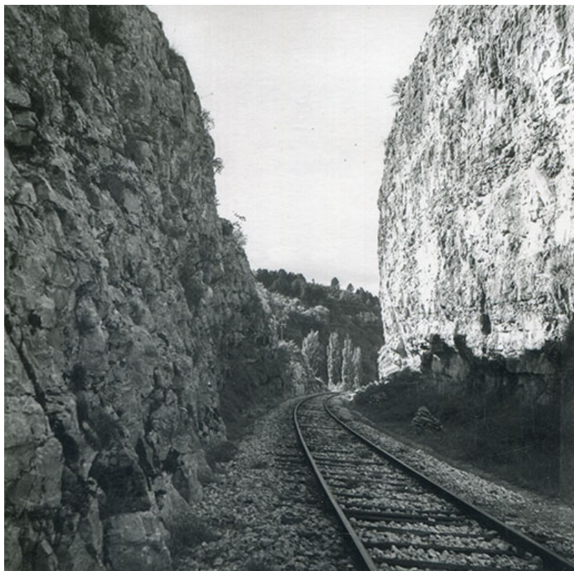
Passage taillé dans la roche, ou tranchée, à l'entrée nord de la ville, s.d. [3e quart 20e siècle]. 39, Salins-les-Bains