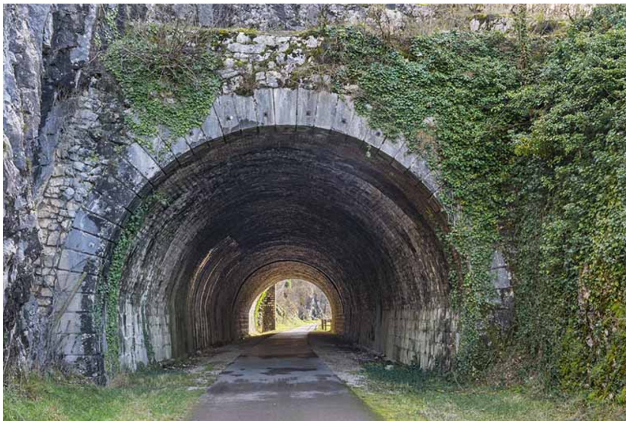
Entrée ouest du tunnel.