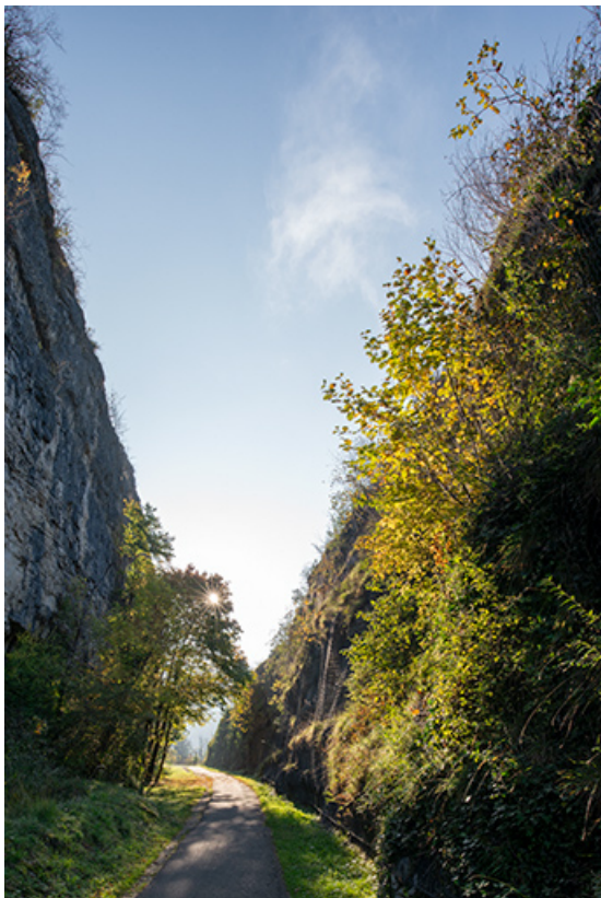
Tranchée de la voie ferrée. Vue depuis l'ouest. 39, Salins-les-Bains