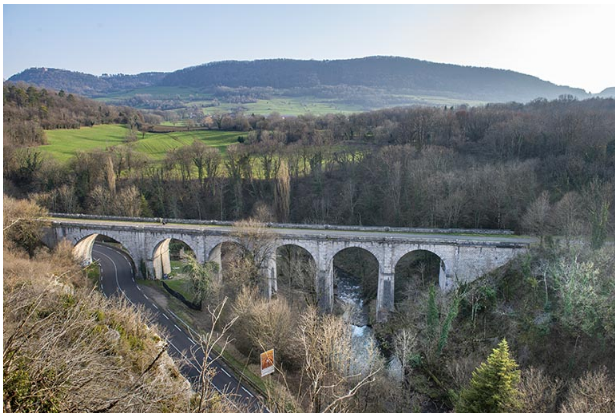
Vue du viaduc depuis le nord-ouest.

39, Salins-les-Bains, lieudit : Saint-Joseph