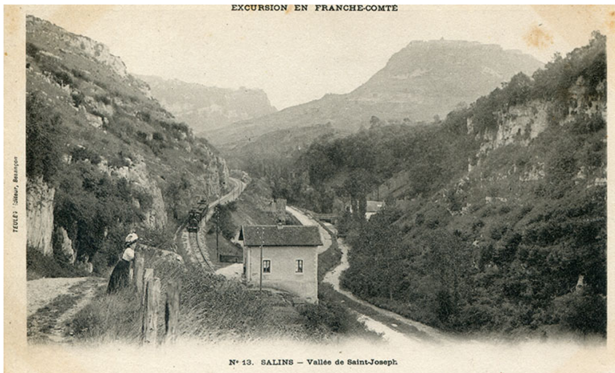
Salins – Vallée de Saint-Joseph, s.d. [fin 19e ou début 20e siècle].