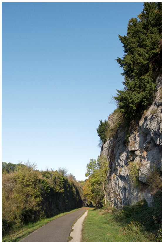
Tranchée de la voie ferrée. Vue depuis l'est. 39, Salins-les-Bains