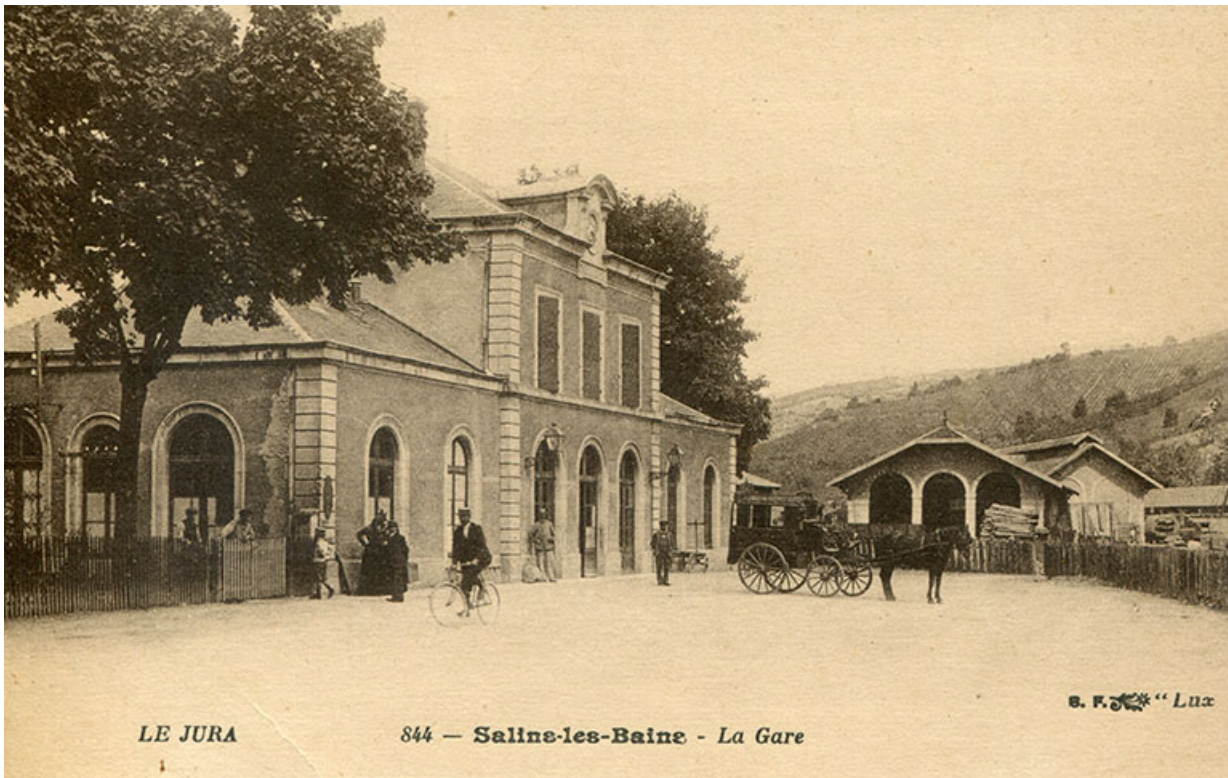
Le Jura - 844. Salins-les-Bains - La gare, s.d. [fin 19e ou début 20e siècle]. 39, Salins-les-Bains