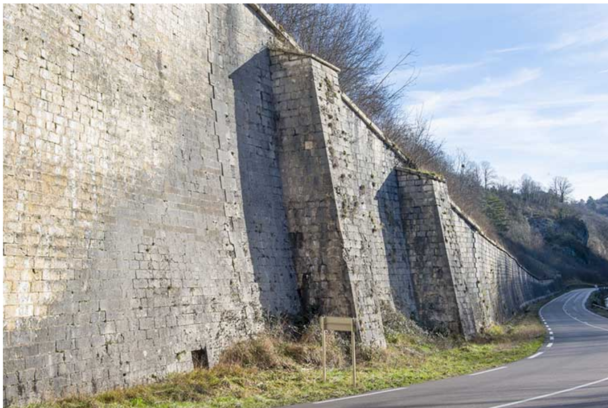
Mur de soutènement, depuis le pied du viaduc. 39, Salins-les-Bains