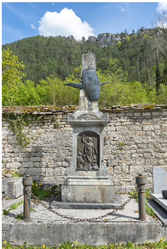
Monument commémoratif de la guerre franco-prussienne de 1871.

39, Salins-les-Bains, chemin des Côteaux