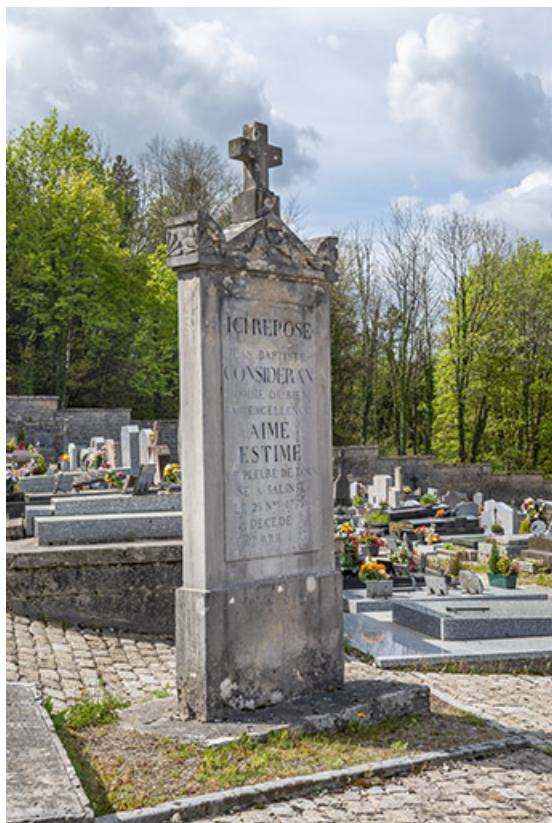
Tombe de Jean-Baptiste Considerant.

39, Salins-les-Bains, chemin des Côteaux