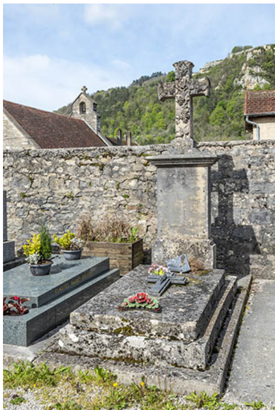
Tombe de Charles Rouget.

39, Salins-les-Bains, chemin des Côteaux