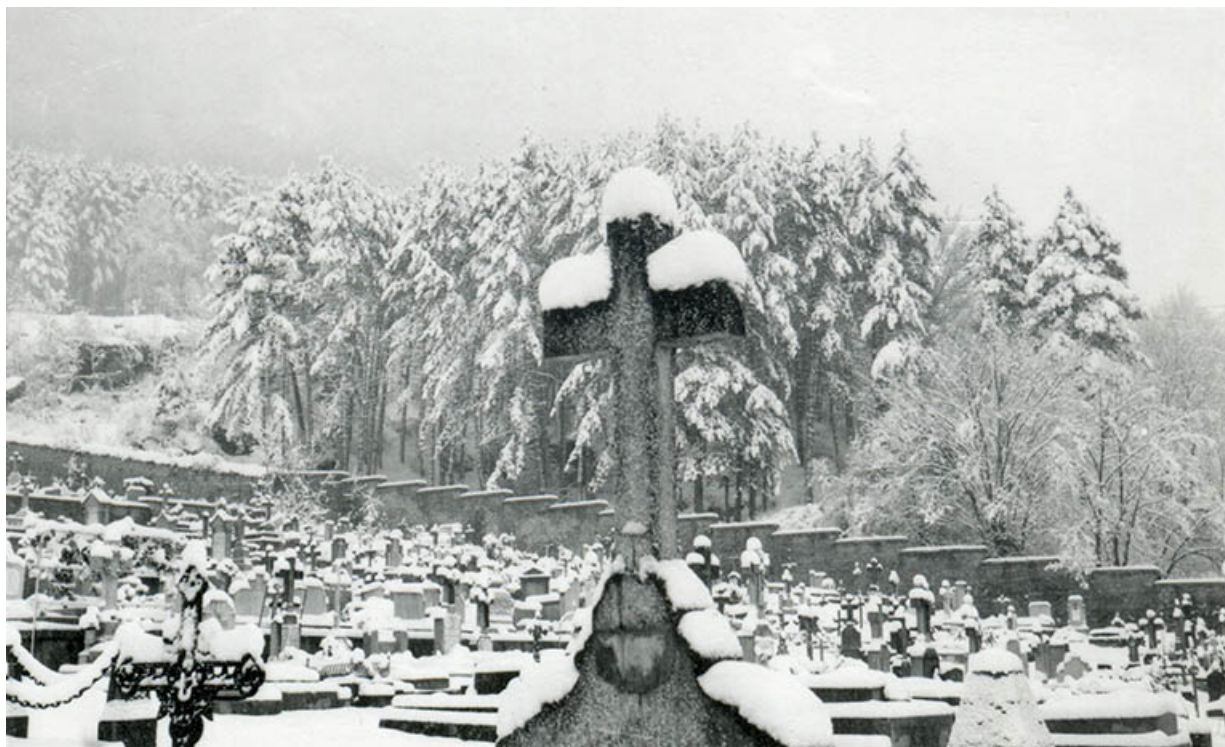
Vue du cimetière en hiver, s.d. [3e quart 20e siècle].

39, Salins-les-Bains, chemin des Côteaux