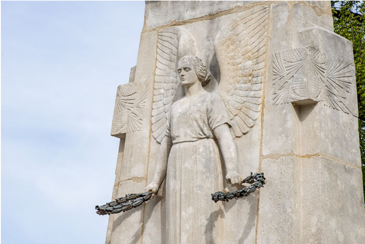
Détail de la partie supérieure, vue de trois quarts.

39, Salins-les-Bains, place du Souvenir français