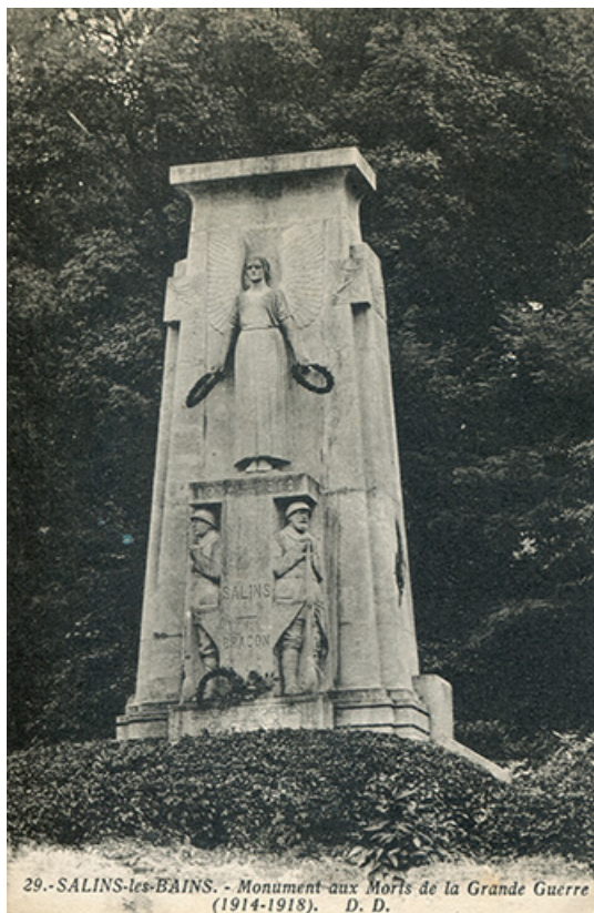
29.- SALINS-les-BAINS. - Monument aux Morts de la Grande Guerre (1914-1918). D. D. Salins-les-Bains (Jura) - Monument aux Morts de la Grande Guerre (1914-1918), s.d. [vers 1925]. 39, Salins-les-Bains, place du Souvenir français