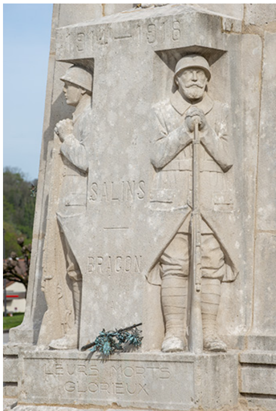
Partie inférieure, vue de trois quarts droite.

39, Salins-les-Bains, place du Souvenir français