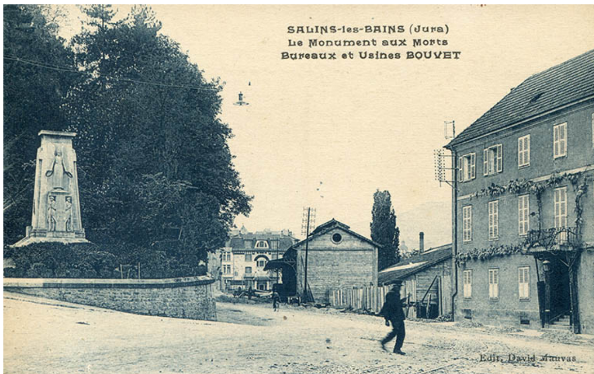
Salins-les-Bains (Jura) - Le Monument aux Morts. Bureaux et usines Bouvet, s.d. [vers 1925].

39, Salins-les-Bains, place du Souvenir français