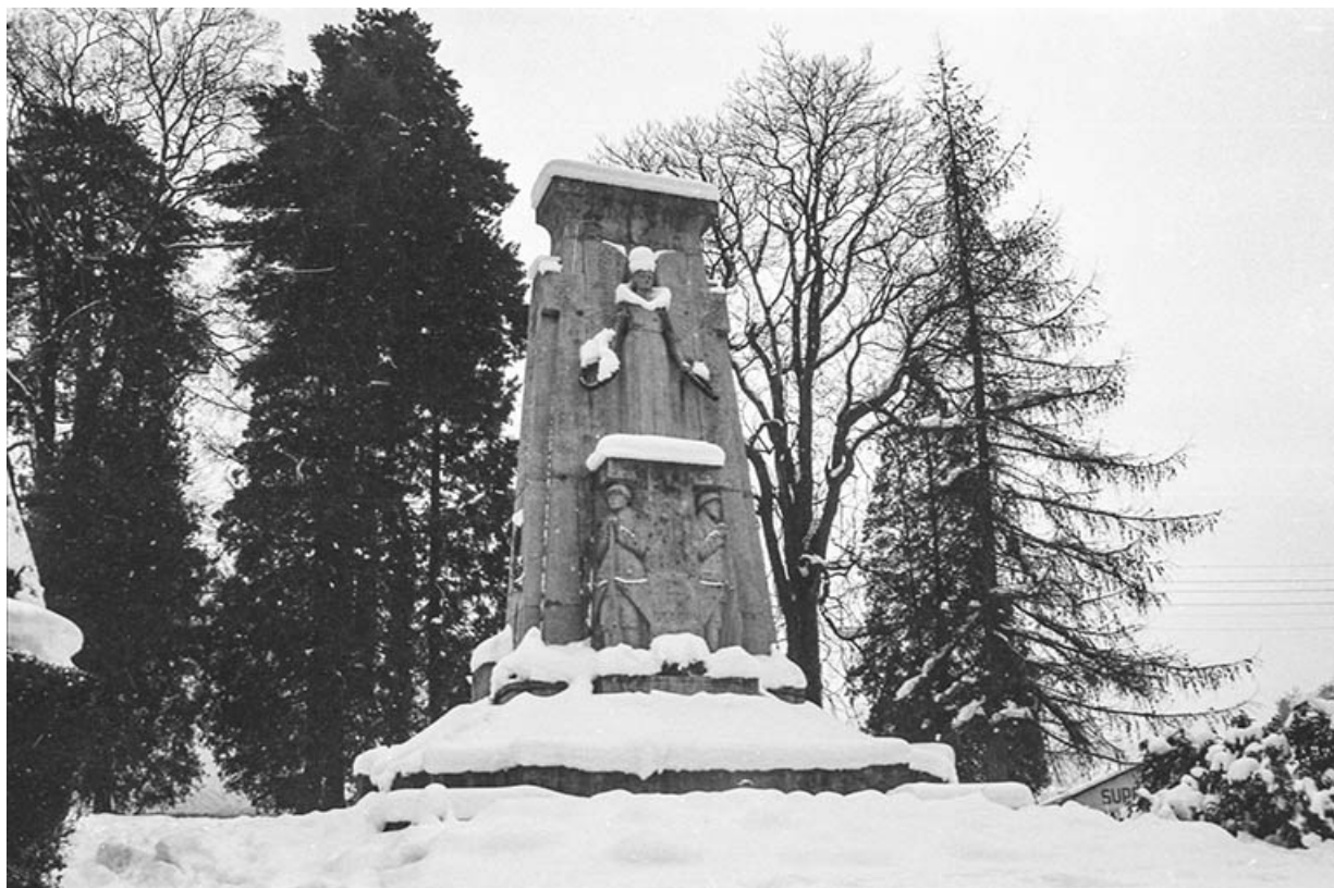
Vue d'ensemble en hiver, s.d. [3e quart 20e siècle].

39, Salins-les-Bains, place du Souvenir français