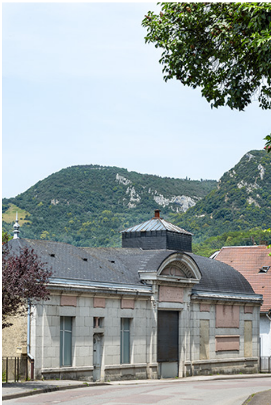
Vue de trois quarts gauche (cadrage vertical).