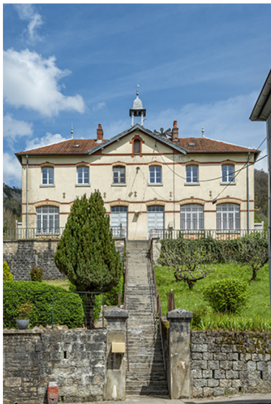
Vue axiale, depuis la rue.

39, Salins-les-Bains rue des Prémoureaux