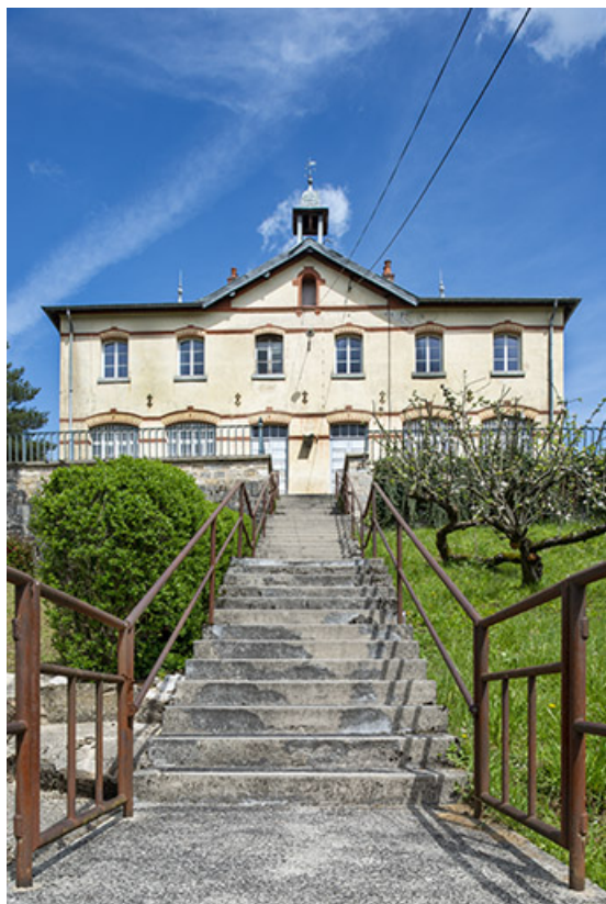
Vue depuis le bas de l'escalier.

39, Salins-les-Bains rue des Prémoureaux