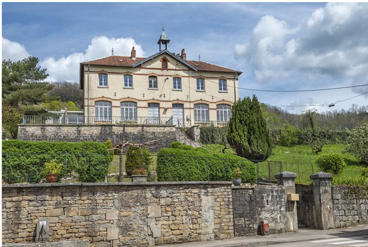
Vue d'ensemble depuis la rue des Prémoureaux.

39, Salins-les-Bains rue des Prémoureaux