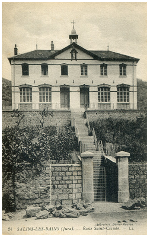
Salins-les-Bains - Ecole Saint-Claude, s.d. [entre 1912 et 1924].

39, Salins-les-Bains rue des Prémoureaux