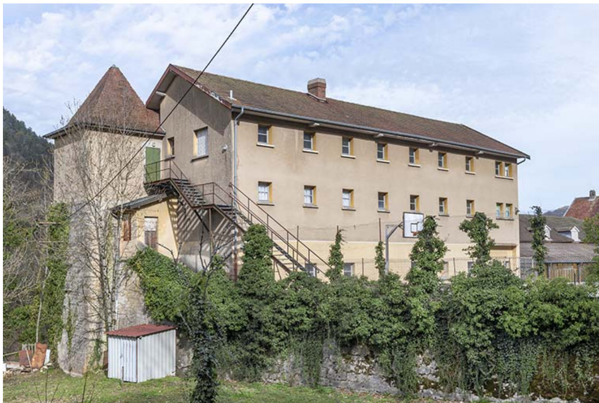
Tour Terrestre, accolée au pignon sud du bâtiment dit du Rayon de Soleil.