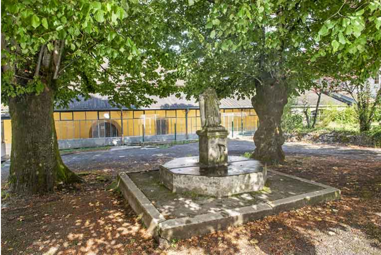
Statue placée à l'aplomb du puits, situé au centre de l'ancien cloître.