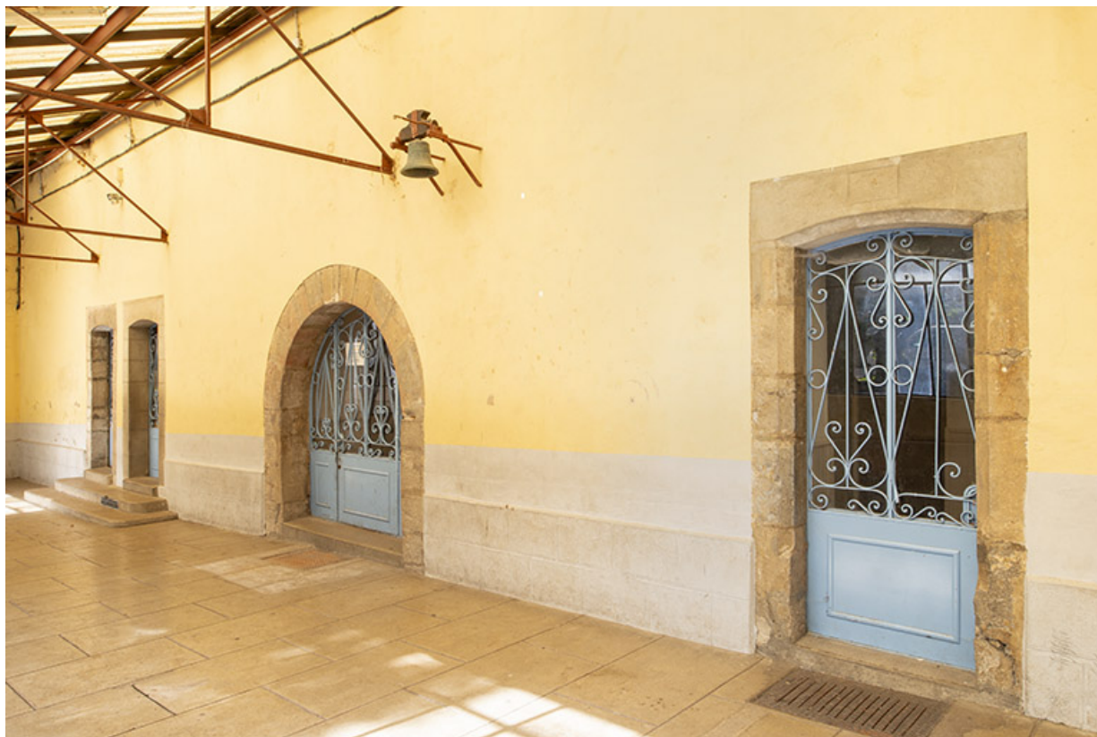
Bâtiment conventuel. Ouvertures de la façade est.