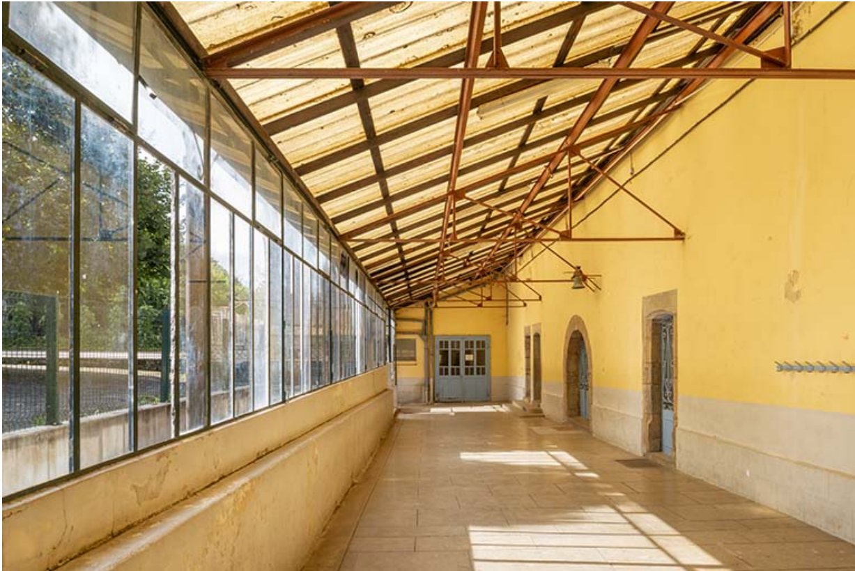
Galerie couverte, adossée contre la façade est du bâtiment conventuel.