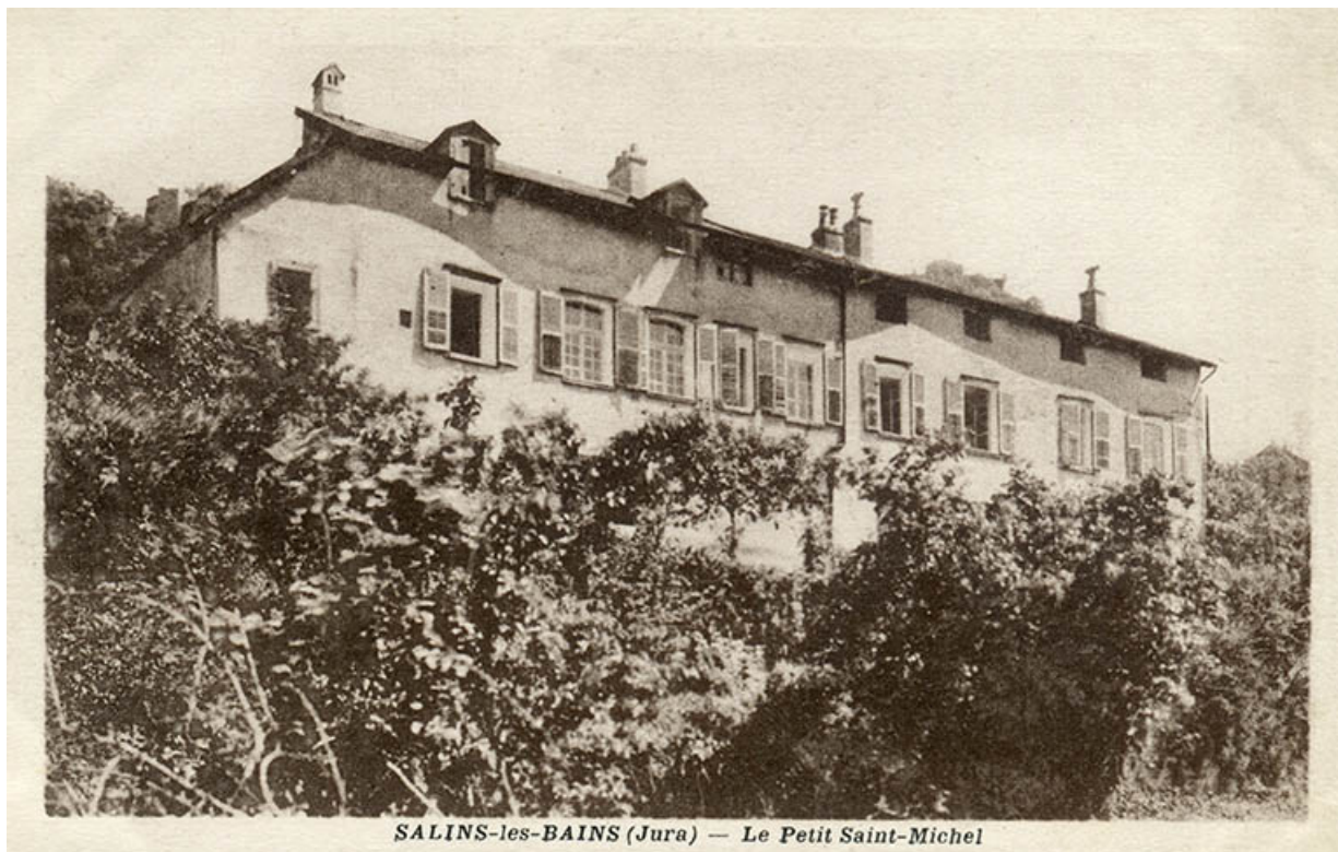
Salins-les-Bains (Jura) - Le Petit Saint-Michel, s.d. [années 1920].