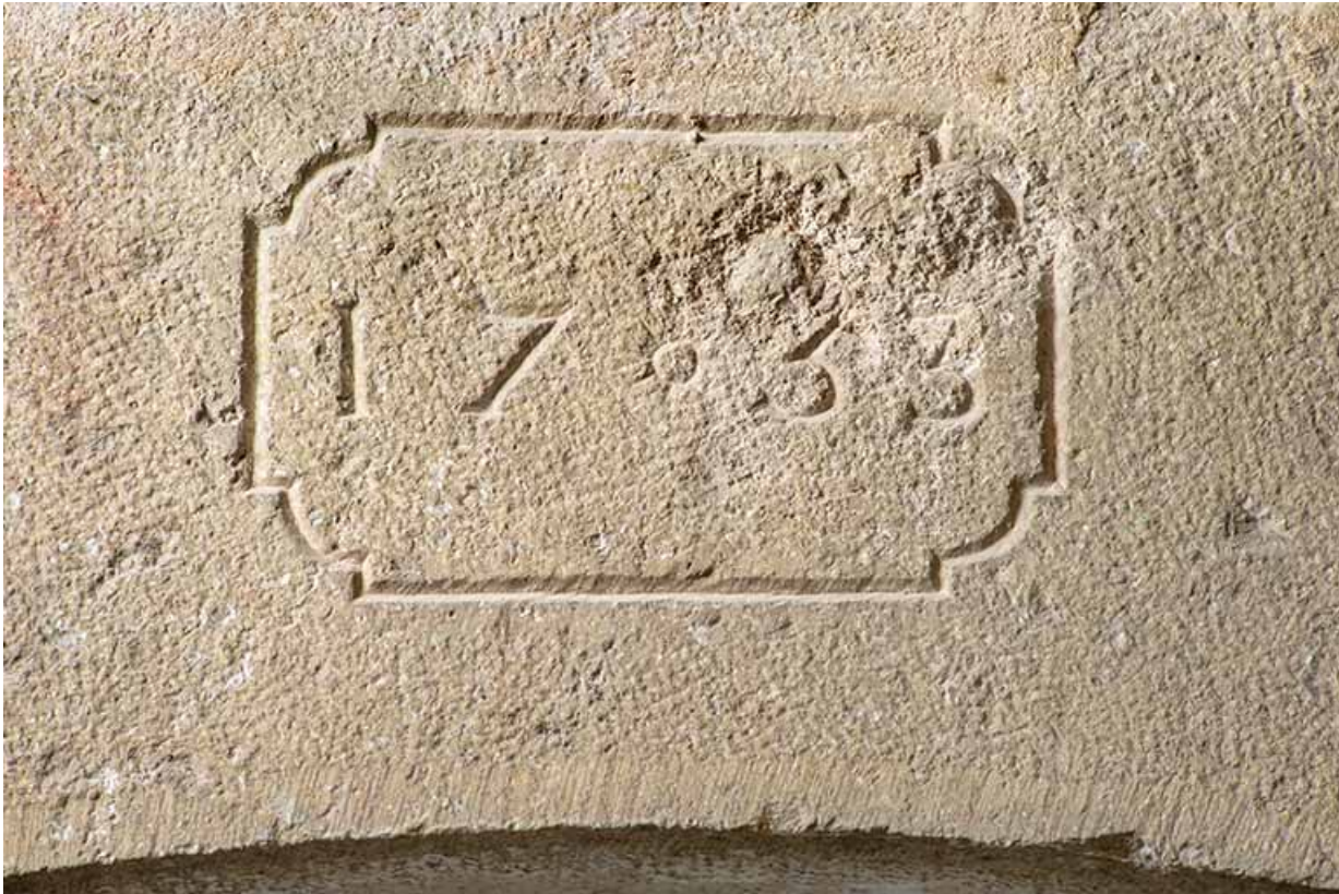
Mur est du bâtiment. Cartouche gravée (1753 ?)