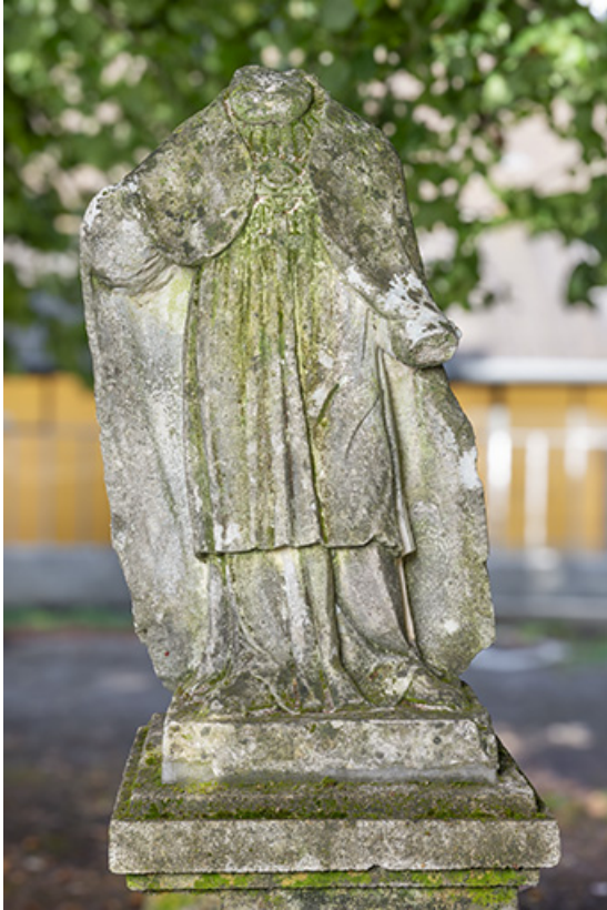
Détail de la statue.