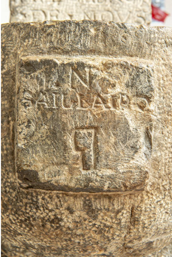
Bénitier. Détail de l'inscription : N SAILLARD.