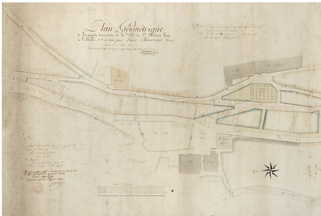
Plan géométrique de la partie incendiée de la ville de Salins, 1826.

39, Salins-les-Bains, 3 rue Charles Magnin