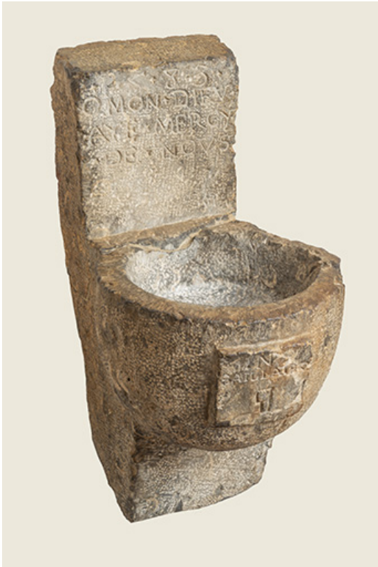
Bénitier exhumé lors du sondage archéologique de 1982 (conservé dans les collections du musée).