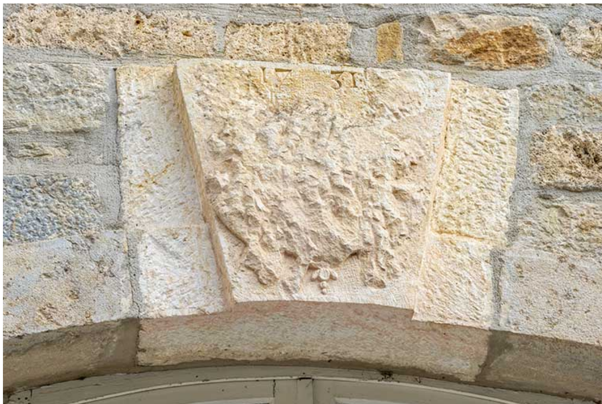
Clef d'arcade bûchée. Façade ouest du logis.

39, Salins-les-Bains, lieudit : Goailles