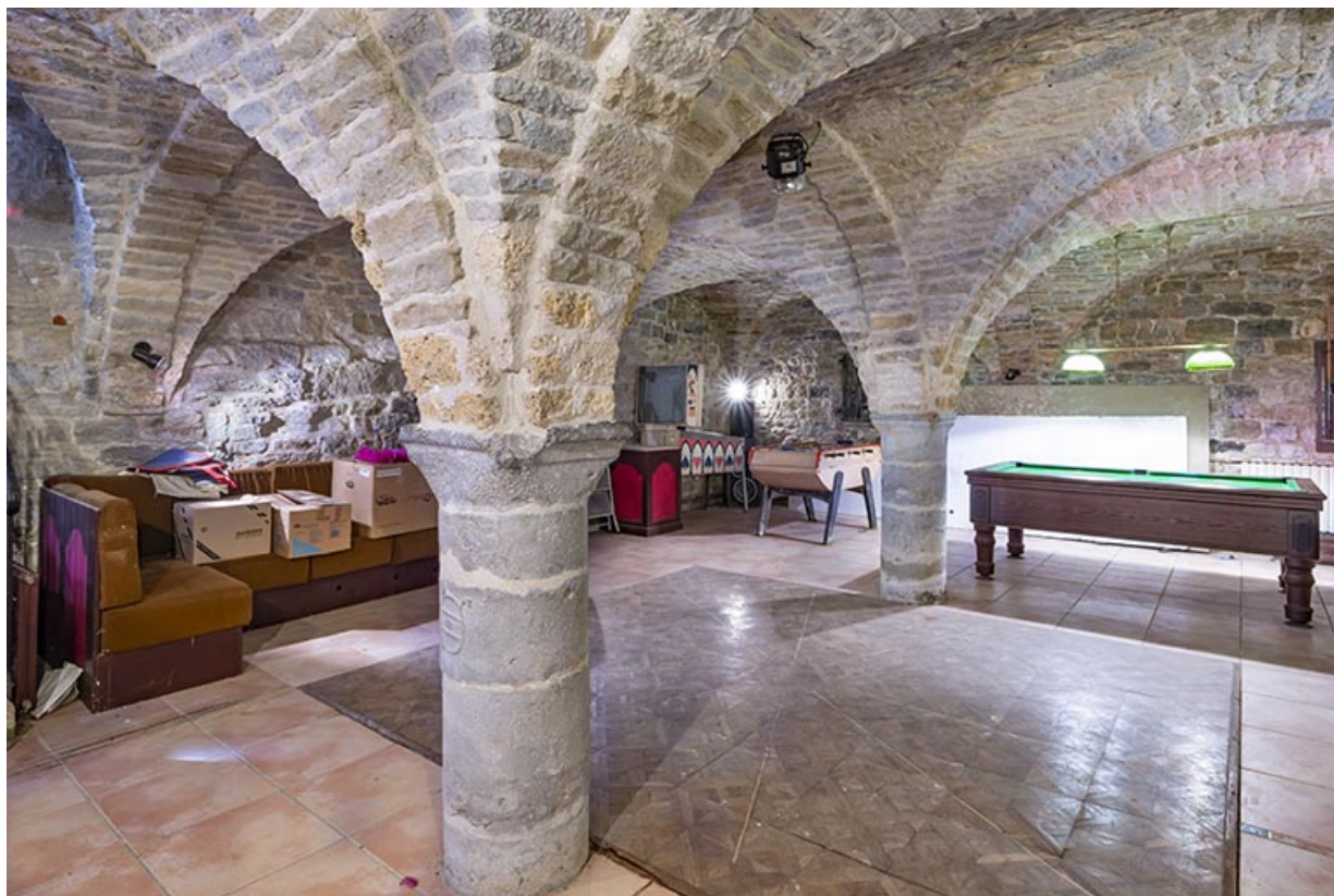
Cave voûtée d'arêtes sous le logis abbatial. Vue depuis le nord.

39, Salins-les-Bains, lieudit : Goailles