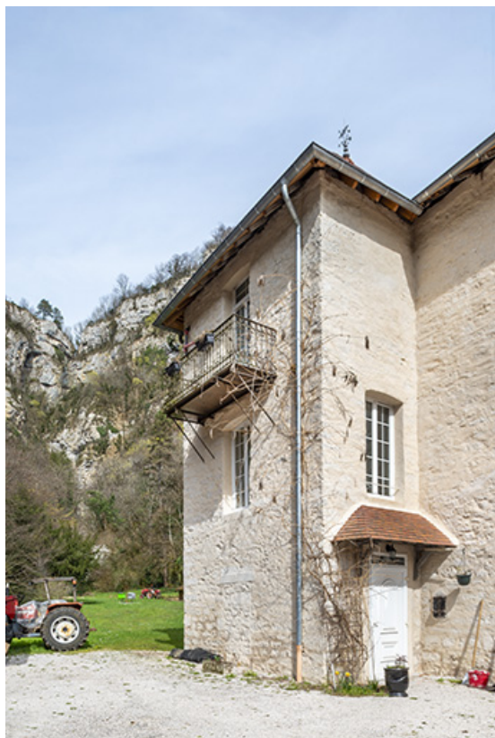
Élévation ouest de l'extrémité du logis.

39, Salins-les-Bains, lieudit : Goailles