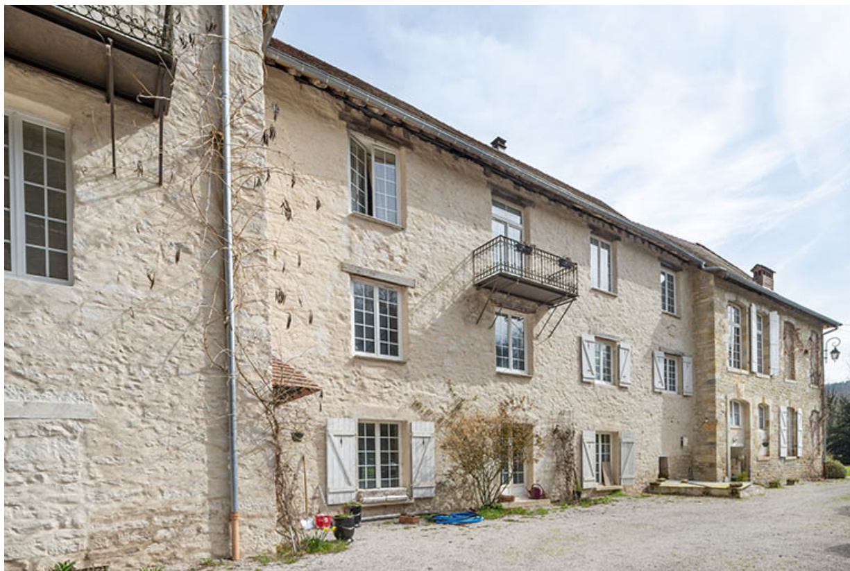
Façades ouest du logis.

39, Salins-les-Bains, lieudit : Goailles