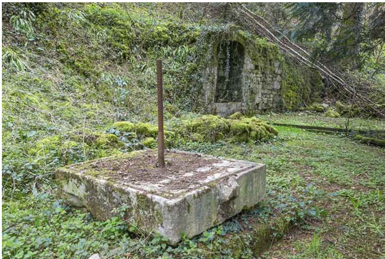
Partie est du parc. Pierre et vis d'un pressoir.

39, Salins-les-Bains, lieudit : Goailles