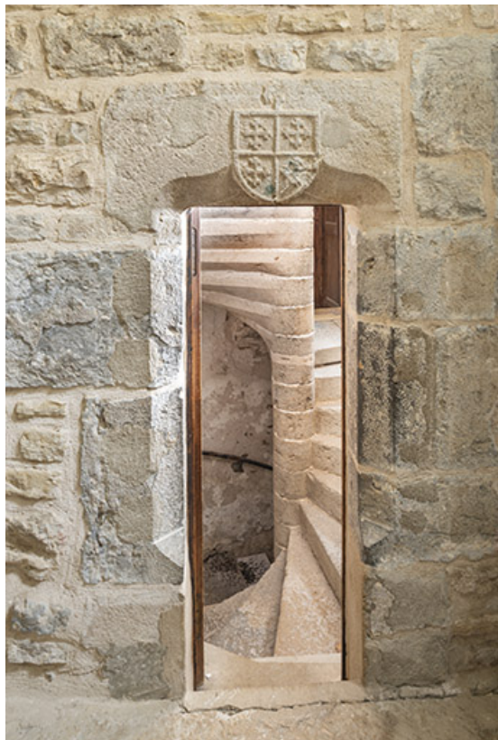
Logis abbatial. Porte (ouverte) dans le mur médiéval.

39, Salins-les-Bains, lieudit : Goailles