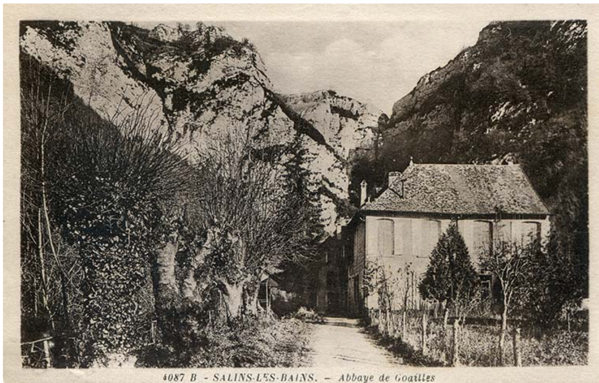
4087 B - SALINS-LES-BAINS. — Abbaye de Goailles

Salins-les-Bains - Abbaye de Goailles, s.d. [début 20e siècle].