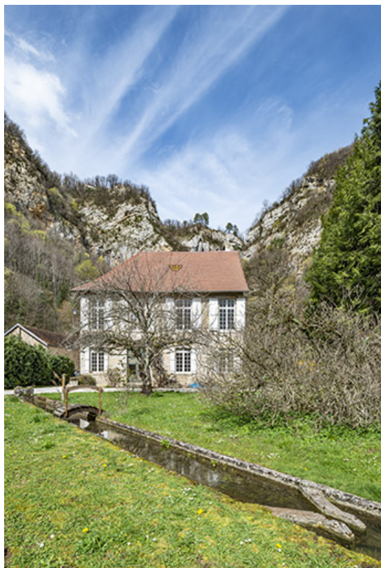
Vue depuis le jardin. Au premier plan, canal d'aménée.

39, Salins-les-Bains, lieudit : Goailles