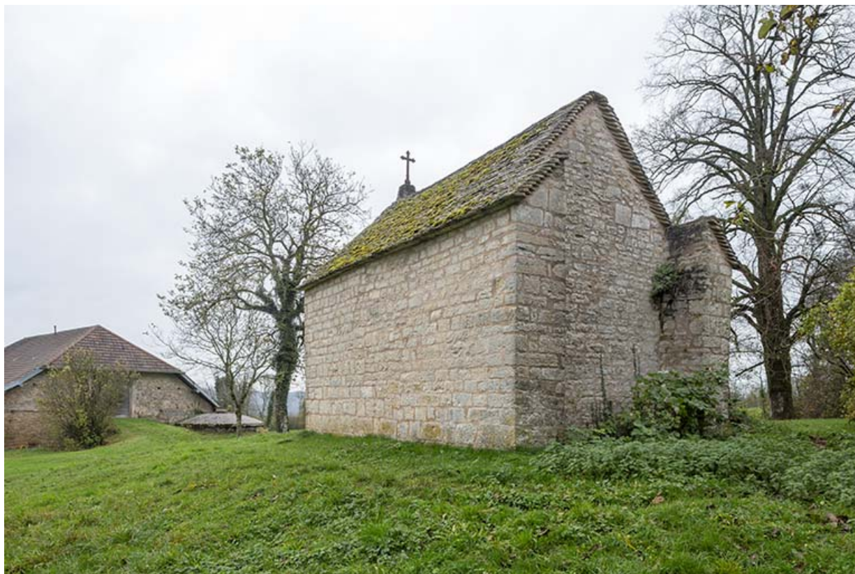
Vue de trois quarts arrière.

39, Salins-les-Bains, lieudit : La Chaux sur Clucy