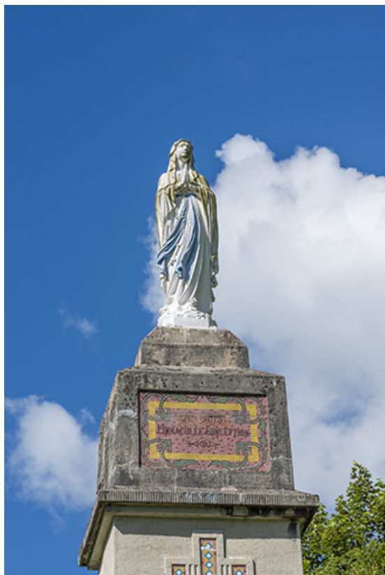
La statue de Notre-Dame de Lourdes.

39, Salins-les-Bains, lieudit : la Pailleuse