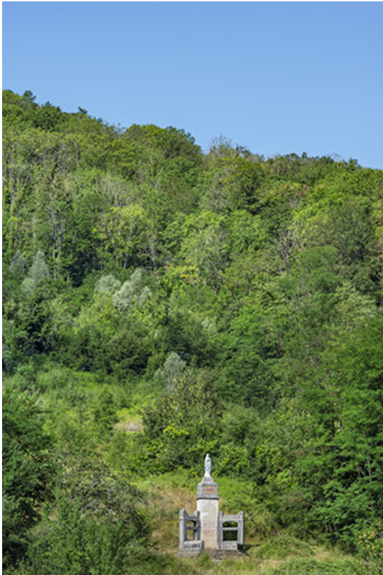
Vue éloignée depuis l'est.

39, Salins-les-Bains, lieudit : la Pailleuse