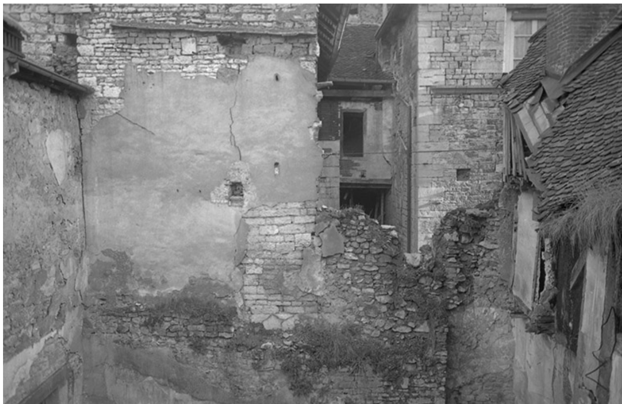
Mur sud de la chapelle, s.d. [vers 1970].

39, Salins-les-Bains, 5, 7 rue du Temple