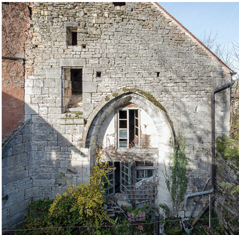
Élévation du mur de chevet. Vue de face.

39, Salins-les-Bains, 5, 7 rue du Temple