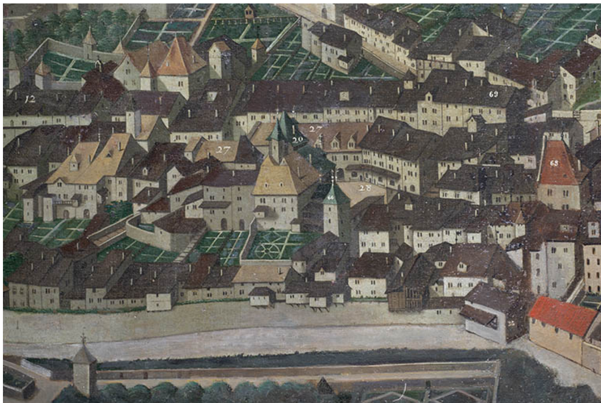
Détail du Bourg-Dessous : le baillage apparaît sous le n°68, à l'extrême droite (1628).