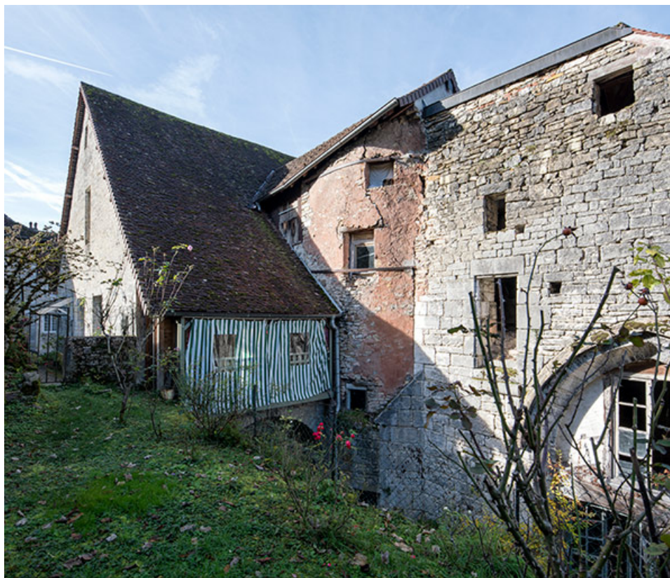
Façade est de la chapelle et de la maison.

39, Salins-les-Bains, 5, 7 rue du Temple