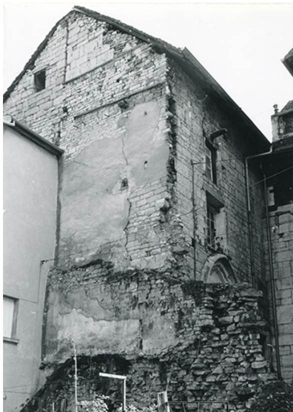
Mur-pignon ouest de la chapelle, 1990.

39, Salins-les-Bains, 5, 7 rue du Temple