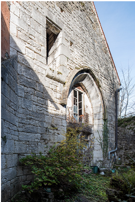
Chevet de la chapelle, vu de trois quarts gauche.

39, Salins-les-Bains, 5, 7 rue du Temple