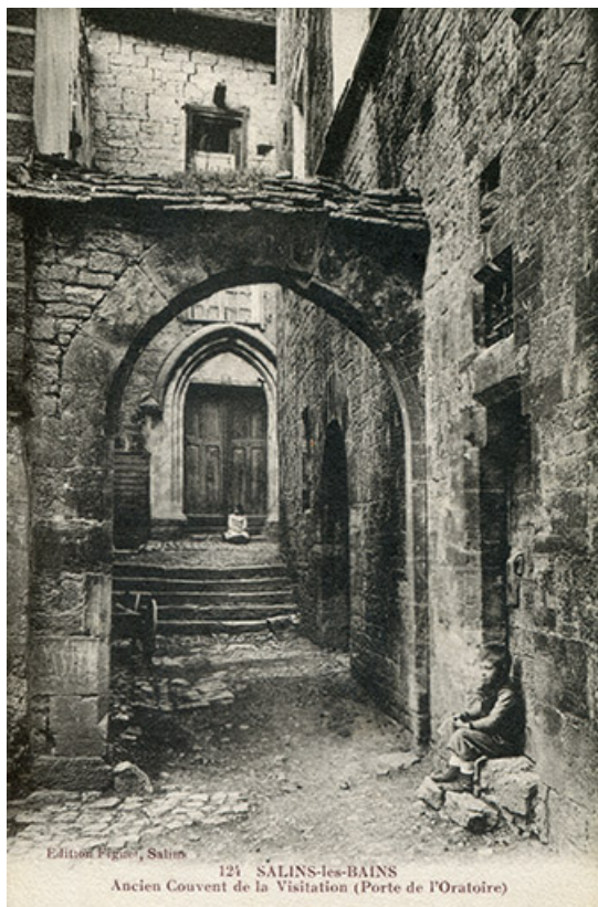
Salins-les-Bains - Ancien couvent de la Visitation (Porte de l'Oratoire), s.d. [fin 19e ou début 20e siècle]. 39, Salins-les-Bains, 5, 7 rue du Temple