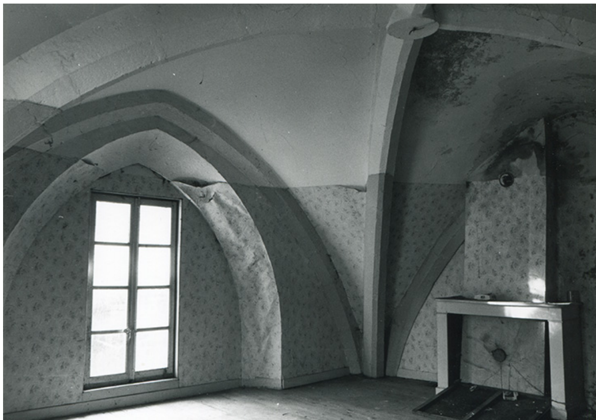
Chapelle. Croisée d'ogives à l'étage, 1990.

39, Salins-les-Bains, 5, 7 rue du Temple