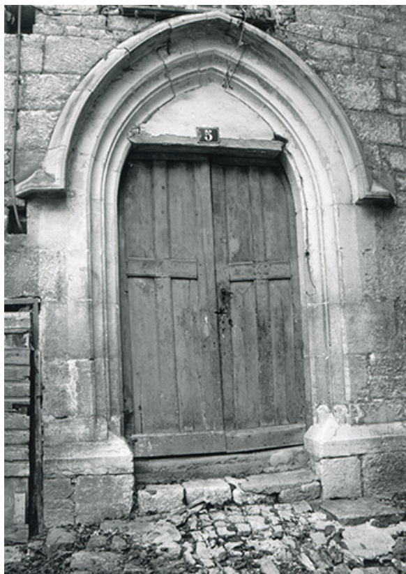
Porte sud de la chapelle, 1990.

39, Salins-les-Bains, 5, 7 rue du Temple