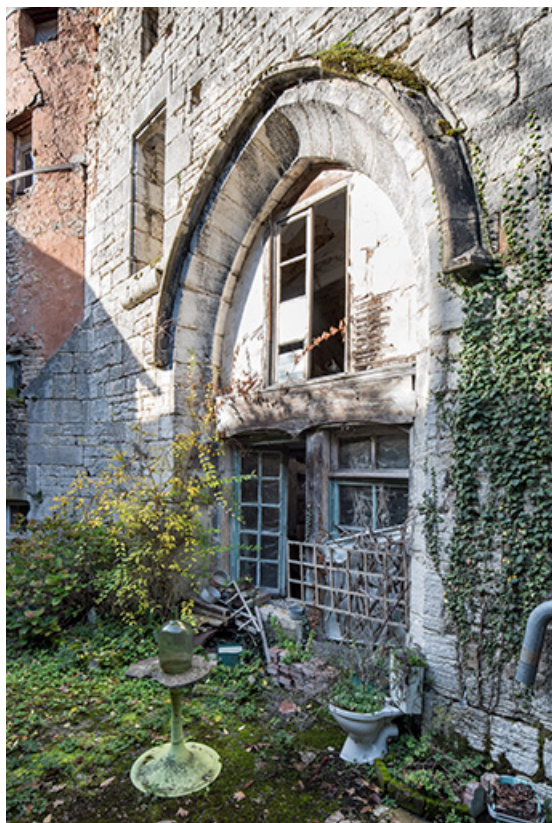
Fenêtre à arc brisé du chevet, vue de trois quarts.

39, Salins-les-Bains, 5, 7 rue du Temple