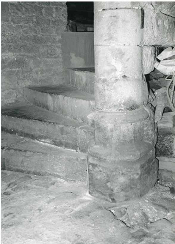
Logis. Base de l'escalier en vis, 1990. 39, Salins-les-Bains, 5, 7 rue du Temple