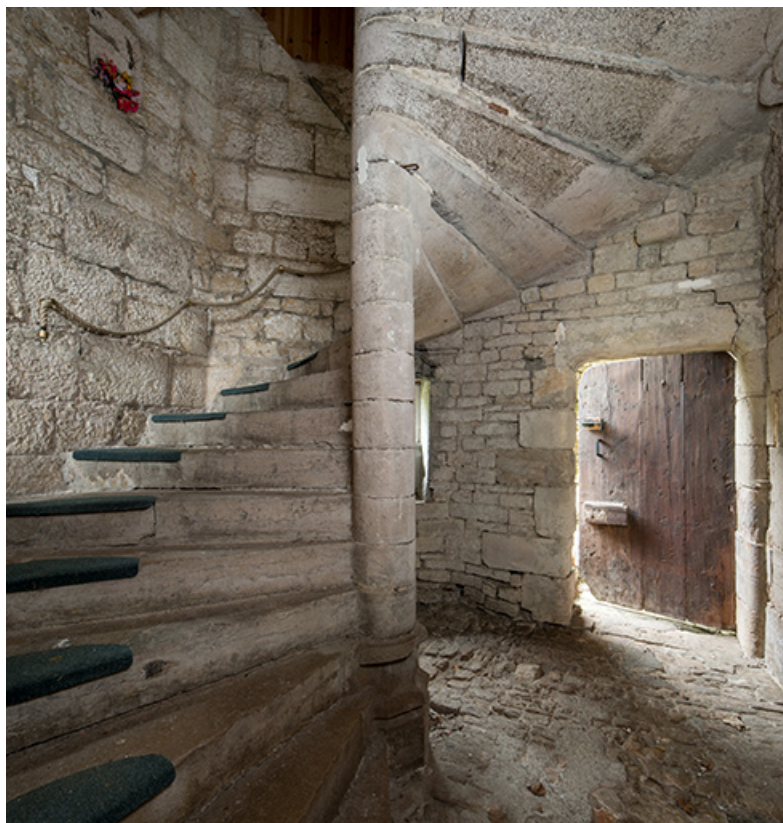
Escalier en vis situé entre la chapelle et la maison.

39, Salins-les-Bains, 5, 7 rue du Temple