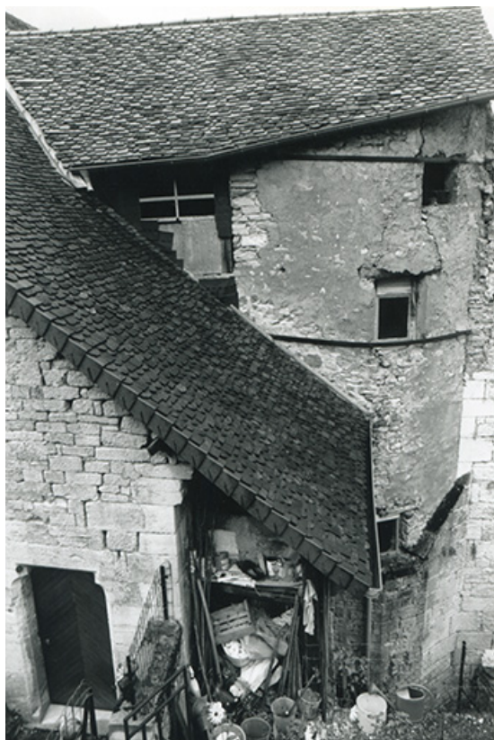
Jonction entre le logis et la chapelle, vue depuis l'est, 1990.

39, Salins-les-Bains, 5, 7 rue du Temple