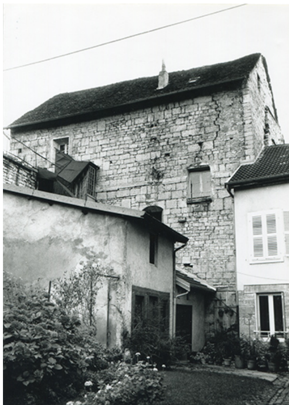
Façade nord de la chapelle, 1990.

39, Salins-les-Bains, 5, 7 rue du Temple