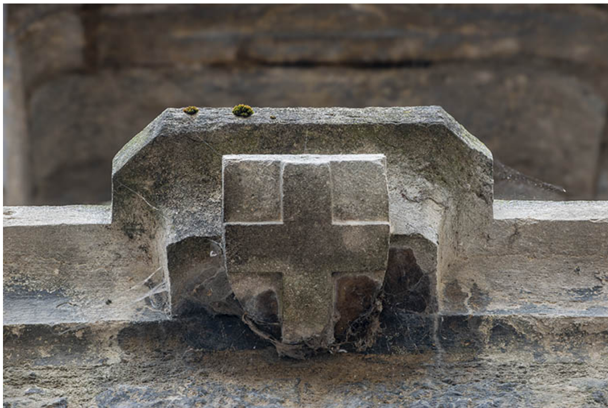
Niche du mur pignon. Détail de l'écusson gravé.

39, Salins-les-Bains, 5, 7 rue du Temple