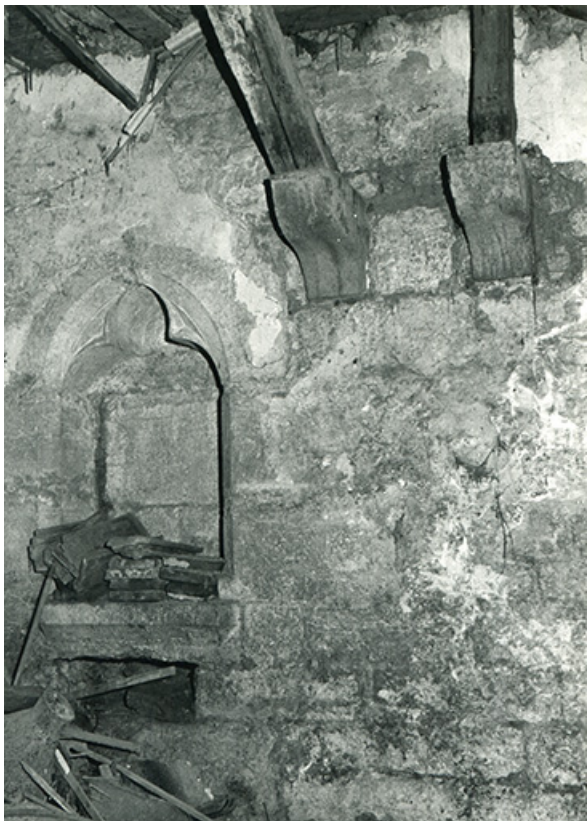
Chapelle. Lavabo, 1990.

39, Salins-les-Bains, 5, 7 rue du Temple