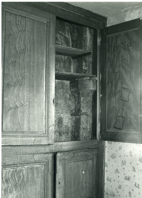
Chapelle. Retombée des ogives sur un pilier octogonal, 1990.

39, Salins-les-Bains, 5, 7 rue du Temple