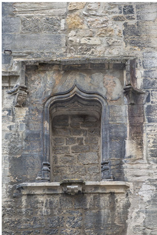
Mur-pignon ouest. Niche située en partie basse, à droite.

39, Salins-les-Bains, 5, 7 rue du Temple