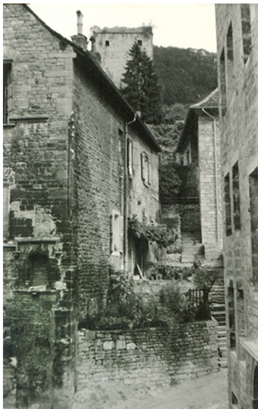
Façade sud de la maison, s.d. [vers 1970].

39, Salins-les-Bains, 5, 7 rue du Temple