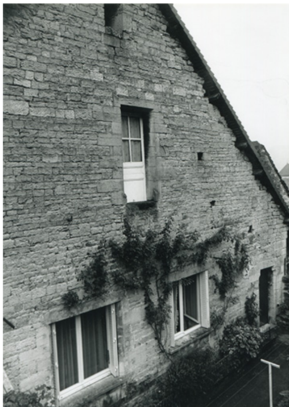
Pignon est du logis, 1990.

39, Salins-les-Bains, 5, 7 rue du Temple