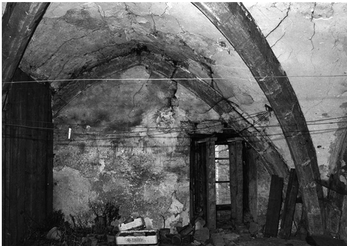
Chapelle. Croisée d'ogives à l'étage, 1990.

39, Salins-les-Bains, 5, 7 rue du Temple