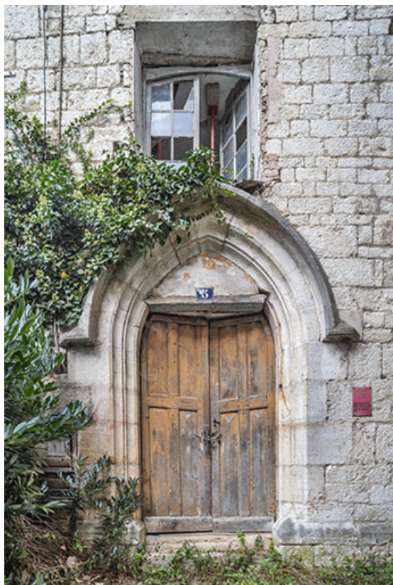
Porte de la chapelle.

39, Salins-les-Bains, 5, 7 rue du Temple