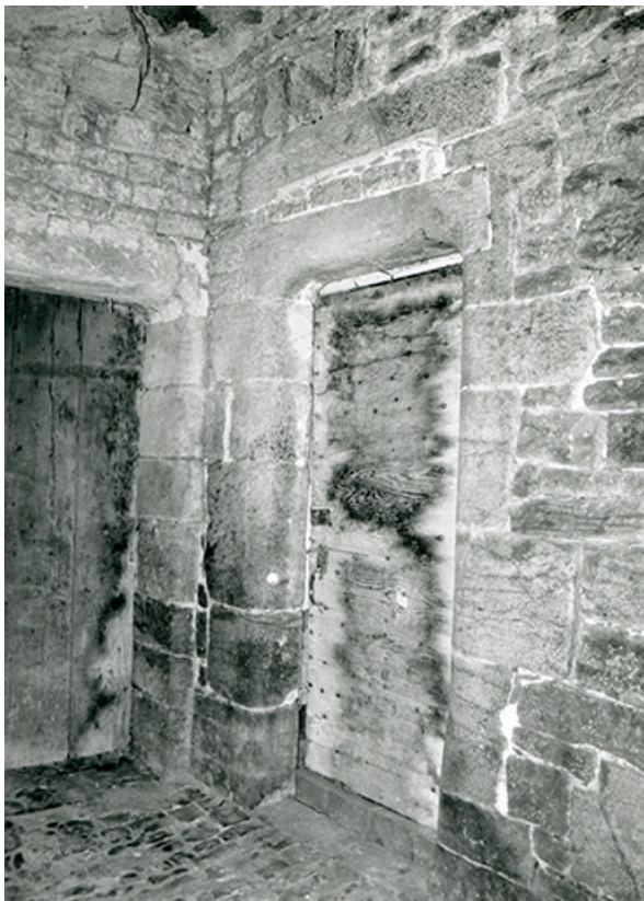
Porte du logis, 1990.

39, Salins-les-Bains, 5, 7 rue du Temple