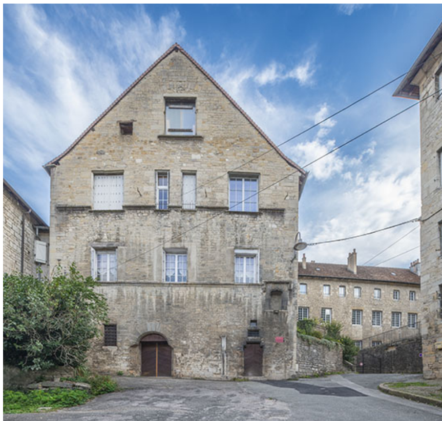
Façade ouest vue de face.

39, Salins-les-Bains, 5, 7 rue du Temple