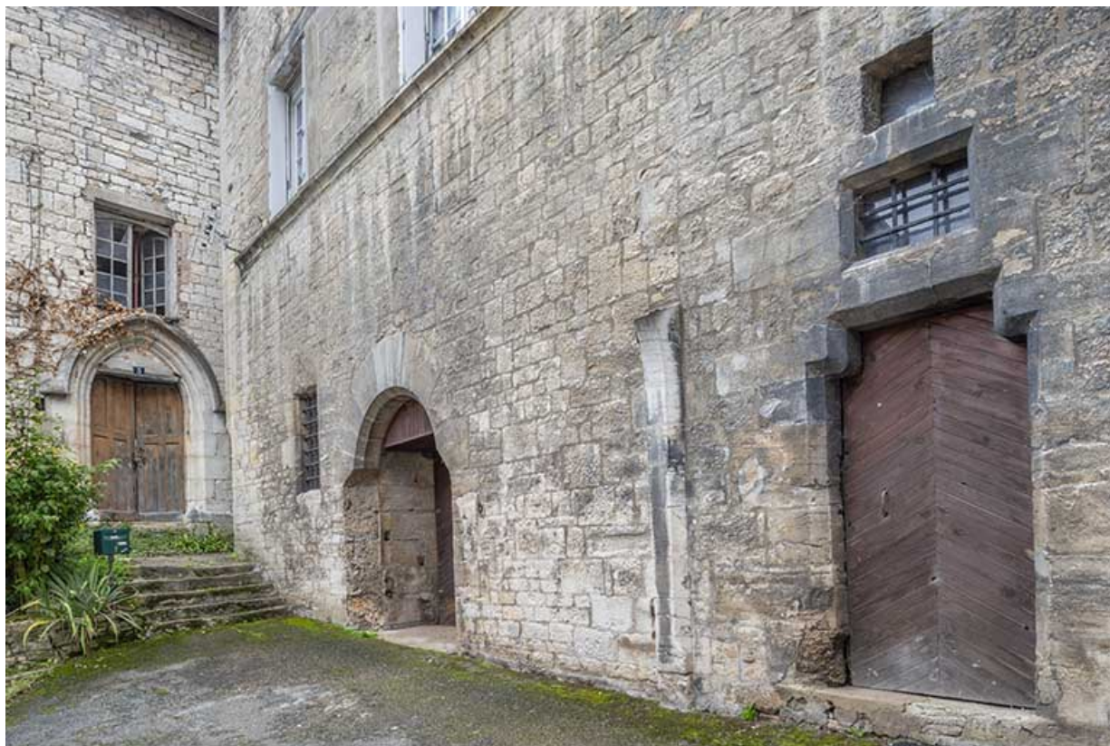
Porte de la chapelle et rez-de-chaussée de la façade ouest.

39, Salins-les-Bains, 5, 7 rue du Temple