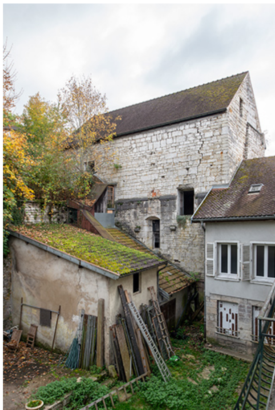
Façade nord de la chapelle, vue de trois quarts droite.

39, Salins-les-Bains, 5, 7 rue du Temple