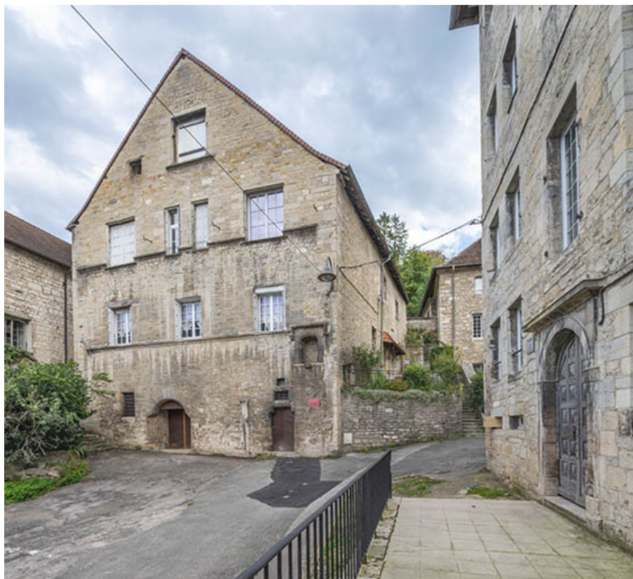
Façade ouest vue de trois quarts droite.

39, Salins-les-Bains, 5, 7 rue du Temple