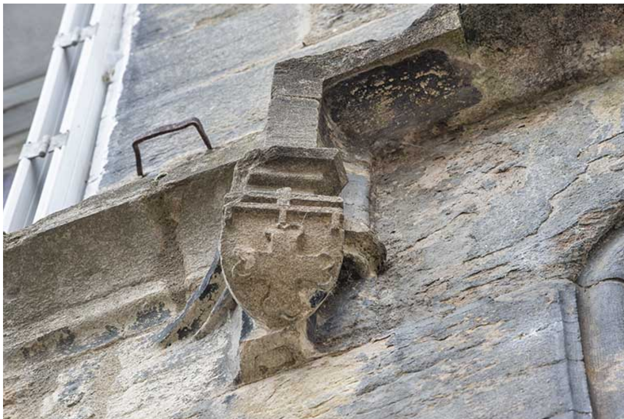
Bandeau surmontant la niche. Détail du culot gauche.

39, Salins-les-Bains, 5, 7 rue du Temple