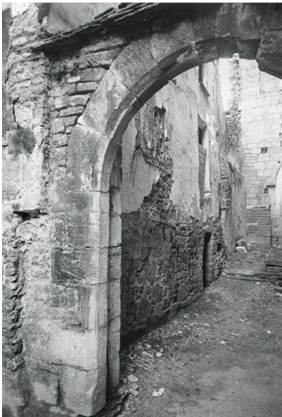
Porte du couloir d'accès à la chapelle, s.d. [vers 1970].

39, Salins-les-Bains, 5, 7 rue du Temple