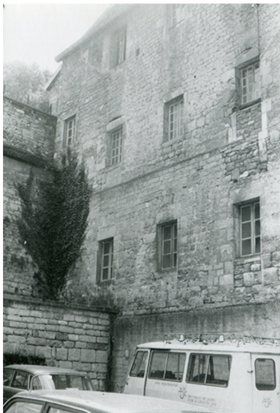
Mur nord, s.d. [vers 1970].

39, Salins-les-Bains, 9 rue des Claristes