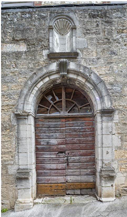
Bâtiment sur rue. Porte sud vue de face.

39, Salins-les-Bains, 9 rue des Claristes