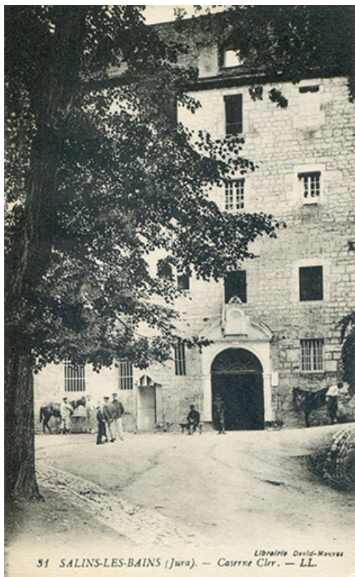
Salins-les-Bains (Jura) - Caserne Cler, s.d. [fin 19e ou début 20e siècle]. 39, Salins-les-Bains, 9 rue des Claristes