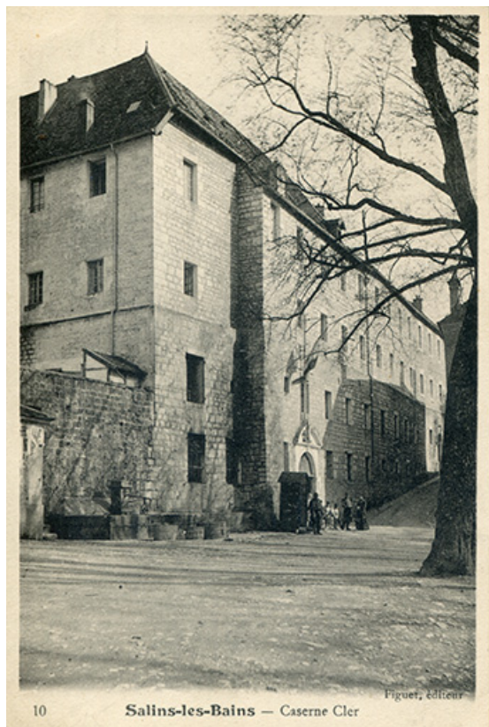
Salins-les-Bains - Caserne Cler, s.d. [début 20e siècle].

39, Salins-les-Bains, 9 rue des Claristes