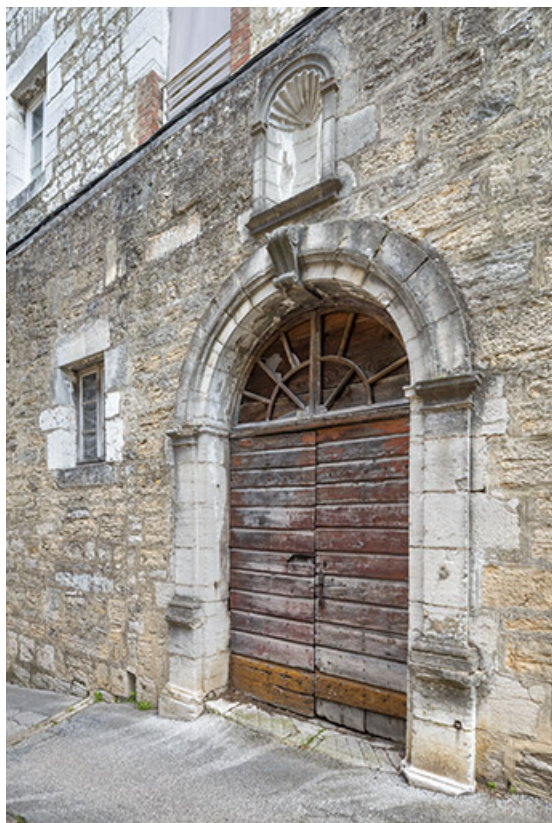
Bâtiment sur rue. Porte sud vue de trois quarts.

39, Salins-les-Bains, 9 rue des Claristes