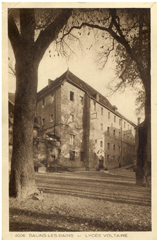
Salins-les-Bains - Lycée Voltaire, s.d. [début 20e siècle]. 39, Salins-les-Bains, 9 rue des Claristes