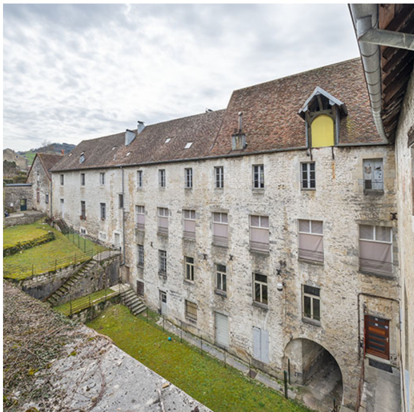
Vue d'ensemble des façades sur cour, depuis le nord-est.

39, Salins-les-Bains, 9 rue des Claristes