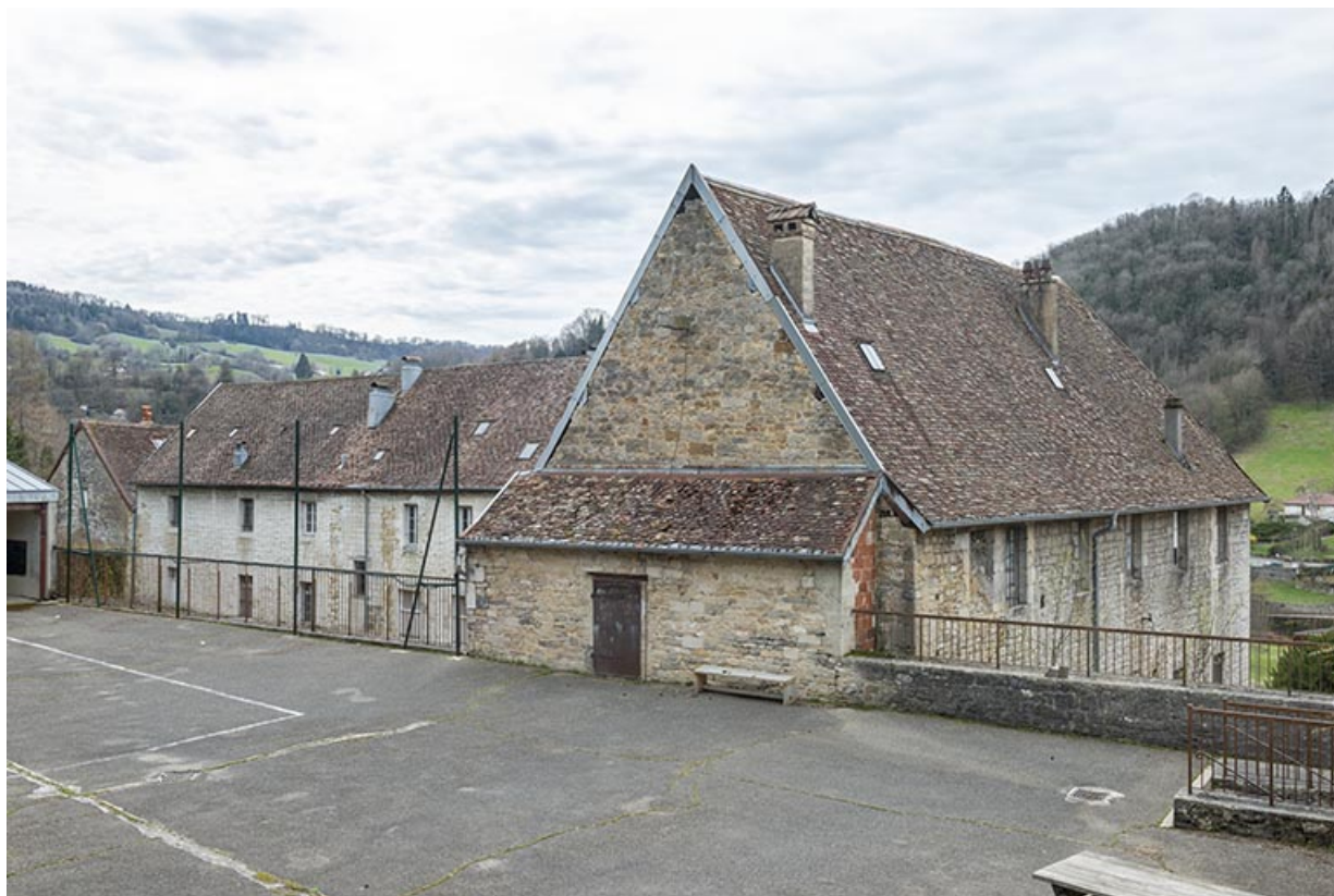
Vue d'ensemble depuis la terrasse, au nord-est.

39, Salins-les-Bains, 9 rue des Claristes