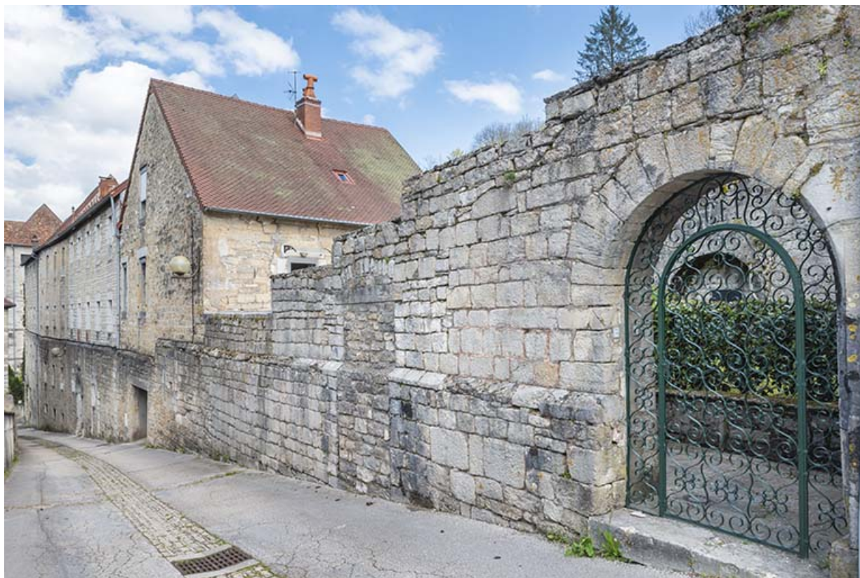
Vue d'ensemble des bâtiments sur rue, depuis le sud.

39, Salins-les-Bains, 9 rue des Claristes