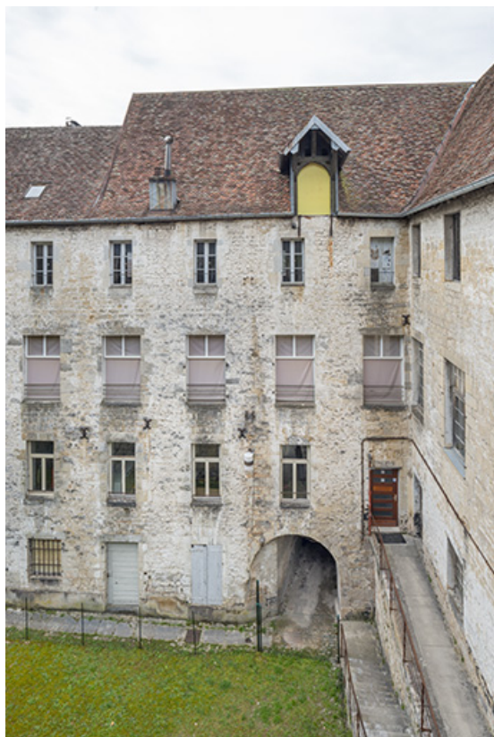
Travées nord de la façade sur cour, depuis la terrasse est. 39, Salins-les-Bains, 9 rue des Claristes