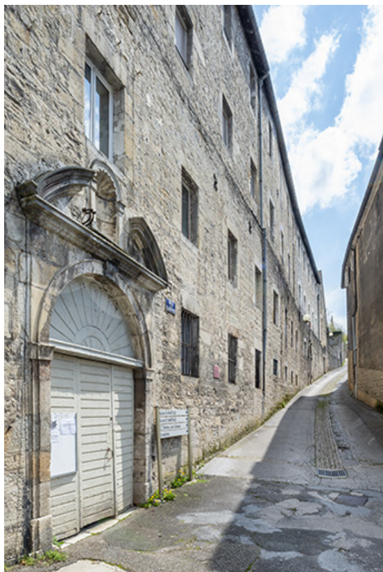
Élévation du bâtiment sur rue, depuis le nord.

39, Salins-les-Bains, 9 rue des Claristes