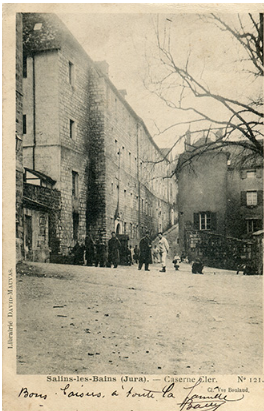
Salins-les-Bains (Jura) - Caserne Cler, s.d. [début 20e siècle]. 39, Salins-les-Bains, 9 rue des Claristes