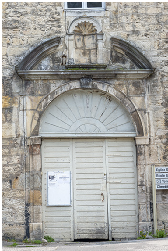
Porte principale du bâtiment sur rue. Vue de face.

39, Salins-les-Bains, 9 rue des Claristes