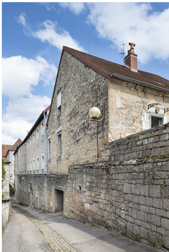
Façade sur rue des bâtiments, depuis le sud.

39, Salins-les-Bains, 9 rue des Claristes