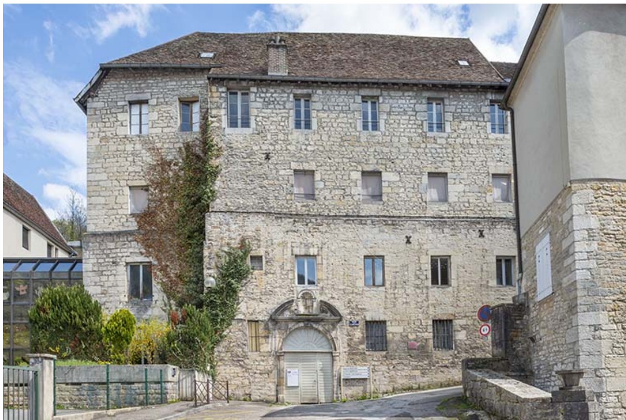
Extrémité nord du bâtiment, depuis l'ouest.

39, Salins-les-Bains, 9 rue des Claristes