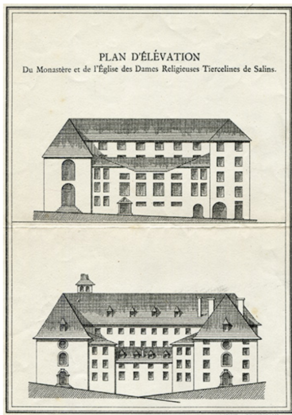
Plan d'élévation du monastère et de l'église des Dames religieuses Tiercelines de Salins, s.d. [1793].