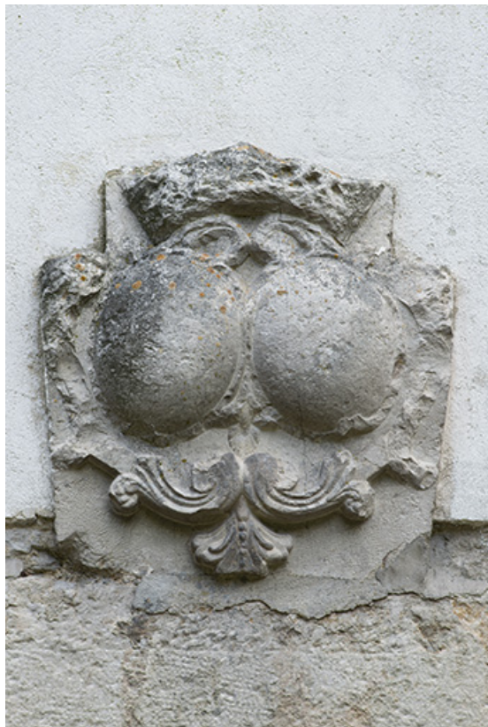
Élément sculpté, inséré dans le mur nord des communs (armes de Girod de Miserey ?).

39, Salins-les-Bains, 8 rue de la République