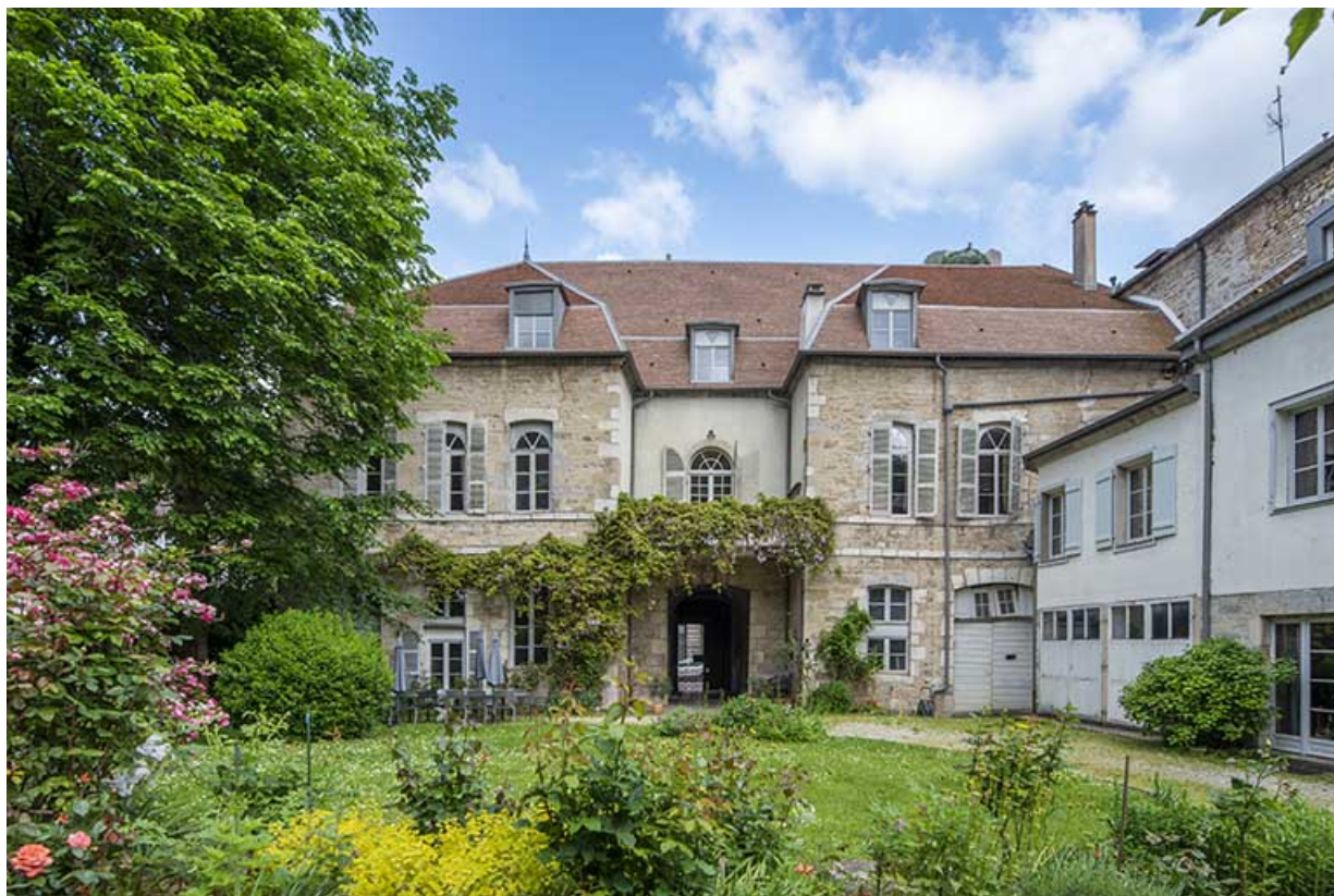
Façade postérieure vue depuis le jardin.

39, Salins-les-Bains, 8 rue de la République