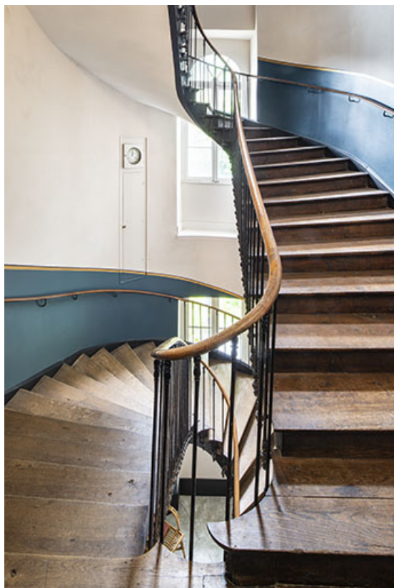
Cage de l'escalier, depuis le premier palier (aile nord). 39, Salins-les-Bains, 8 rue de la République