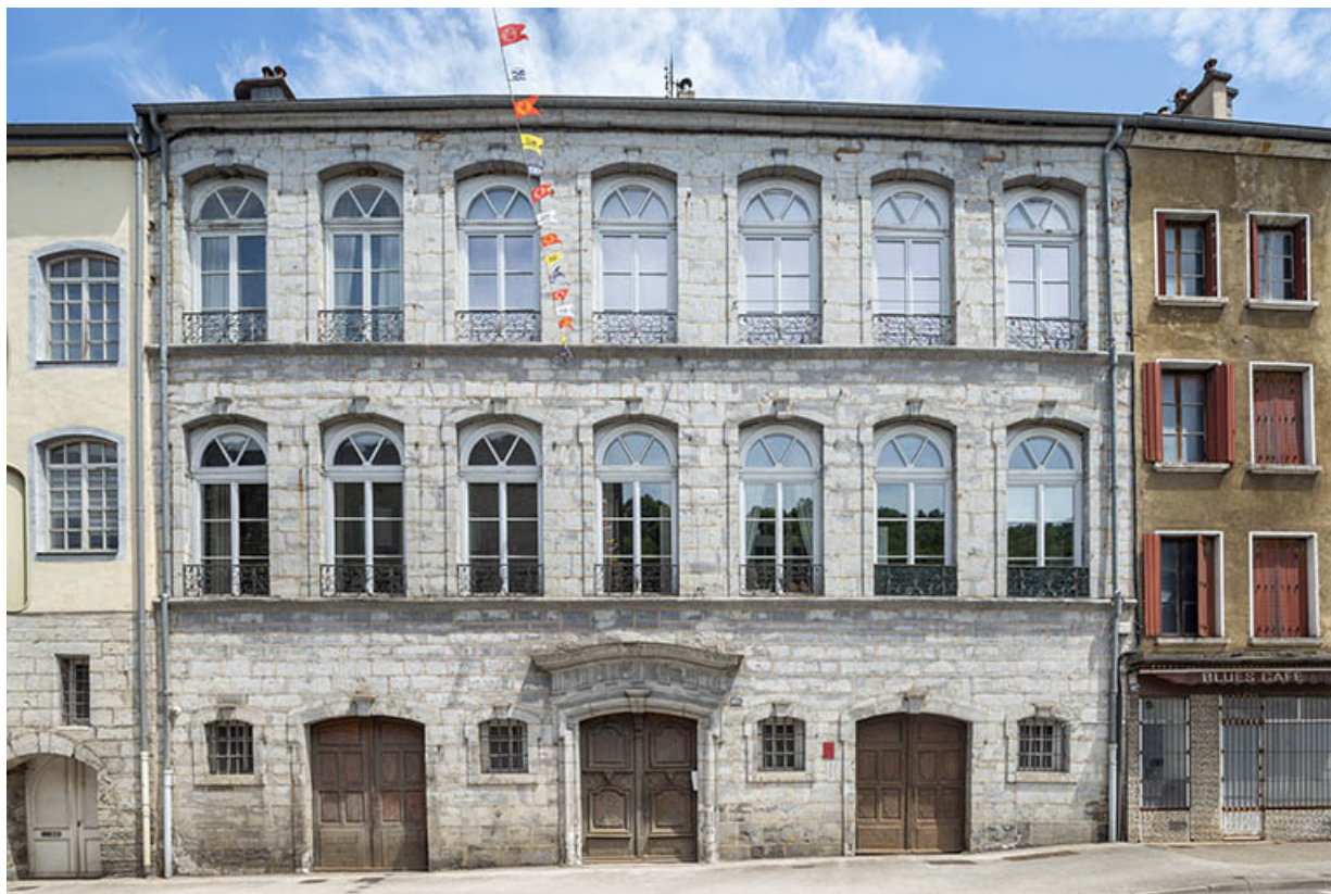
Façade antérieure vue de face.

39, Salins-les-Bains, 105 rue de la République