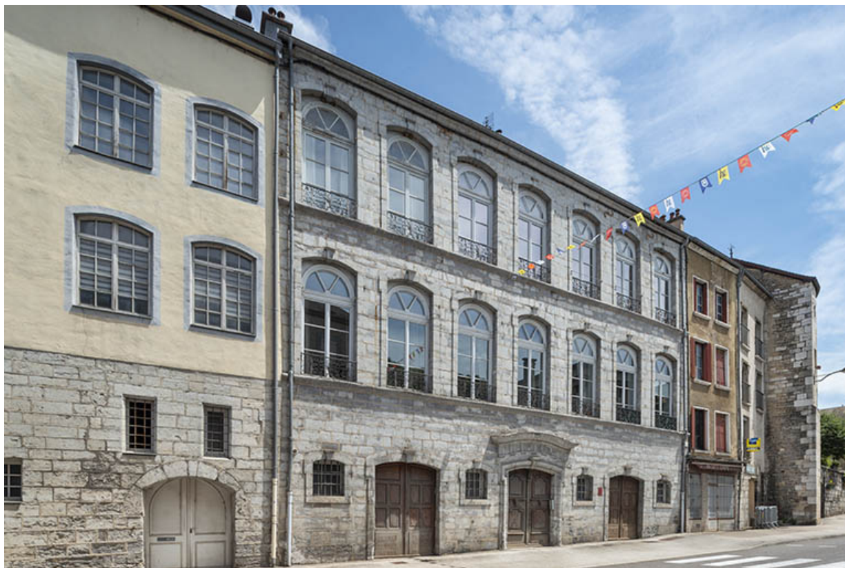
Façade antérieure vue de trois quarts gauche.

39, Salins-les-Bains, 105 rue de la République