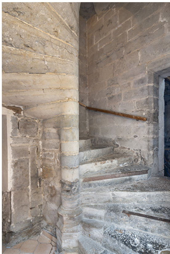
Escalier en vis (bâtiment sur rue).

39, Salins-les-Bains, 103 rue de la République