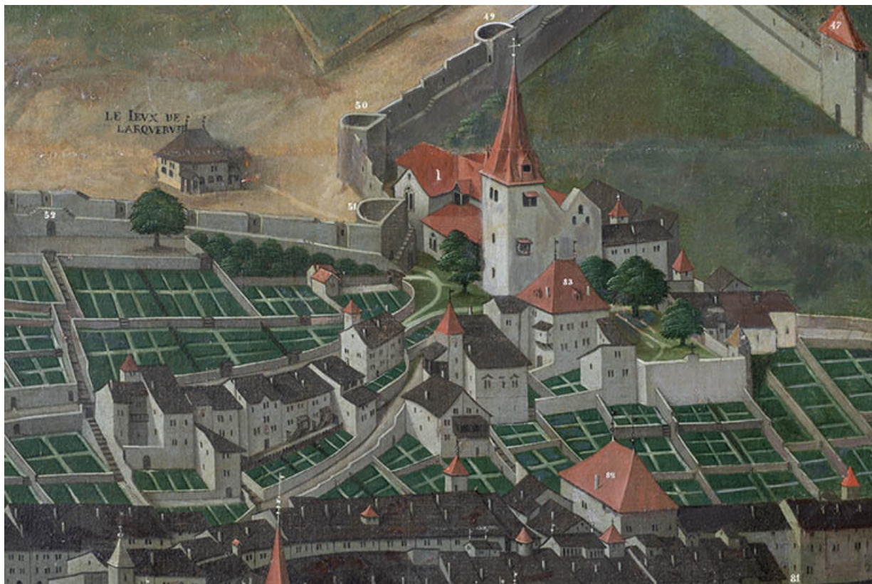
Détail du tableau de Nicolas Richard : La Prévôté (n°83) [entre 1630 et 1650]. 39, Salins-les-Bains, 8 rue des Claristes