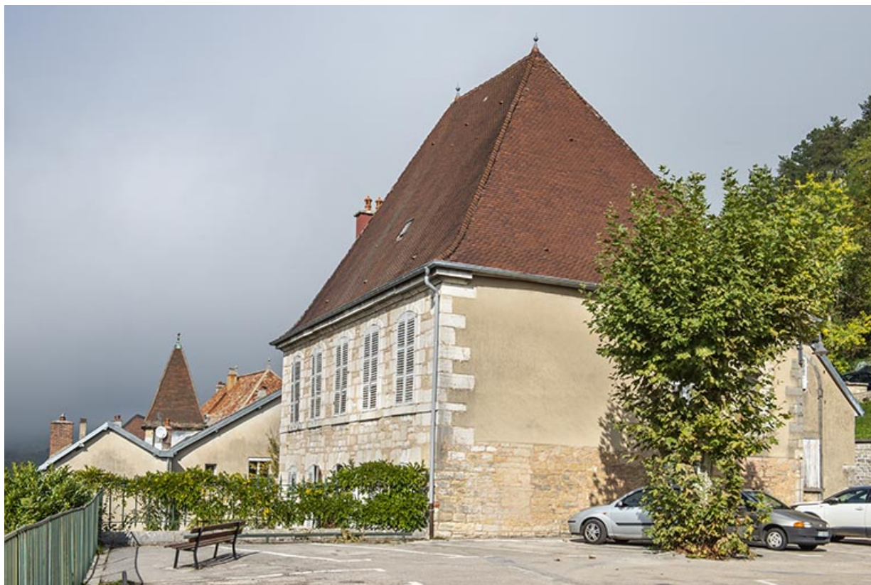
Vue de trois quarts, depuis la place de l'église.

39, Salins-les-Bains, 1 place Saint-Anatoile