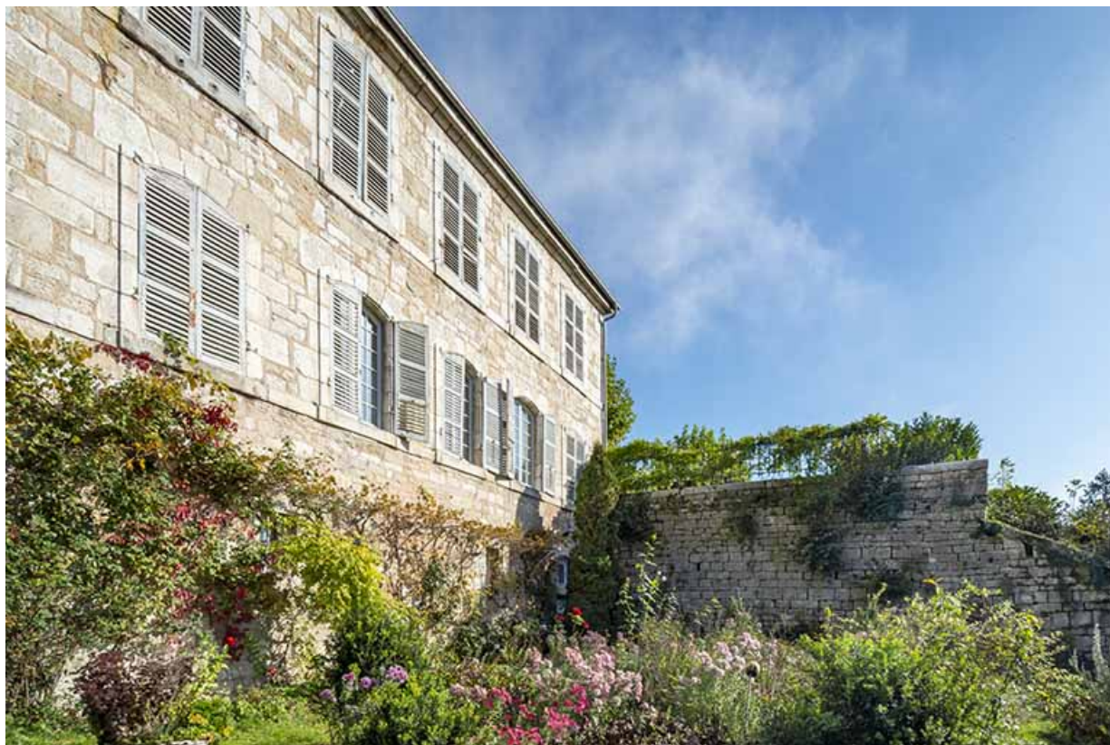
Façade ouest vue de trois quarts droite.

39, Salins-les-Bains, 1 place Saint-Anatoile