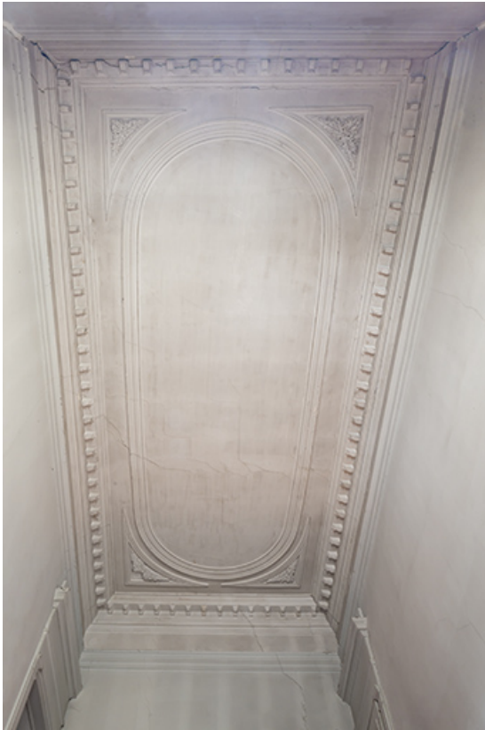
Plafond de la cage d'escalier.

39, Salins-les-Bains, 1 place Saint-Anatoile