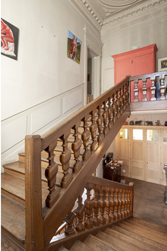
Volée d'accès à l'étage.

39, Salins-les-Bains, 1 place Saint-Anatoile