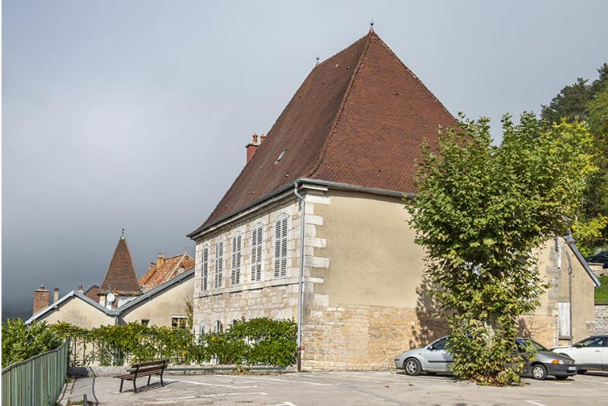
Vue de trois quarts, depuis la place de l'église.

39, Salins-les-Bains, 1 place Saint-Anatoile