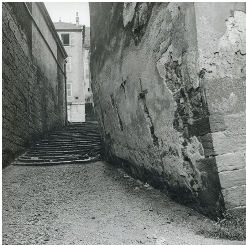
Passage de l'escalier de Falletans (ou d'Arion), s.d. [années 1950]. 39, Salins-les-Bains, 6 rue Gambetta