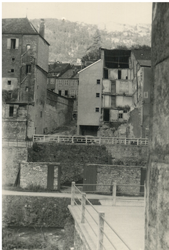
Vue d'ensemble depuis l'ouest. Mur sud de la tour et de l'escalier d'Arion (ou de Falletans), s.d. [vers 1959]. 39, Salins-les-Bains, 13 rue de la Liberté