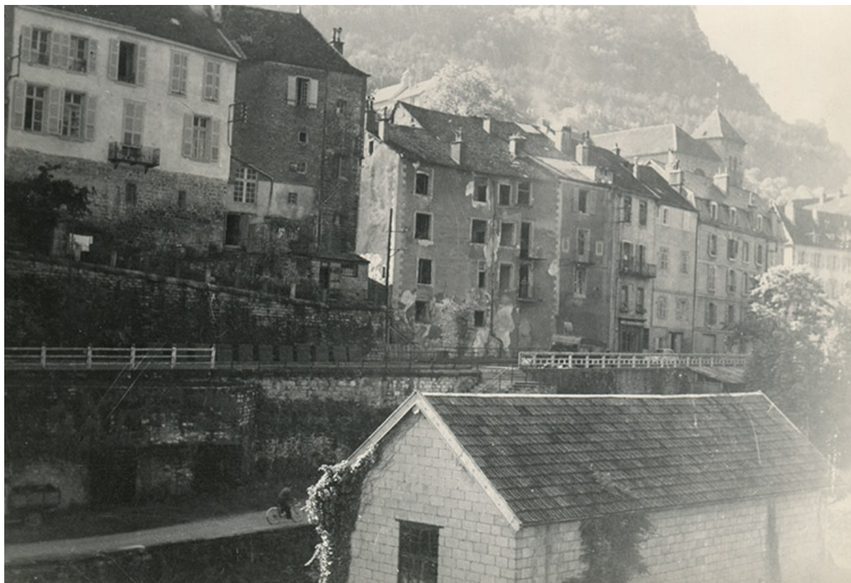
Vue d'ensemble depuis le nord-ouest, avant démolition, s.d. [vers 1957].