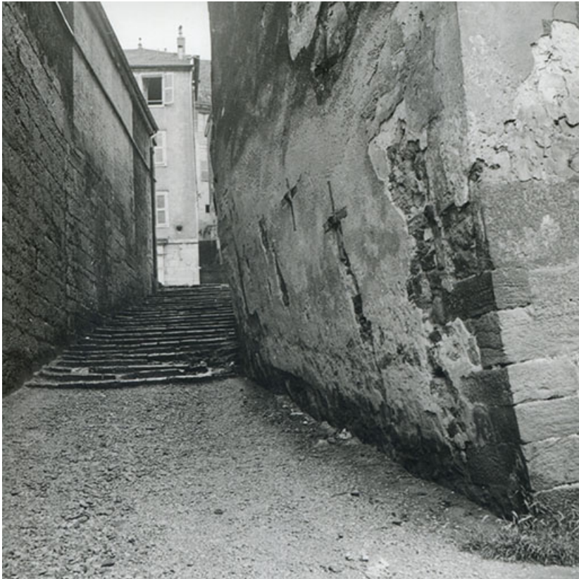
Passage de l'escalier de Falletans (ou d'Arion), s.d. [années 1950]. 39, Salins-les-Bains, 6 rue Gambetta

Passage de l'escalier de Falletans (ou d'Arion), fotogr. Georges Chenu, s.d. [années 1950]. Collection particulière : Georges Chenu