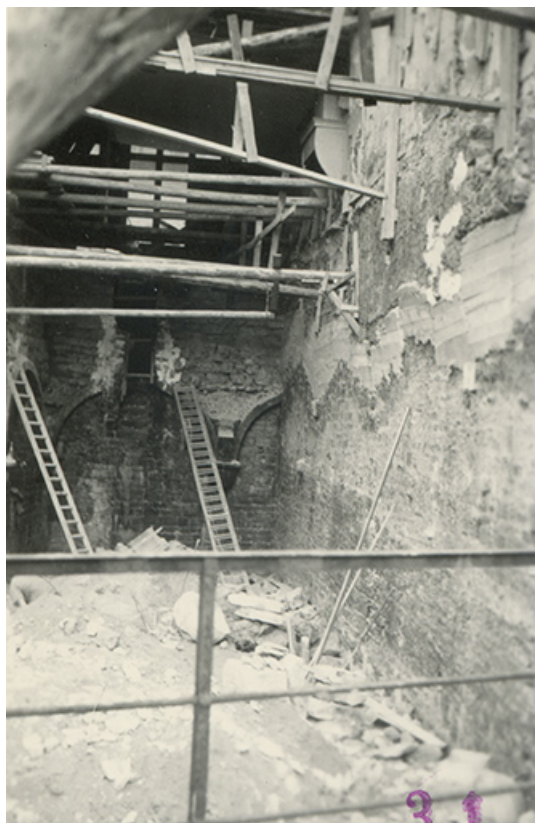
Vue de la cave pendant les travaux de démolition, s.d. [1958].