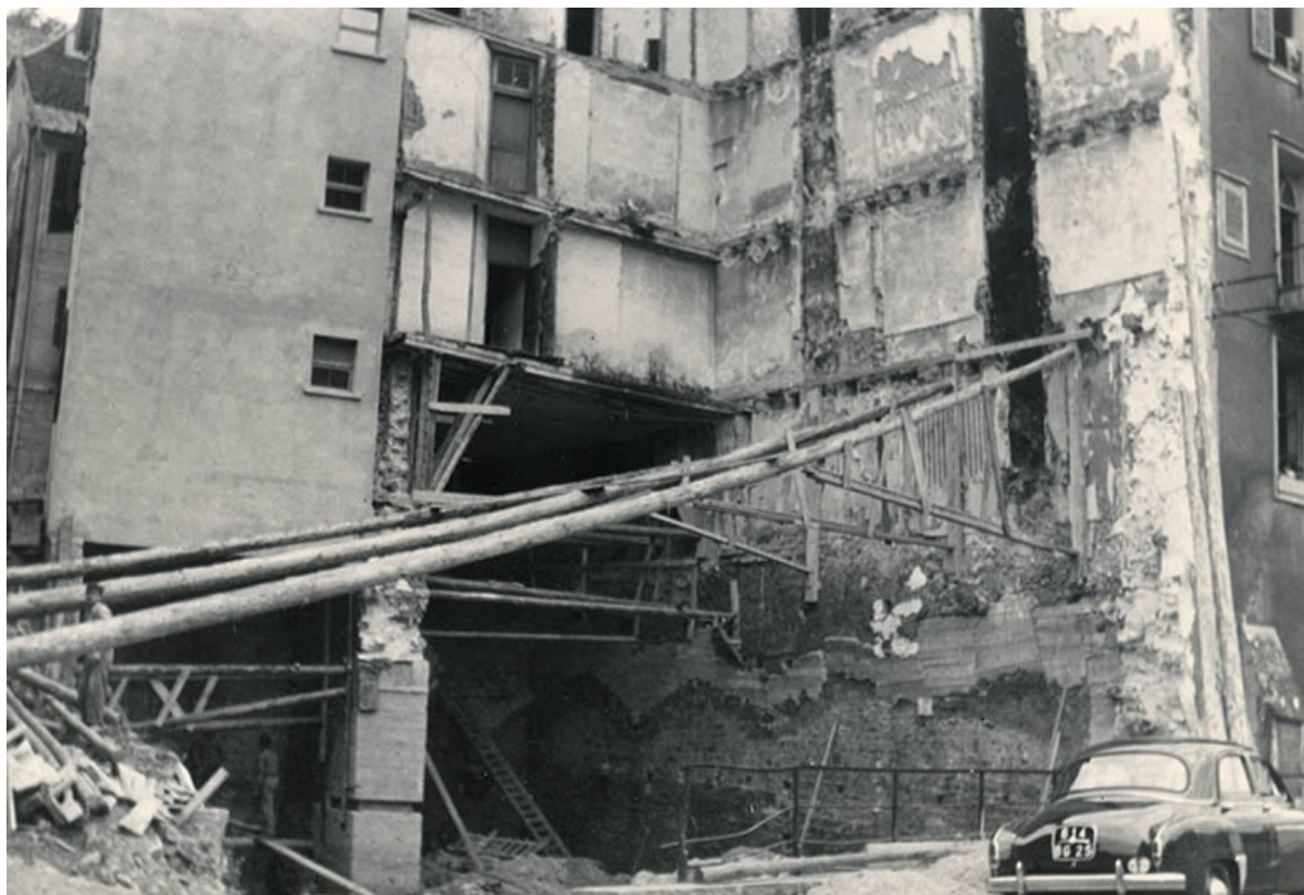
Etresillons épaulant l'immeuble mitoyen (n°7).