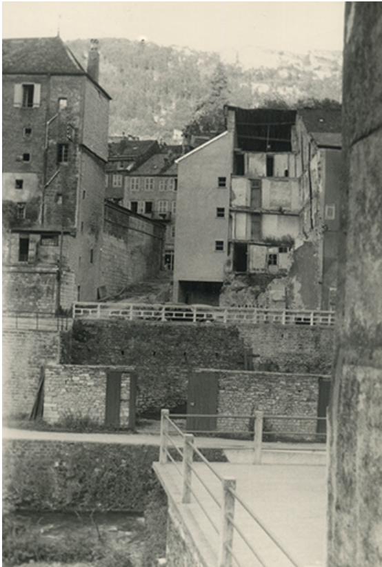
Vue d'ensemble depuis l'ouest. Mur sud de la tour et de l'escalier d'Arion (ou de Falletans), s.d. [vers 1959]. 39, Salins-les-Bains, 6 rue Gambetta

Archives municipales, Salins-les-Bains : ACS 1721. Vue depuis l'ouest après démolition, s.d. [vers 1959]. Lieu de conservation : Archives municipales, Salins-les-Bains - Cote du document : ACS 1721