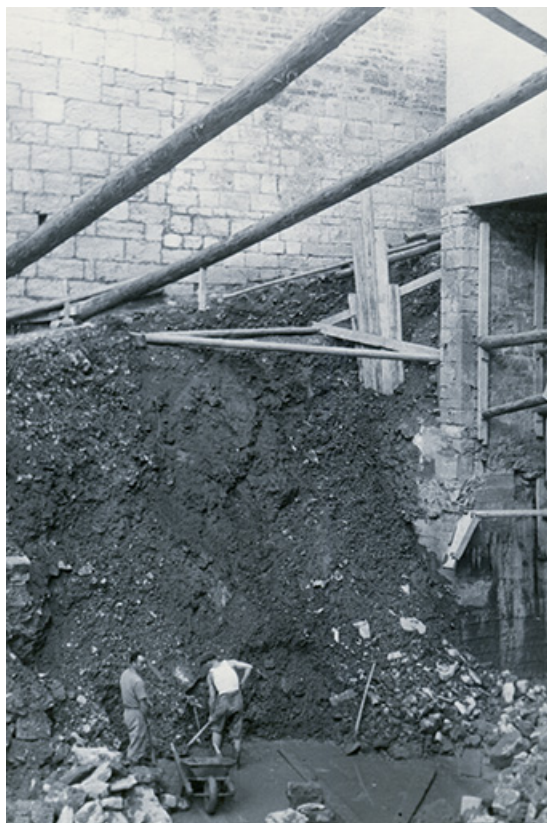
Remblai au pied du mur de l'escalier de Falletans, s.d. [vers 1958]. 39, Salins-les-Bains, 6 rue Gambetta