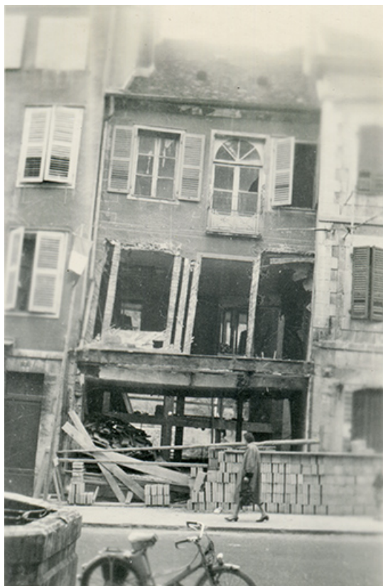
Etat de la façade du n°9 rue de la Liberté en 1958.