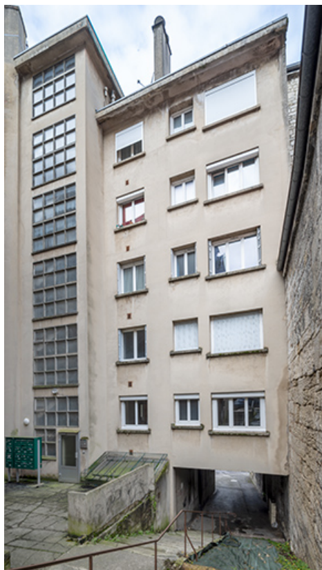
Cage d'escalier et façade est depuis l'escalier d'Arion.