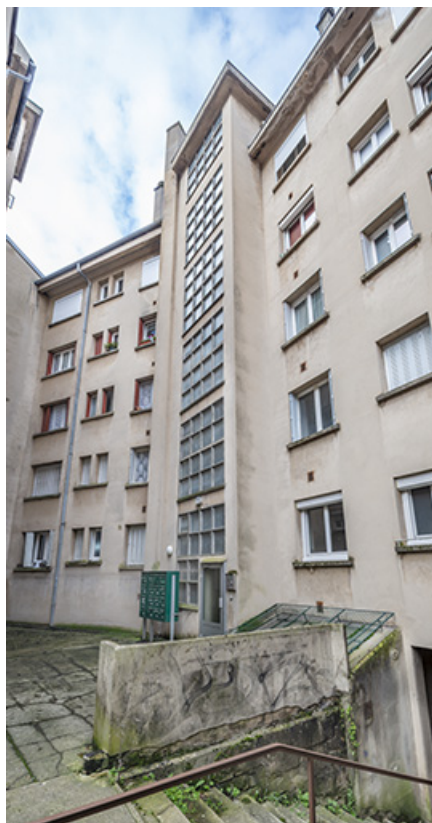
Elévation de la façade est, depuis l'escalier d'Arion.