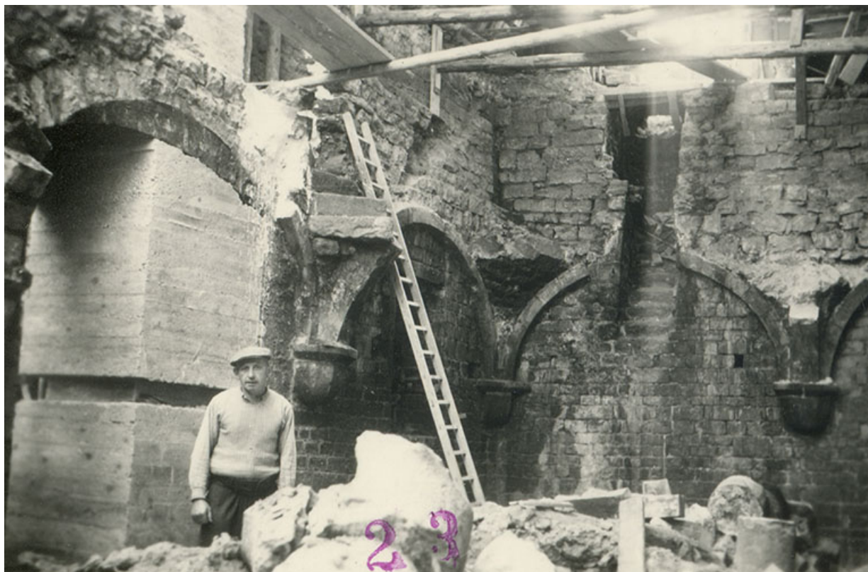
Vue de la cave pendant les travaux de démolition, s.d. [1958].