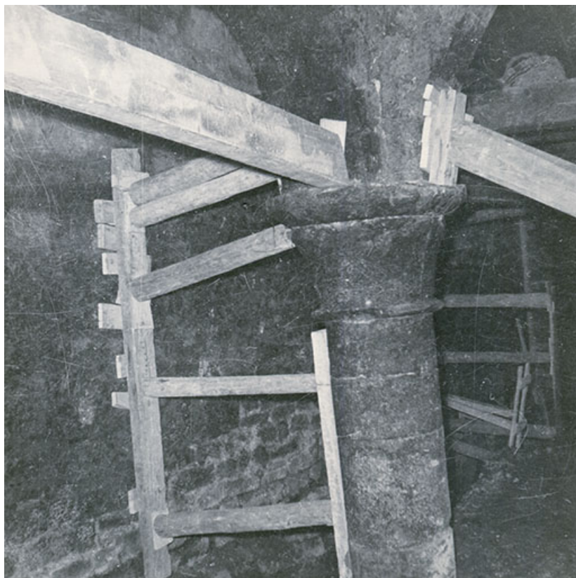
Pilier de la cave, s.d. [vers 1959].