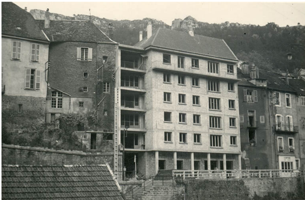
Immeuble en voie d'achèvement, s.d. [vers 1961].