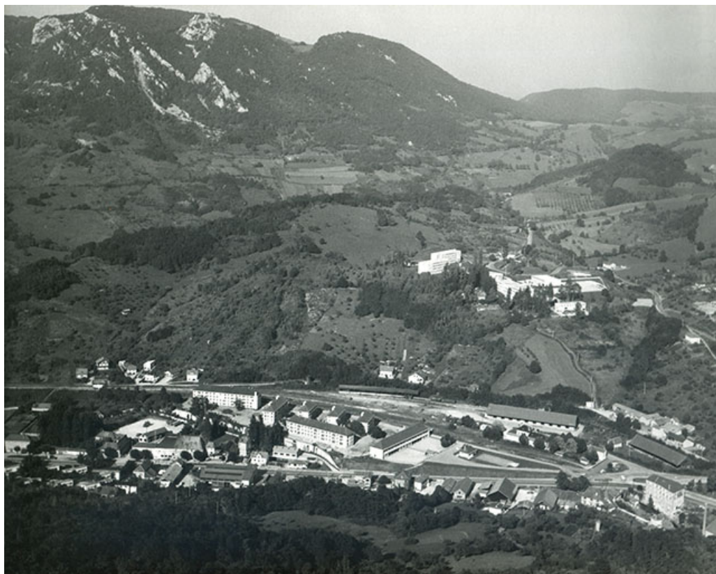
Vue plongeante depuis l'ouest, s.d. [vers 1975].

39, Salins-les-Bains avenue Charles de Gaulle