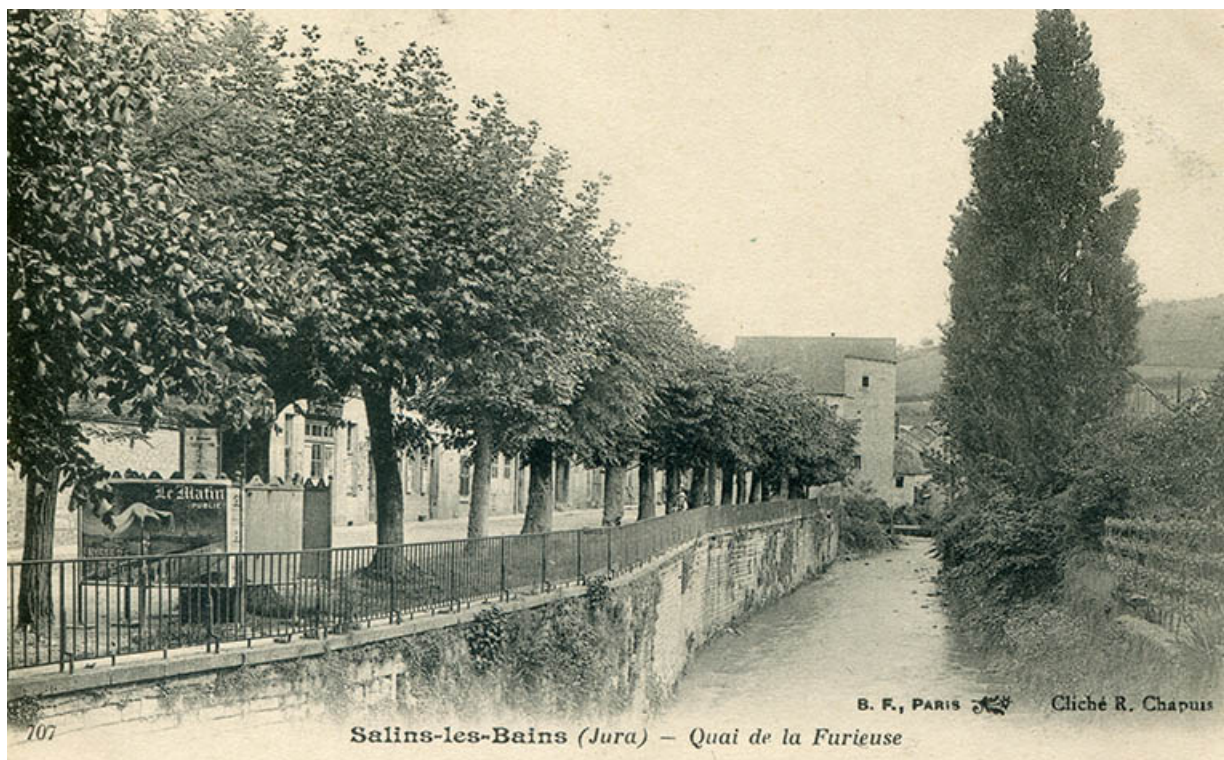
Salins-les-Bains (Jura) - Quai de la Furieuse, s.d. [fin 19e ou début 20e siècle].