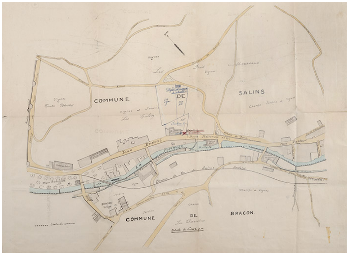
Etablissement d'un dépôt d'essence - MaisonGrandvoinet, 1925.

39, Salins-les-Bains, 1, 3 place Aubarède