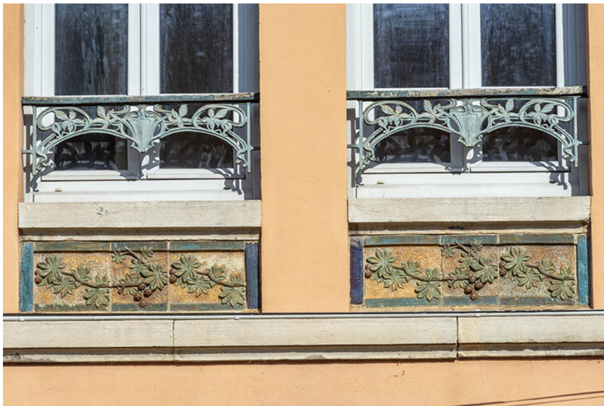
Façade nord. Détail des allèges de l'étage.

39, Salins-les-Bains, 1, 3 place Aubarède