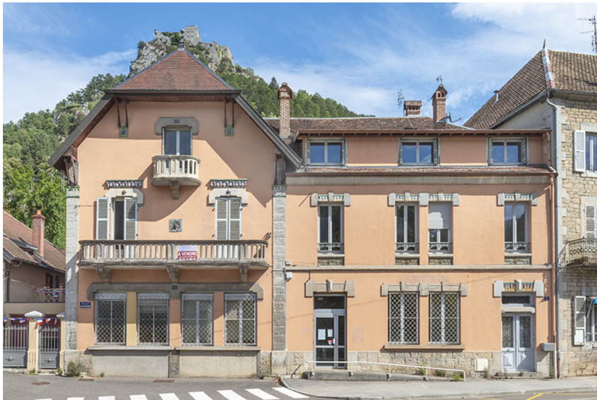
Vue de face (partie nord).

39, Salins-les-Bains, 1, 3 place Aubarède