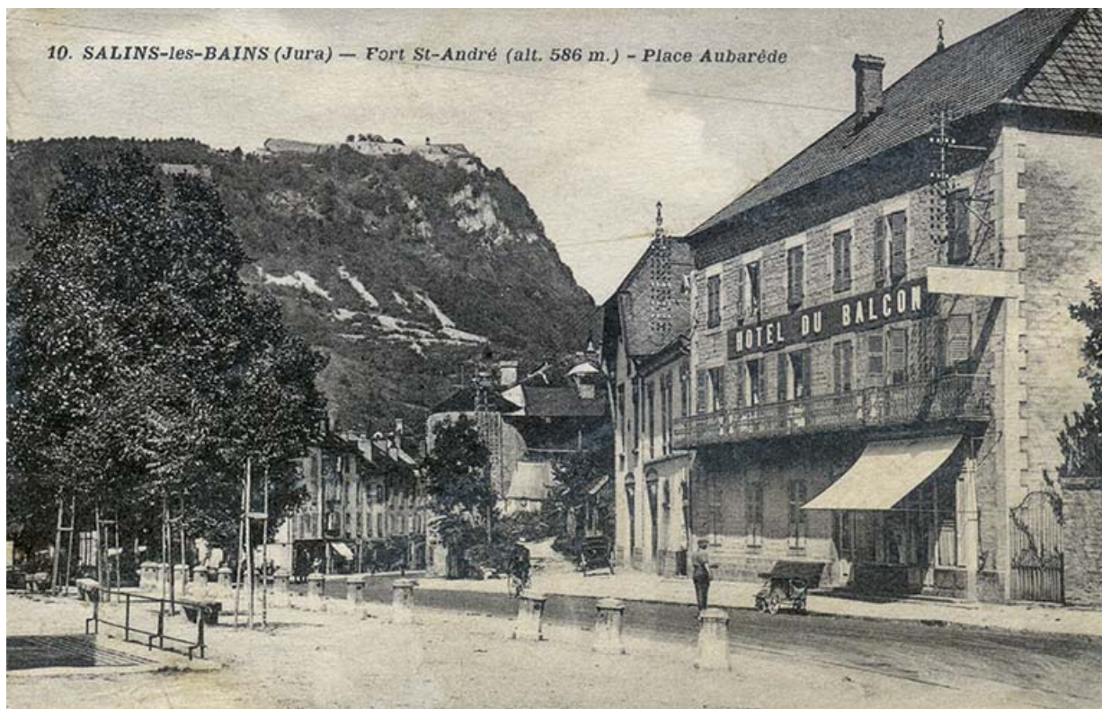
Salins-les-Bains (Jura) - Fort Saint-André - Place Aubarède, s.d. [début 20e siècle].

39, Salins-les-Bains, 1, 3 place Aubarède