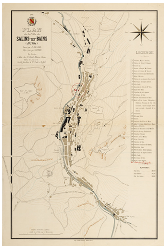
Plan de la ville de Salins-les-Bains, 1901.

39, Salins-les-Bains, 1, 3 place Aubarède