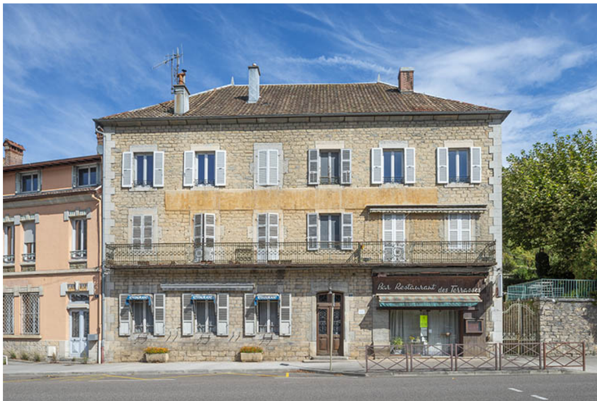
Vue de face (partie sud).

39, Salins-les-Bains, 1, 3 place Aubarède