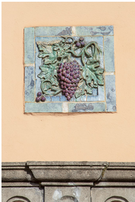
Façade de la partie nord. Détail d'un élément de décor.

39, Salins-les-Bains, 1, 3 place Aubarède