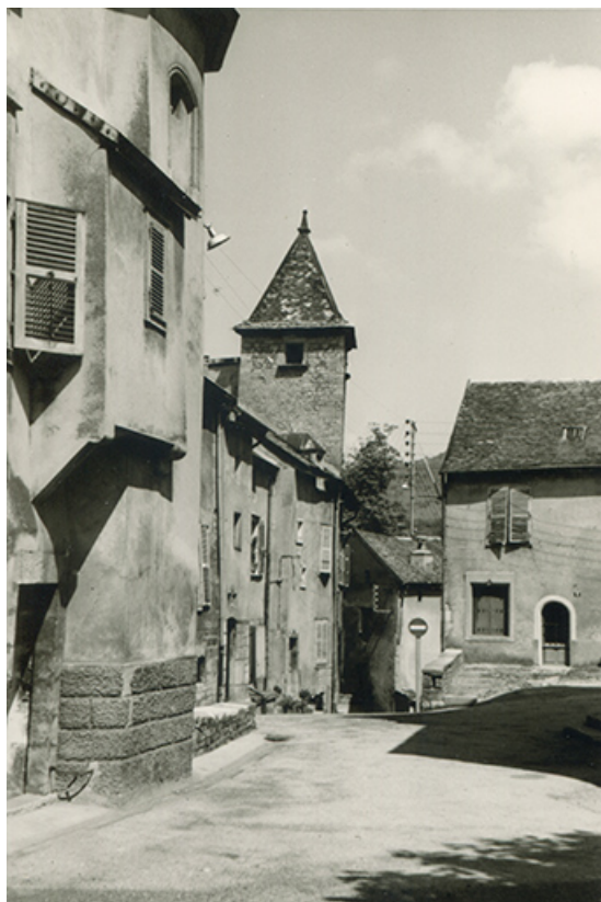
Vue d'ensemble depuis la place de l'église, s.d. [milieu 20e siècle]. 39, Salins-les-Bains, 9 rue du Corneux