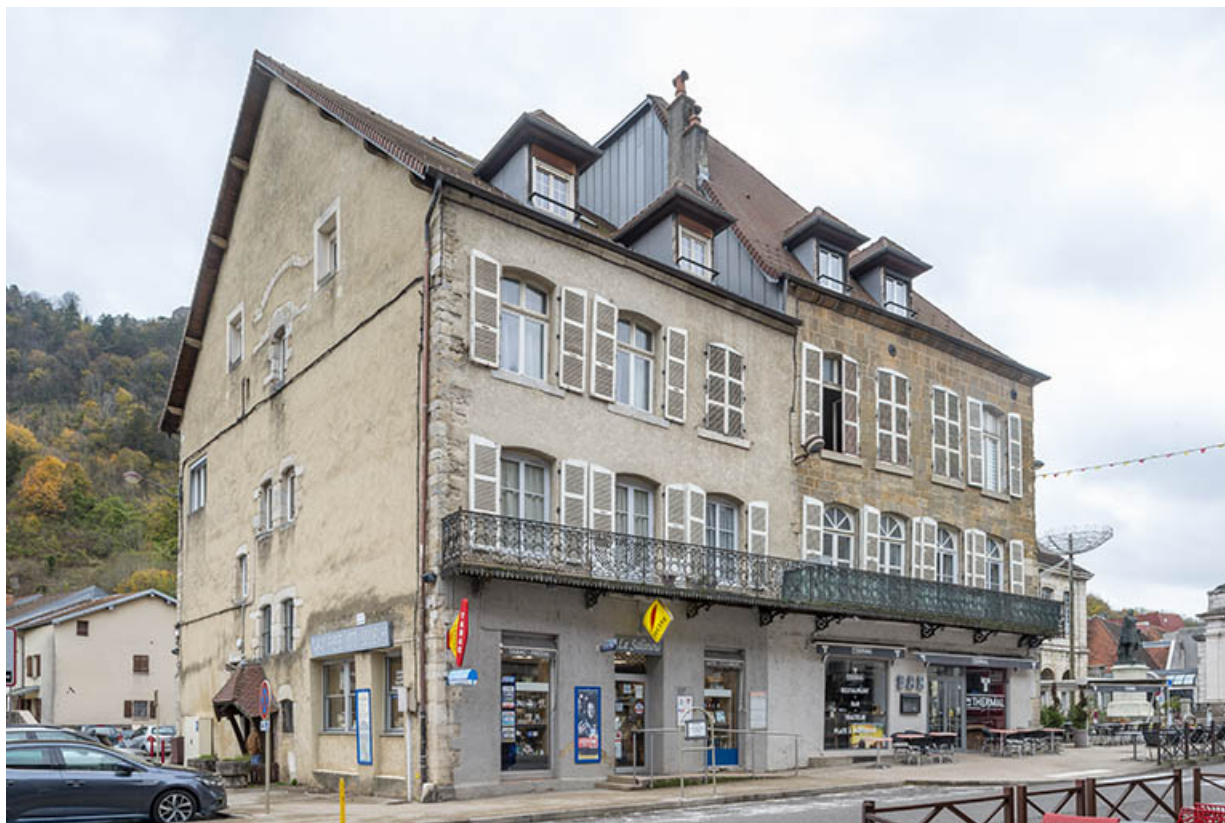
Vue de trois quarts, depuis le sud-est.

39, Salins-les-Bains, 2 rue de la République