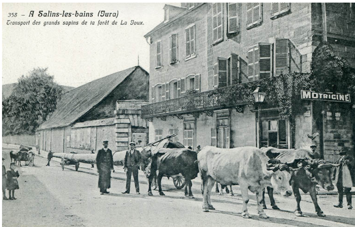
A Salins-les-Bains (Jura). Transport des grands sapins de la forêt de la Joux, s.d. [fin 19e ou début 20e siècle]. 39, Salins-les-Bains, 2 rue de la République