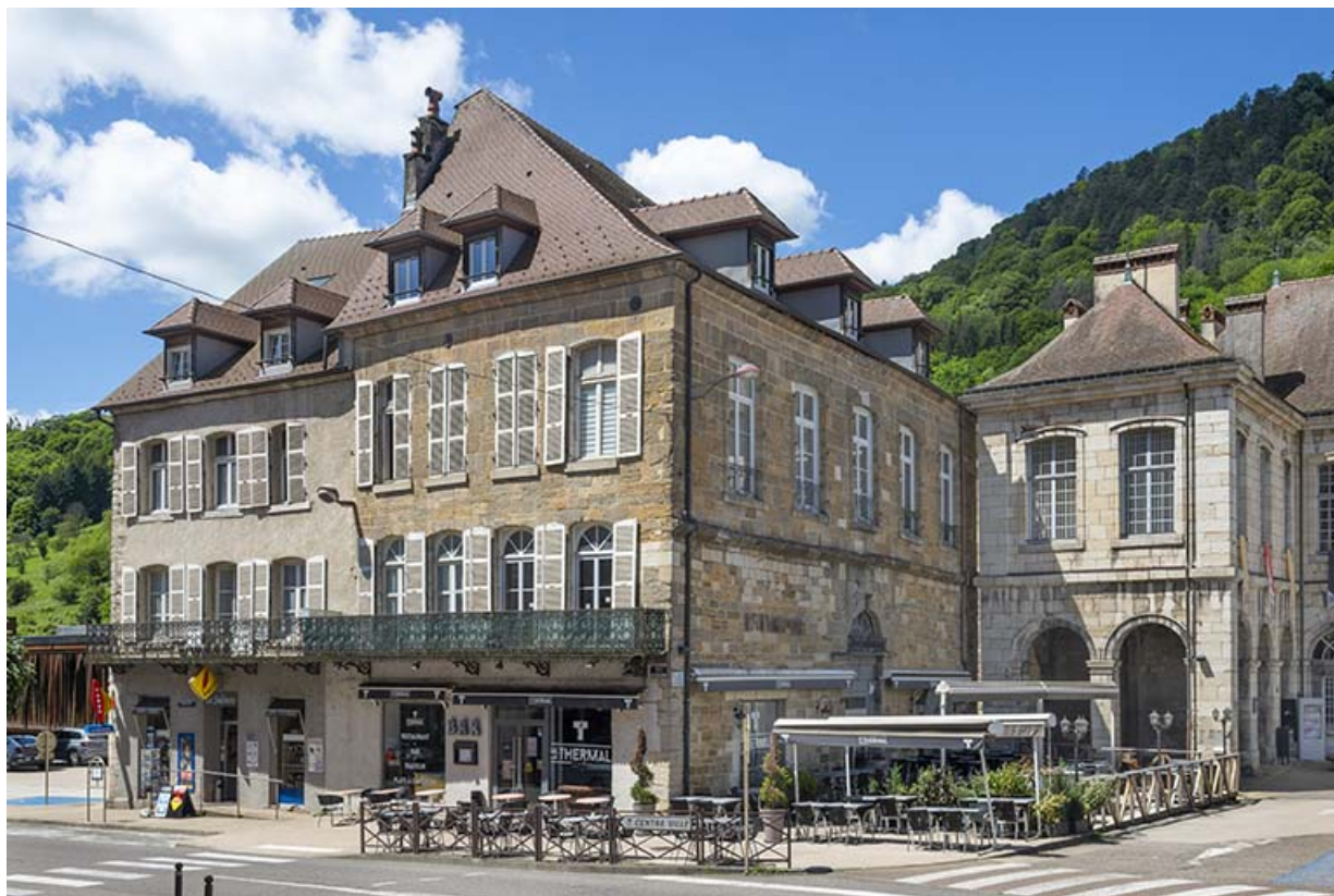
Vue de trois quarts depuis le nord-est.

39, Salins-les-Bains, 2 rue de la République