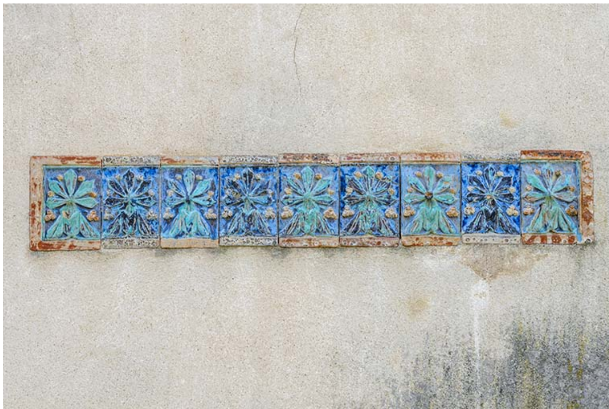
Frise de carreaux de grès flammé (façade nord, étage de soubassement).

39, Salins-les-Bains, 7, 9 rue des Bains