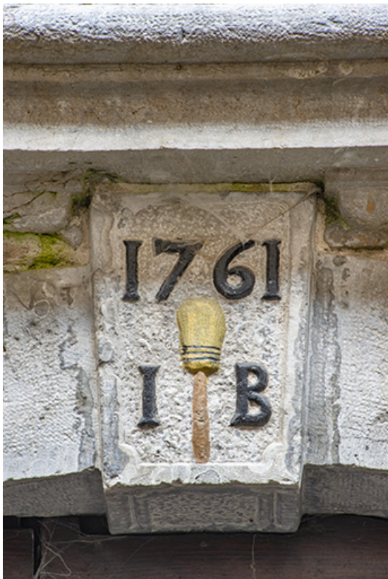
Détail du linteau de la porte d'entrée.

39, Salins-les-Bains, 8 rue Saint-Nicolas