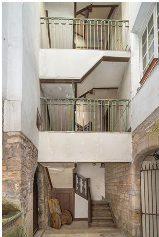
Cage d'escalier au sud de la cour.

39, Salins-les-Bains, 84 rue de la Liberté