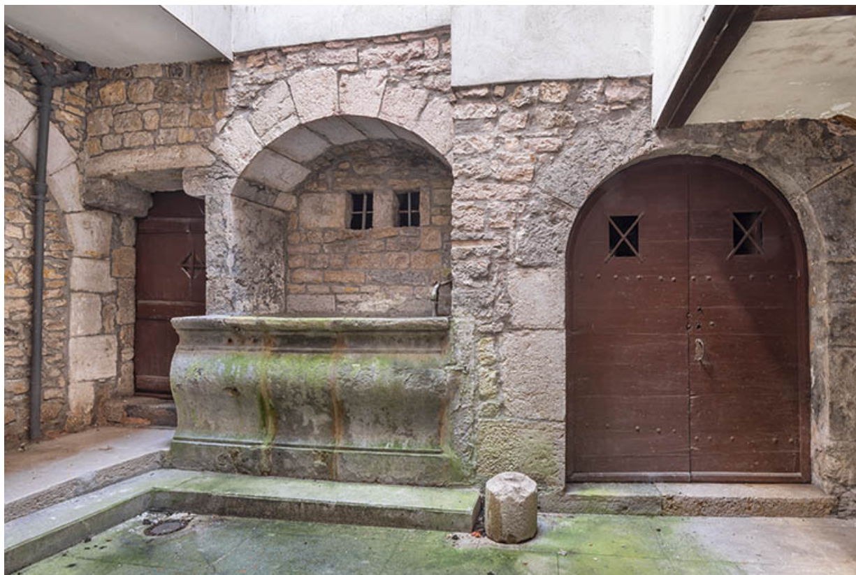
Entrées de caves et bassin de la fontaine au rez-de-chaussée.

39, Salins-les-Bains, 84 rue de la Liberté