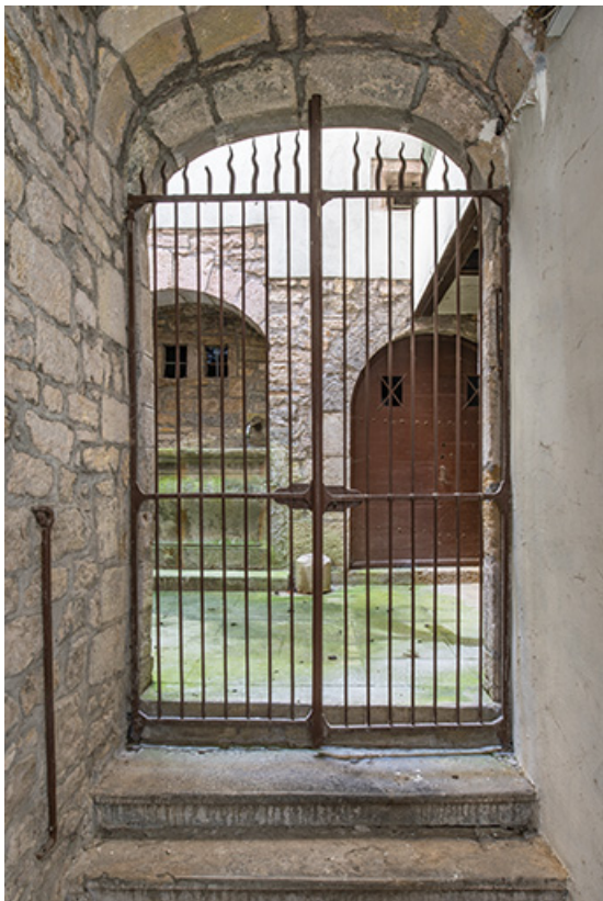
Grille située entre le couloir et la cour.

39, Salins-les-Bains, 84 rue de la Liberté