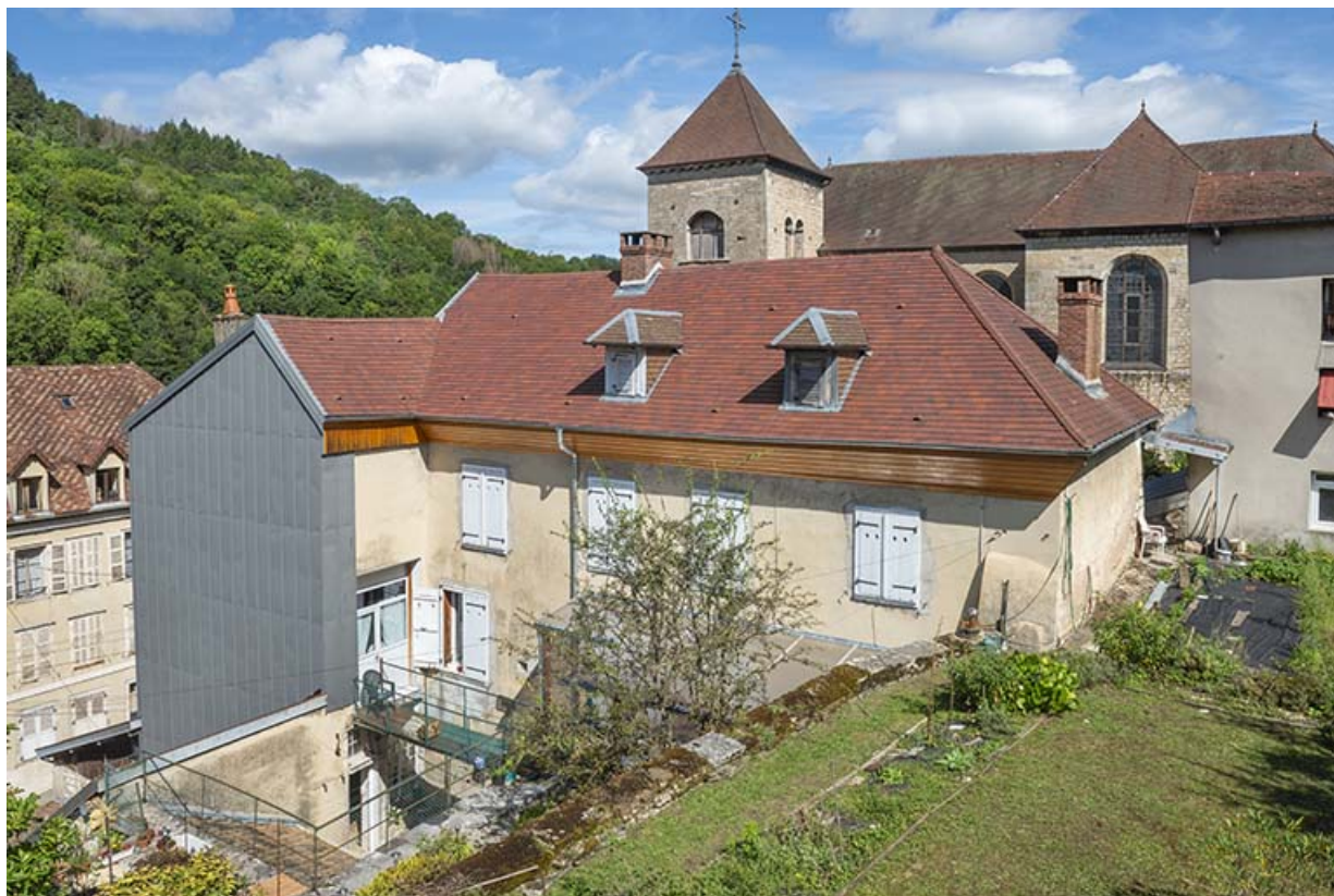
Vue de trois quarts depuis le jardin en terrasse, au sud-est.

39, Salins-les-Bains, 14 rue Charles Magnin