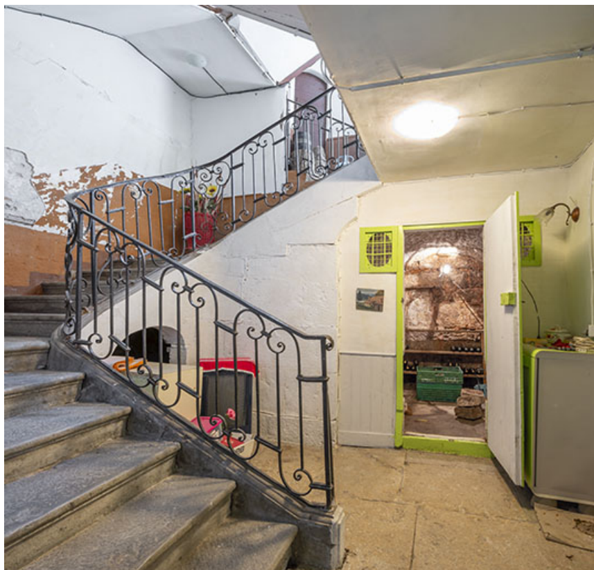
Cage d'escalier, depuis le rez-de-chaussée.

39, Salins-les-Bains, 14 rue Charles Magnin