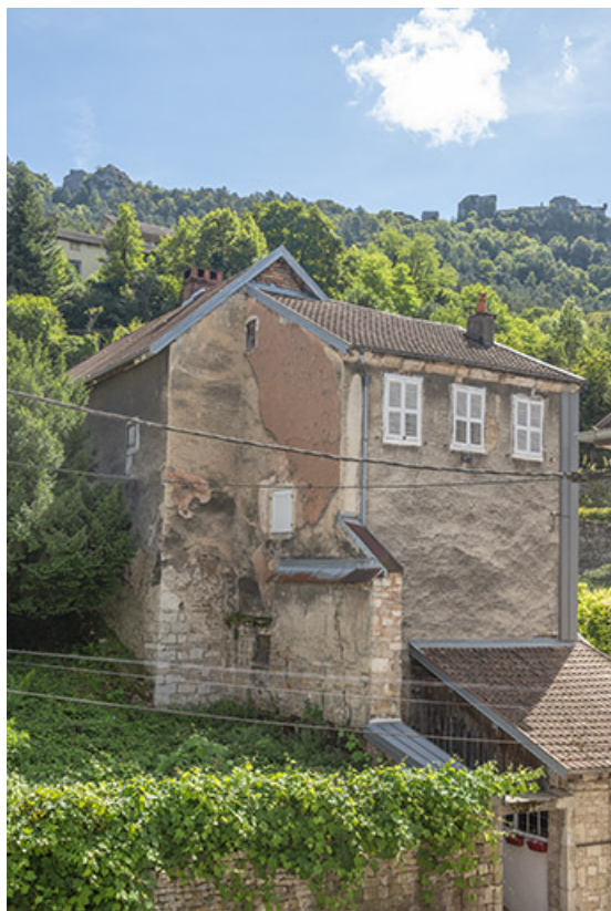
Vue d'ensemble depuis le nord-ouest.

39, Salins-les-Bains, 14 rue Charles Magnin