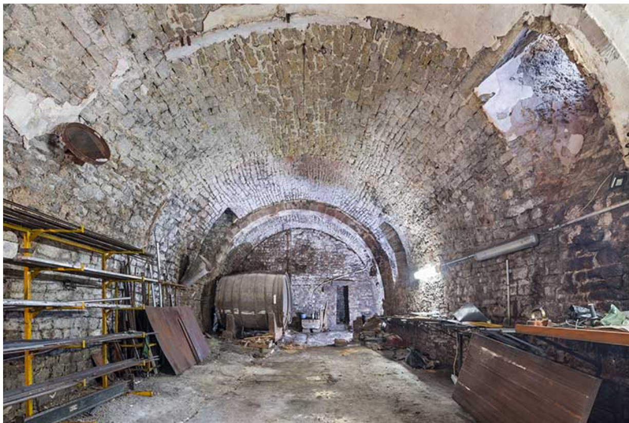
Cave en rez-de-chaussée. Vue depuis l'ouest.

39, Salins-les-Bains, 14 rue Charles Magnin