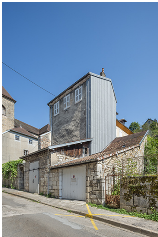
Vue d'ensemble depuis la rue Charles Magnin.

39, Salins-les-Bains, 14 rue Charles Magnin