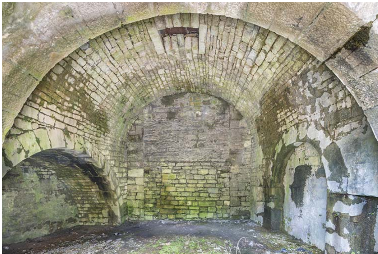
Pièce voûtée en berceau, située au nord de la tour est (vestiges du bâtiment construit en 1661 ?). 39, Salins-les-Bains rue Gambetta