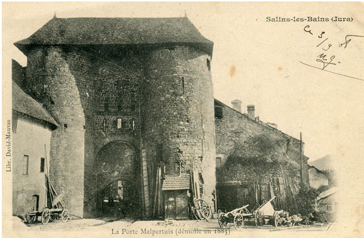
Salins-les-Bains (Jura). La porte Malpertuis (démolie en 1883), s.d. [avant 1883].