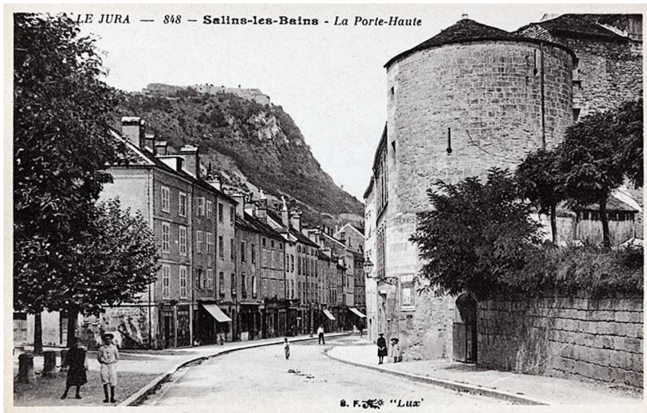
LE JURA 848 - Salins-les-Bains - La Porte-Haute. S.d.

39, Salins-les-Bains, 1 chemin des Tours bénites