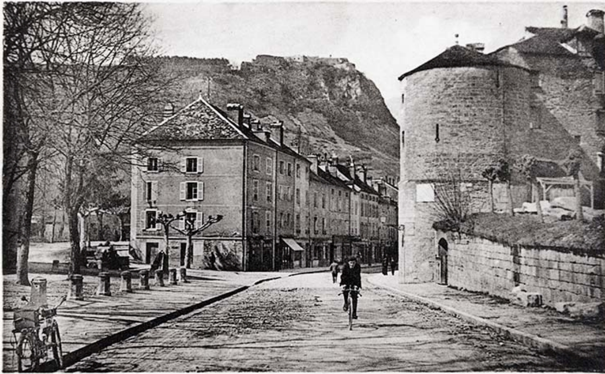
601 SALINS-les-BAINS (altit. 345 m) - Entrée de la ville du côté sud, porte Oudin David-Mauvas, éditeur

601 SALINS-les-BAINS (altit. 345) - Entrée de la ville du côté sud, porte Oudin. S.d.