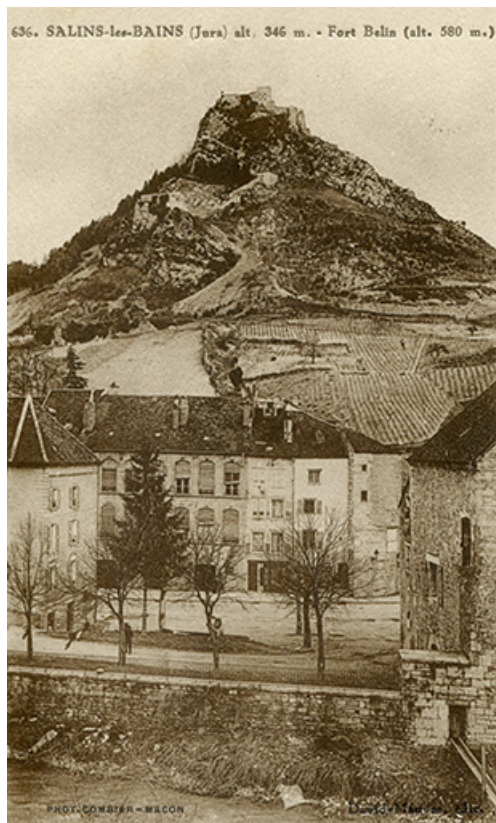
Salins-les-Bains (Jura) alt. 346 m. - Fort Belin (alt. 580 m), s.d. [fin 19e ou début 20e siècle].

39, Salins-les-Bains, 1 chemin des Tours bénites