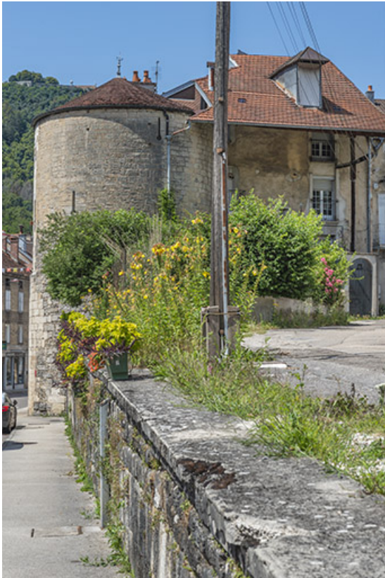
Tour et maison attenante à l'est.

39, Salins-les-Bains, 1 chemin des Tours bénites