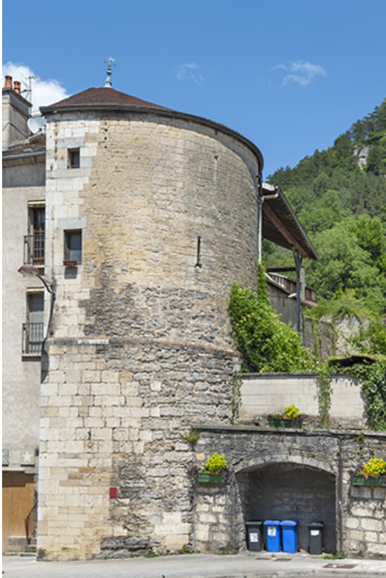
Vue rapprochée depuis l'ouest.

39, Salins-les-Bains, 1 chemin des Tours bénites