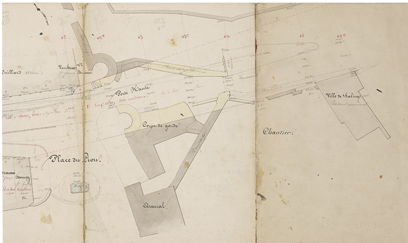
Traversée de la ville, 188. (?????????????)

39, Salins-les-Bains, 1 chemin des Tours bénites