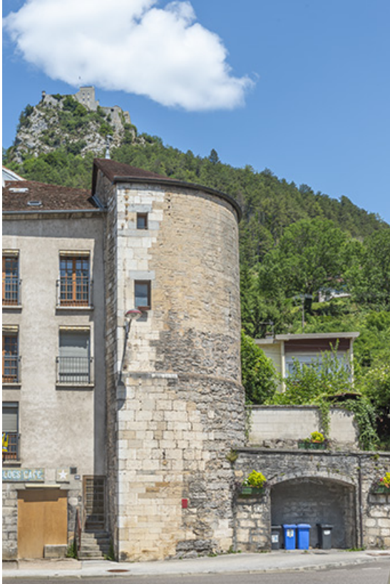
Fort Belin et tour Oudin.

39, Salins-les-Bains, 1 chemin des Tours bénites