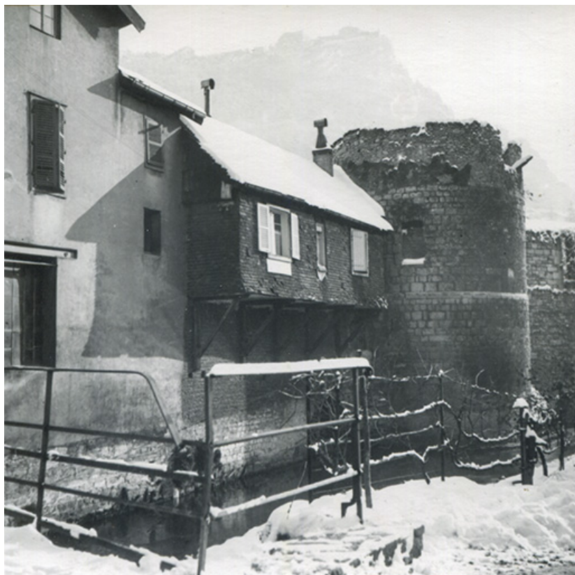
Vue depuis le pont de Saint-Nicolas, milieu 20e siècle.

39, Salins-les-Bains esplanade de la grande saline