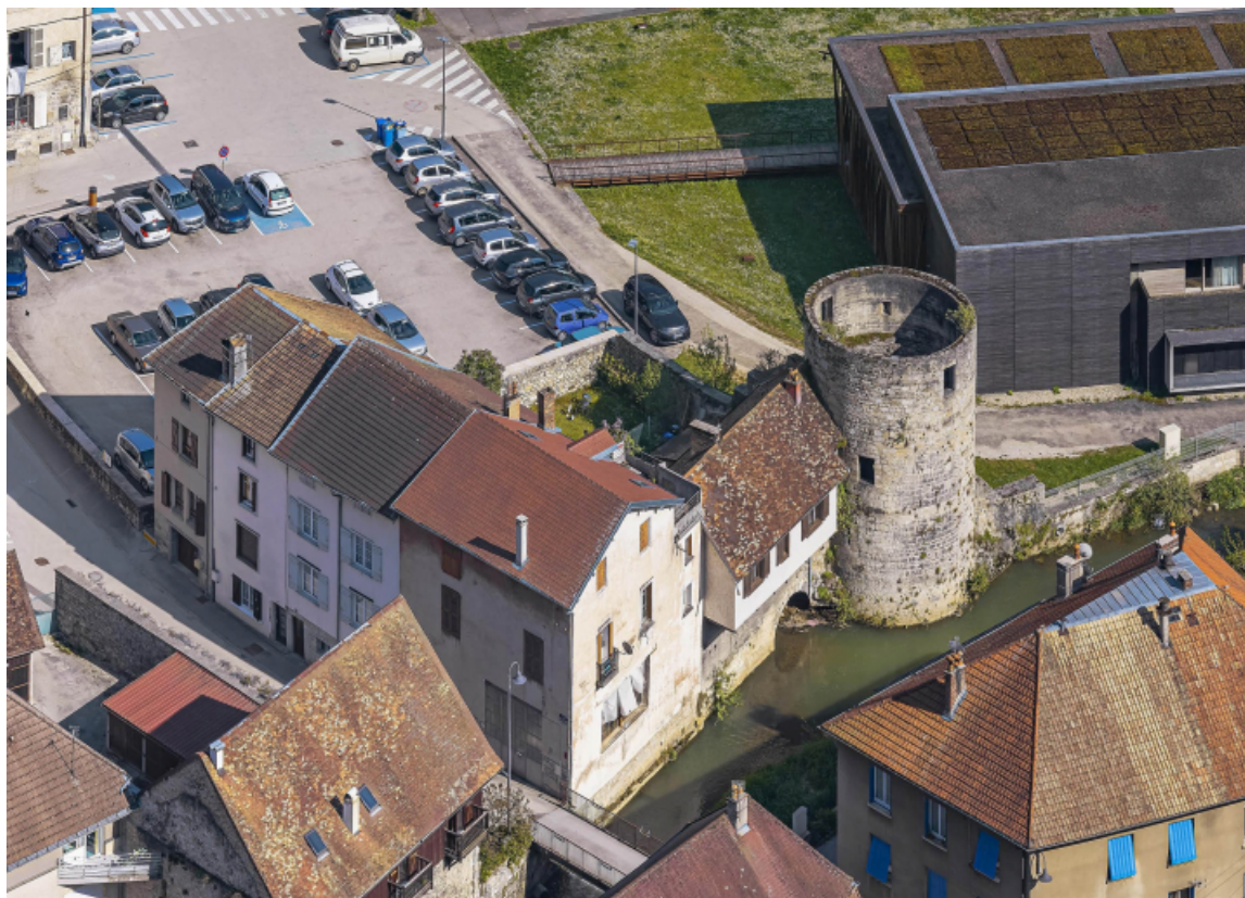
Bourg : la tour de Flore depuis le fort Saint-André. 39, Salins-les-Bains esplanade de la grande saline