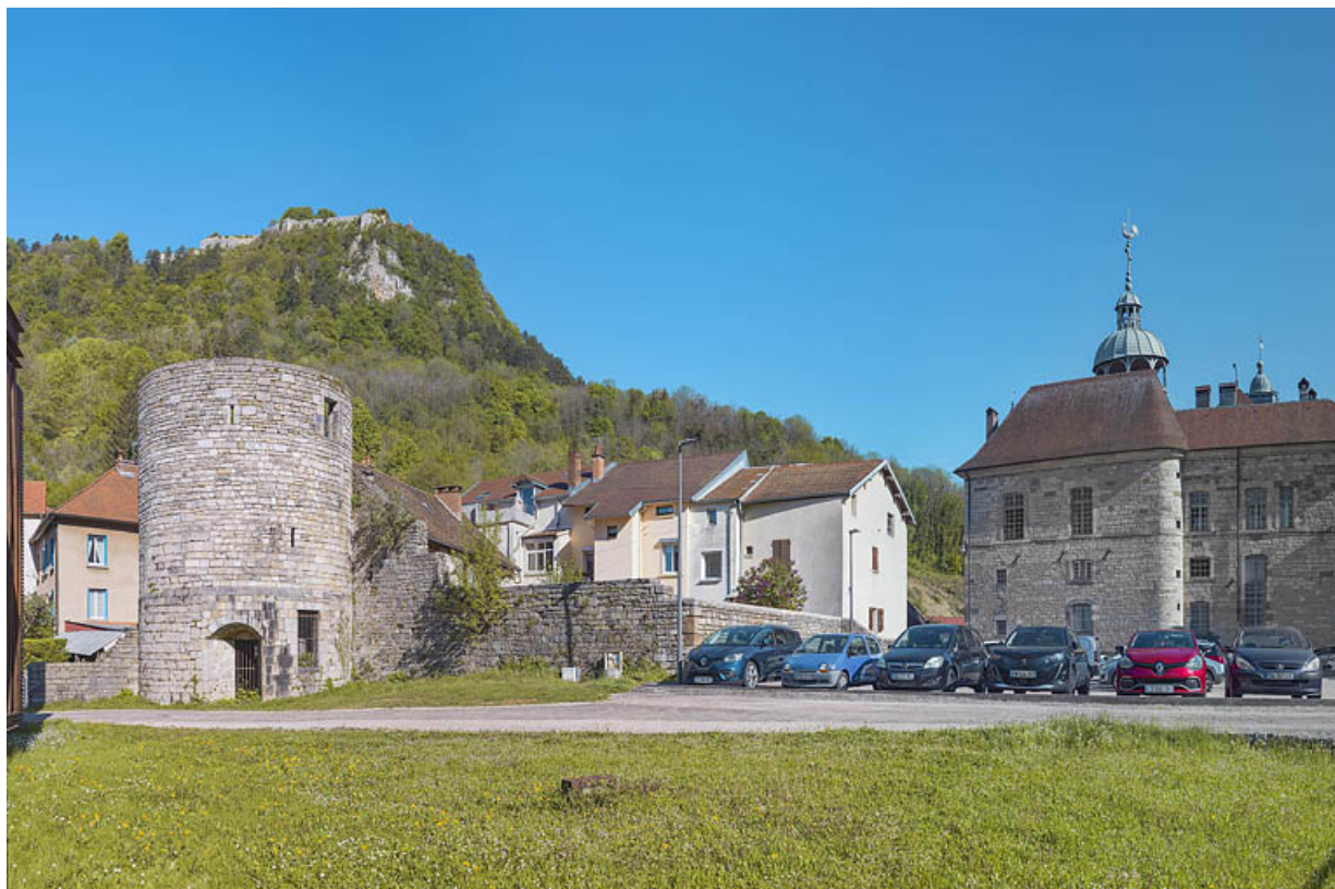
Vue depuis l'esplanade de la grande saline.