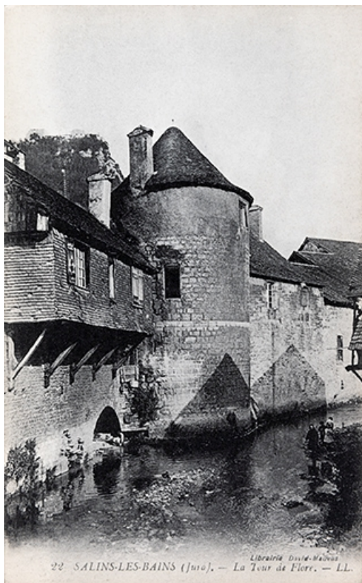
22. SALINS-LES-BAINS (Jura). La tour de Flore. S.d. 39, Salins-les-Bains esplanade de la grande saline