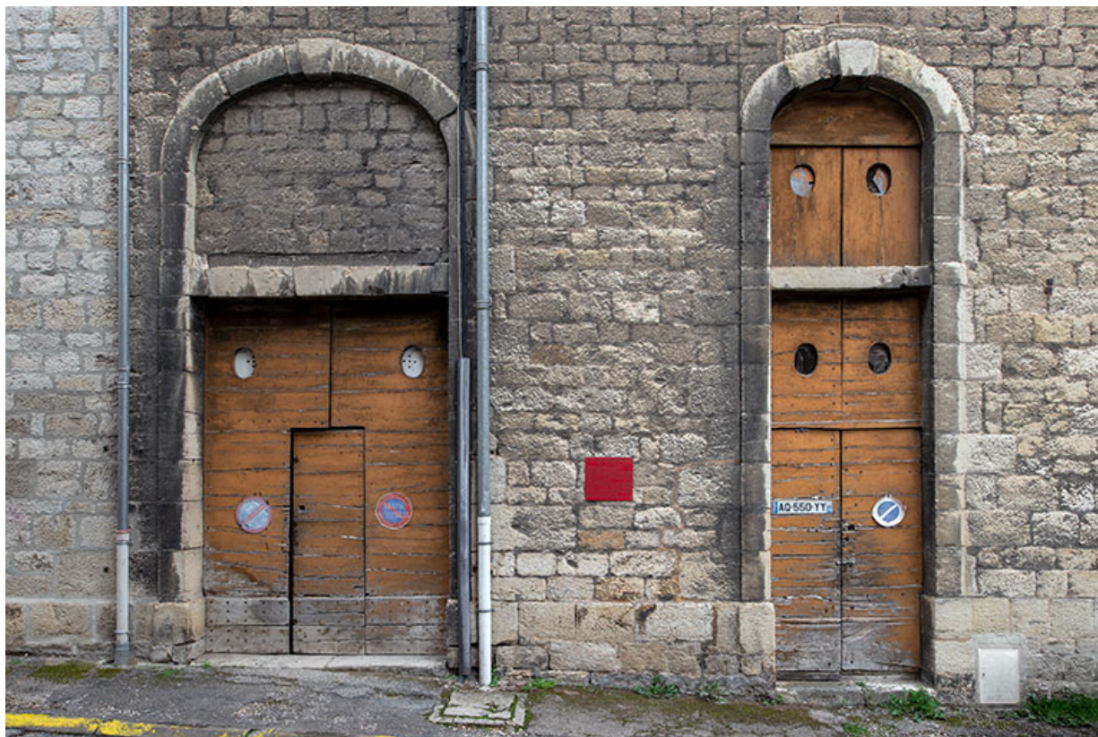
Façade sur rue. Portes des travées sud.

39, Salins-les-Bains, 13 rue de la Liberté