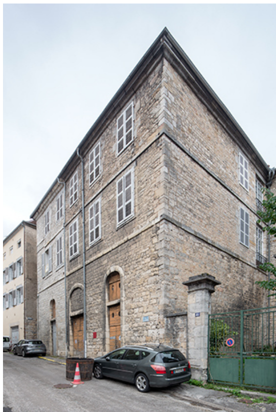
Bâtiment sur rue, vu depuis de trois quarts droite.

39, Salins-les-Bains, 13 rue de la Liberté