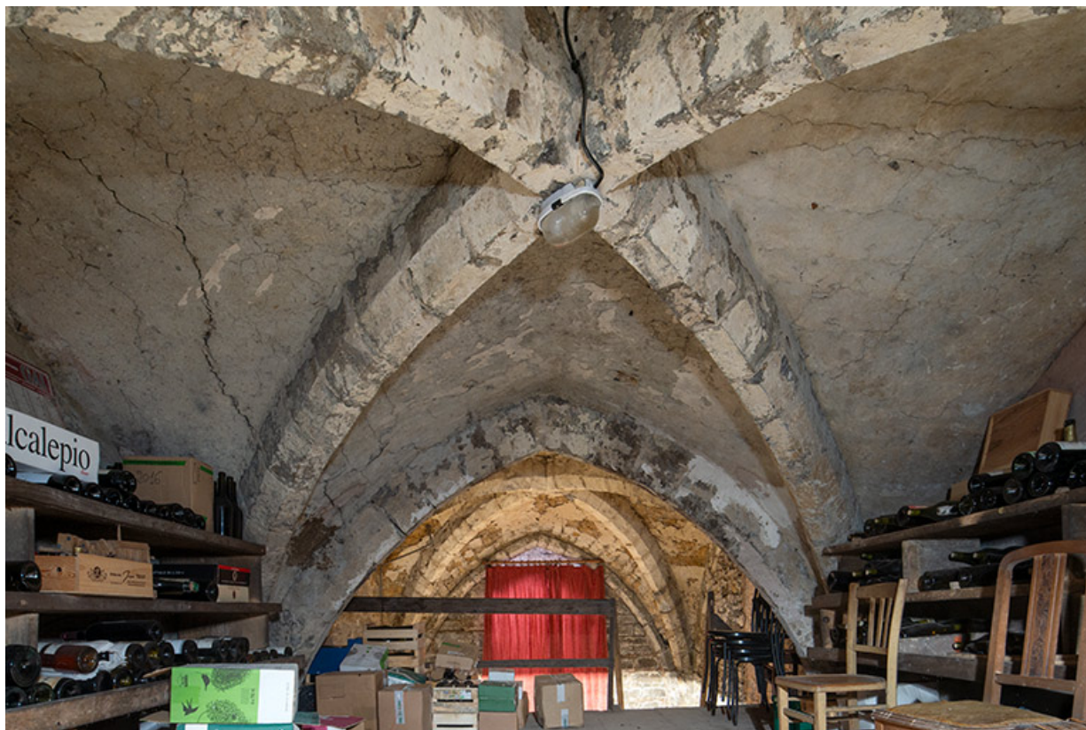
Cave du bâtiment sur rue. Croisée d'ogives ouest de la travée centrale. 39, Salins-les-Bains, 13 rue de la Liberté