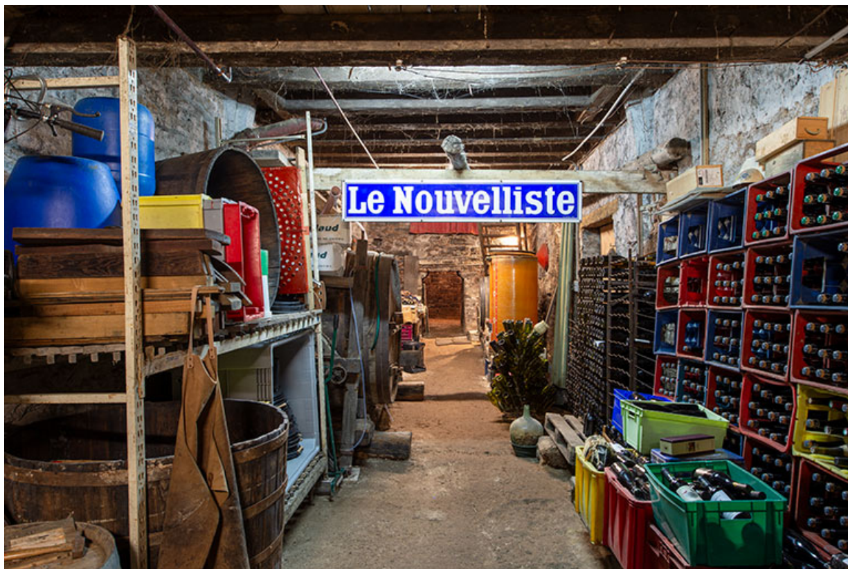
Cave du bâtiment sur rue. Travée centrale. 39, Salins-les-Bains, 13 rue de la Liberté