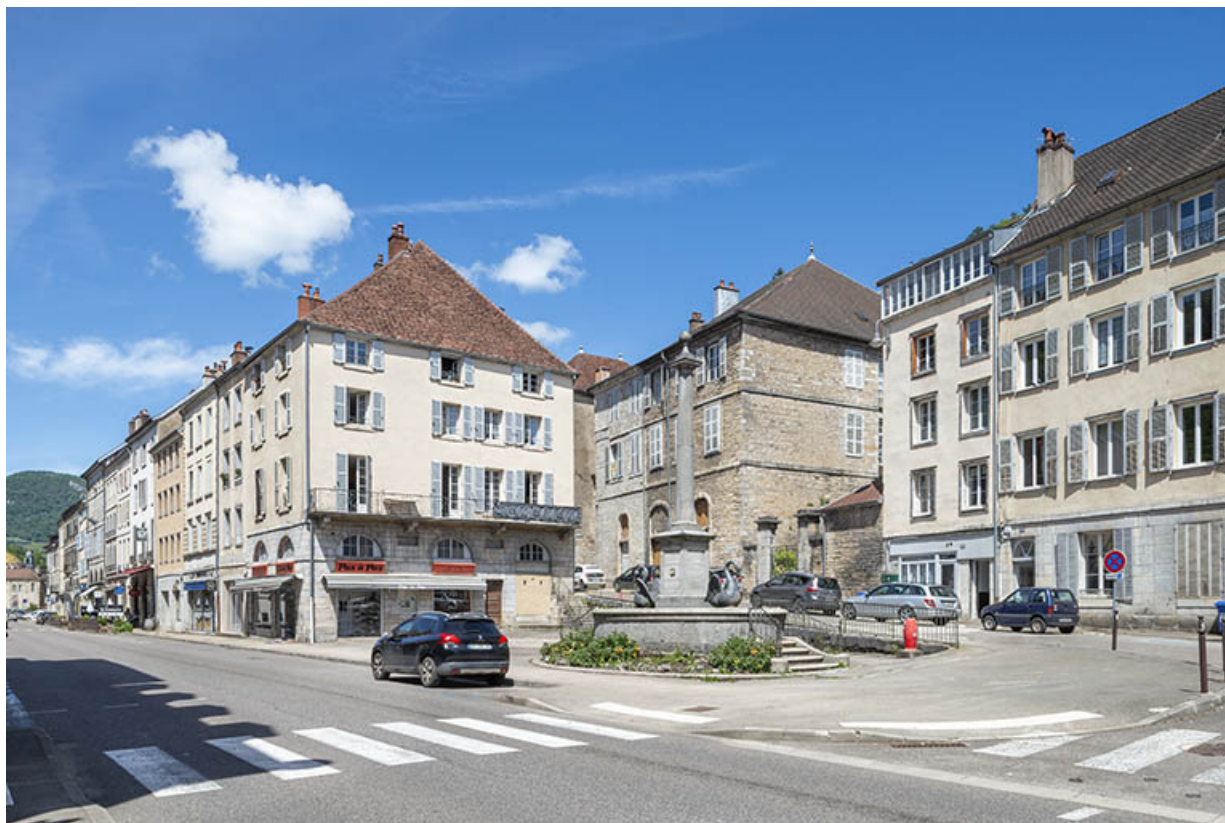
Vue d'ensemble depuis la rue de la République.

39, Salins-les-Bains, 13 rue de la Liberté