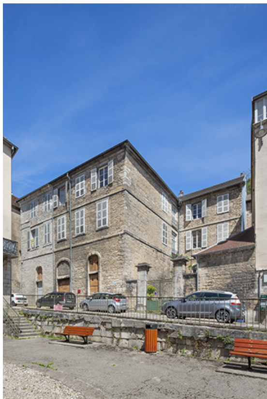
Vue d'ensemble depuis la place dite des Cygnes.

39, Salins-les-Bains, 13 rue de la Liberté