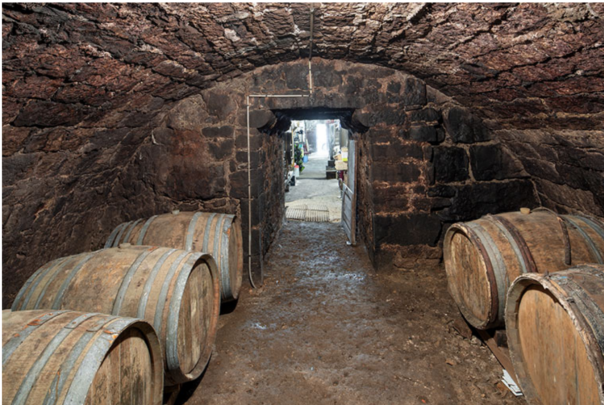
Cave du bâtiment sur rue. Pièce maçonnée à l'extrémité ouest de la travée centrale. 39, Salins-les-Bains, 13 rue de la Liberté