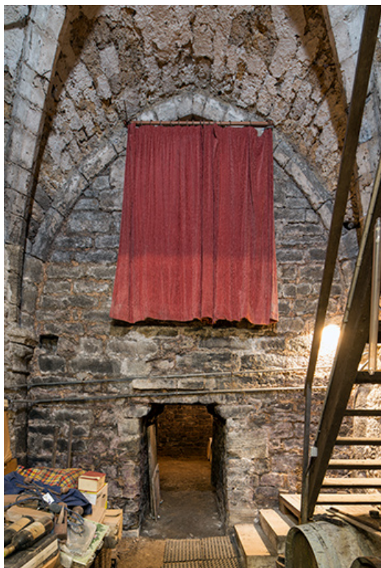
Cave du bâtiment sur rue. Mur ouest de la travée centrale.

39, Salins-les-Bains, 13 rue de la Liberté