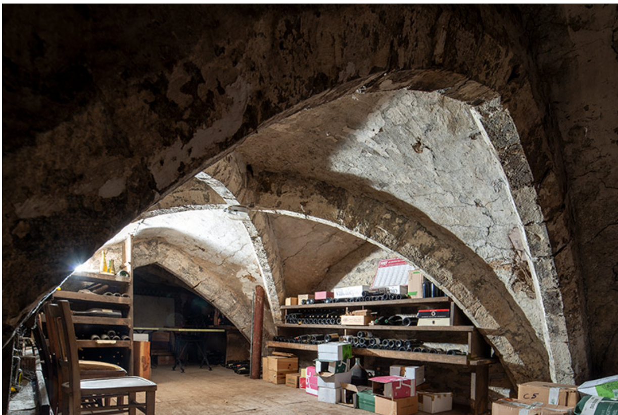
Cave du bâtiment sur rue. Croisée d'ogives (travée centrale).

39, Salins-les-Bains, 13 rue de la Liberté