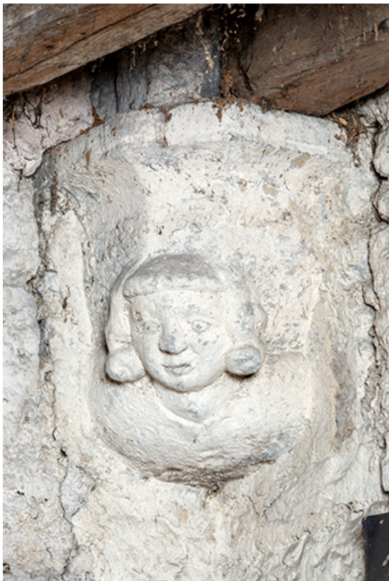
Cave du bâtiment sur rue. Culot figuré.

39, Salins-les-Bains, 13 rue de la Liberté