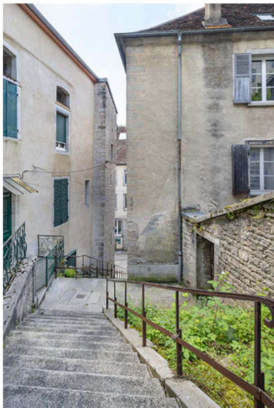
Façade nord (à gauche) depuis l'escalier des Sires de Poupet.

39, Salins-les-Bains, 13 rue de la Liberté