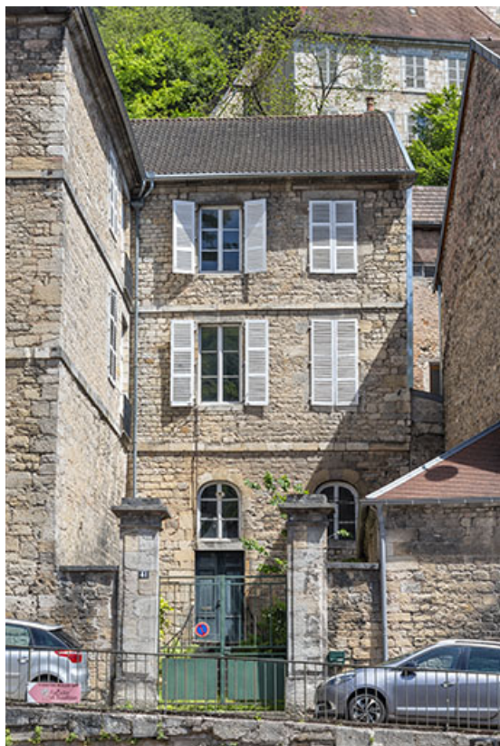
Façade ouest du bâtiment sur cour. 39, Salins-les-Bains, 13 rue de la Liberté