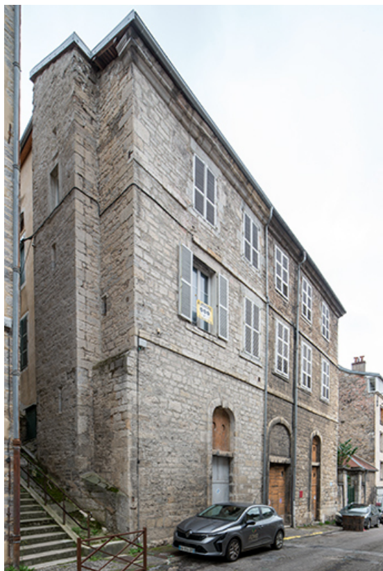
Bâtiment sur rue, vu depuis de trois quarts droite.

39, Salins-les-Bains, 13 rue de la Liberté