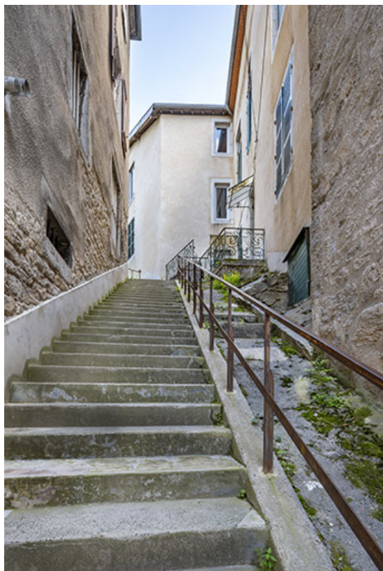
Façade nord (à droite), depuis l'escalier des Sires de Poupet.

39, Salins-les-Bains, 13 rue de la Liberté