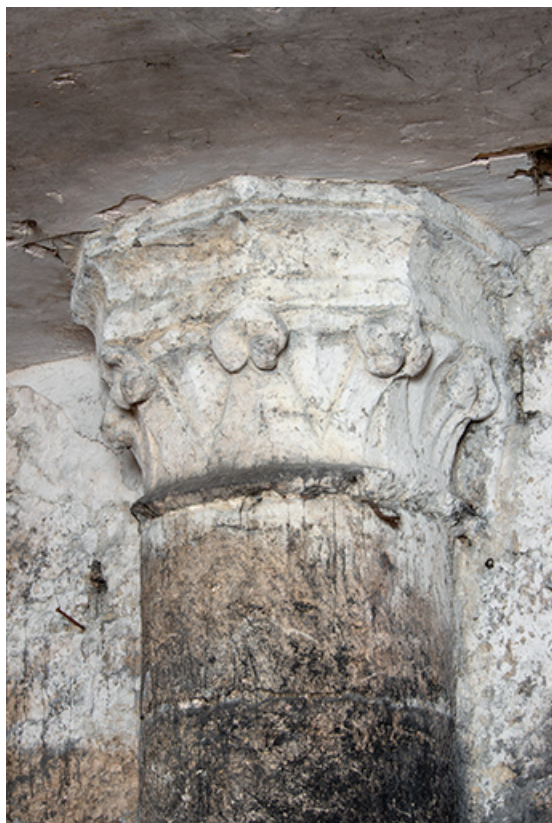
Cave du bâtiment sur rue. Chapiteau à crochets.

39, Salins-les-Bains, 13 rue de la Liberté