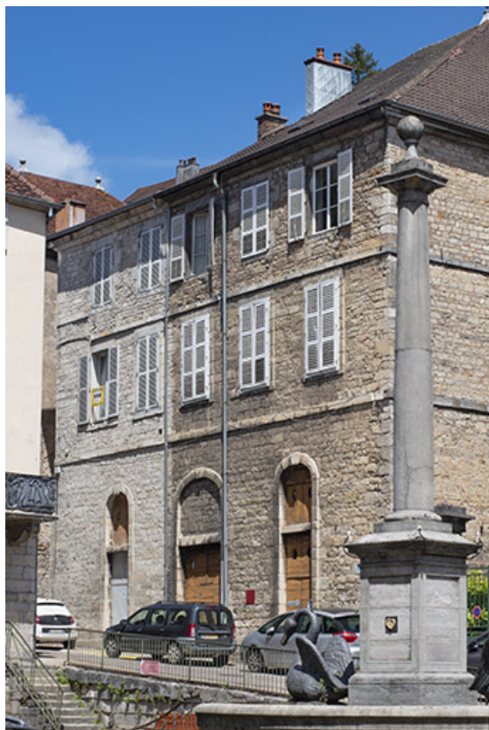
Bâtiment sur rue vu de trois quarts droite.

39, Salins-les-Bains, 13 rue de la Liberté