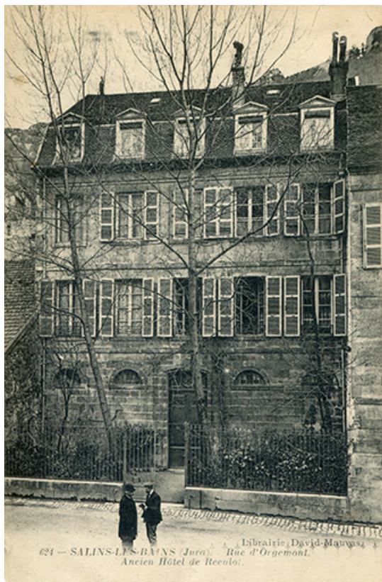
Salins-les-Bains (Jura) - Rue d'Orgemont - Ancien hôtel de Reculot, s.d. [fin 19e ou début 20e siècle].