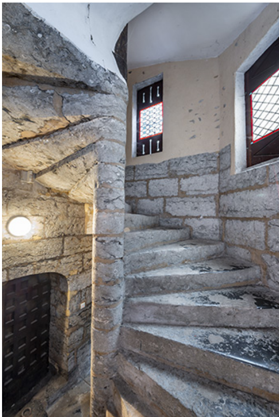
Escalier en vis : accès au premier étage.

39, Salins-les-Bains, 37 rue de la Liberté