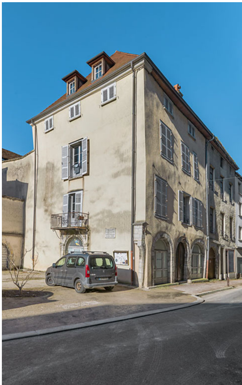
Immeuble sur rue vu de trois quarts gauche.

39, Salins-les-Bains, 37 rue de la Liberté