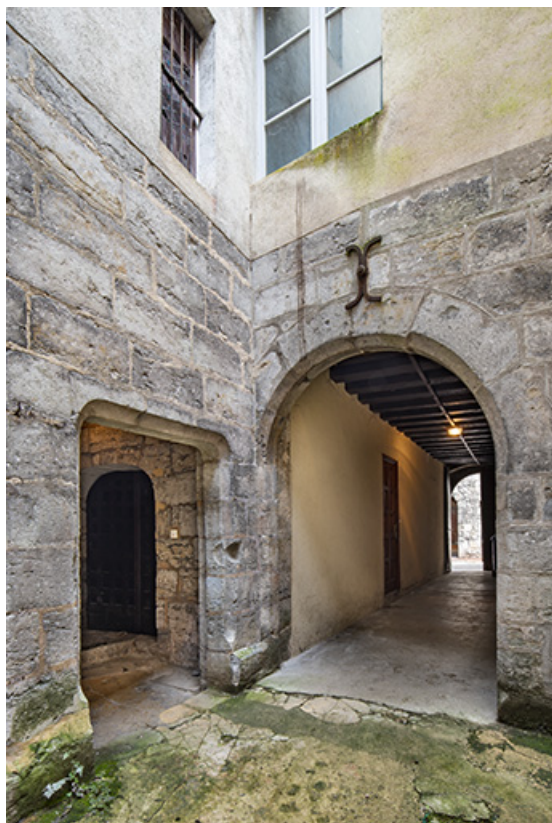
Vue de puis la cour : accès à la tour d'escalier et au couloir d'entrée.

39, Salins-les-Bains, 37 rue de la Liberté