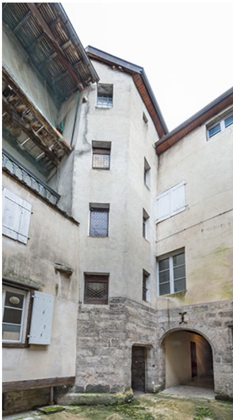
Tour d'escalier polygonale, depuis la cour.

39, Salins-les-Bains, 37 rue de la Liberté