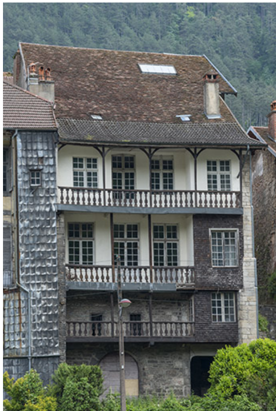
Elévation de la façade ouest.

39, Salins-les-Bains, 37 rue de la Liberté