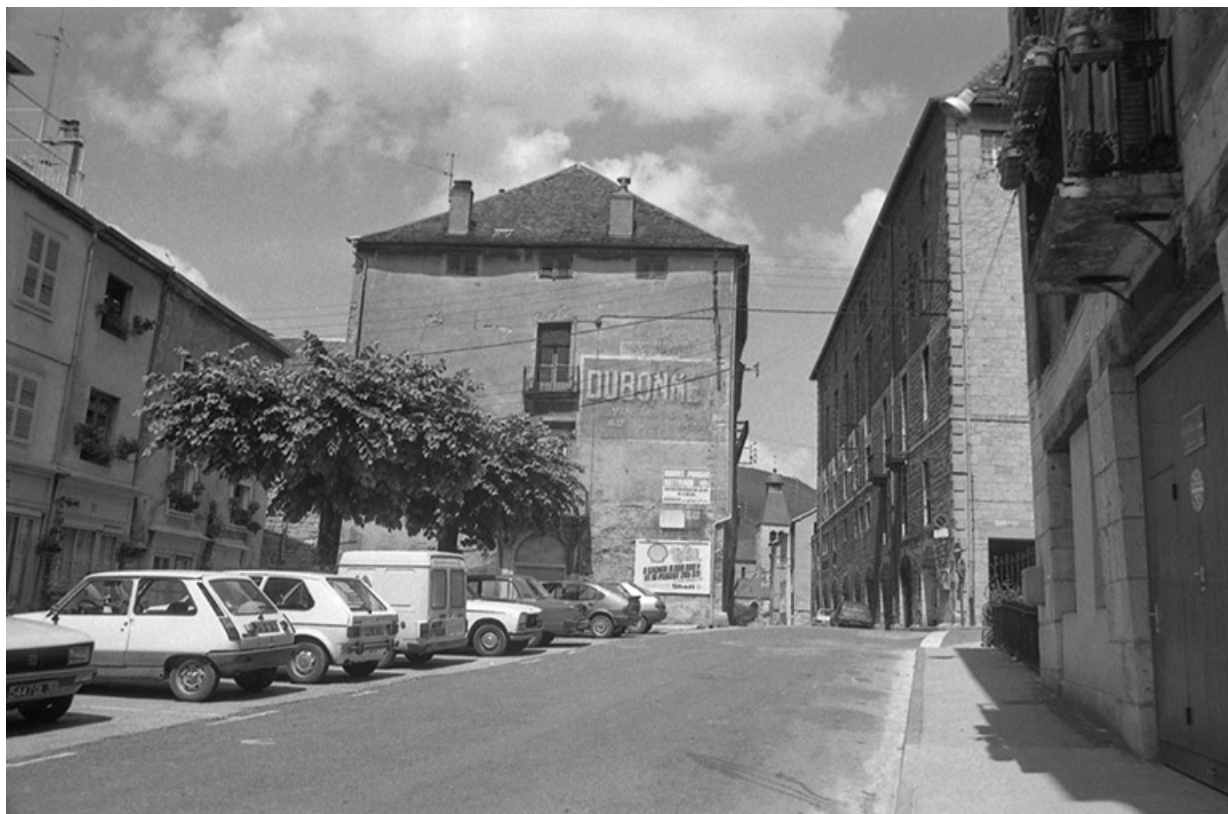
Mur pignon de l'immeuble n°27 rue de la Liberté, depuis le sud.

39, Salins-les-Bains, 37 rue de la Liberté