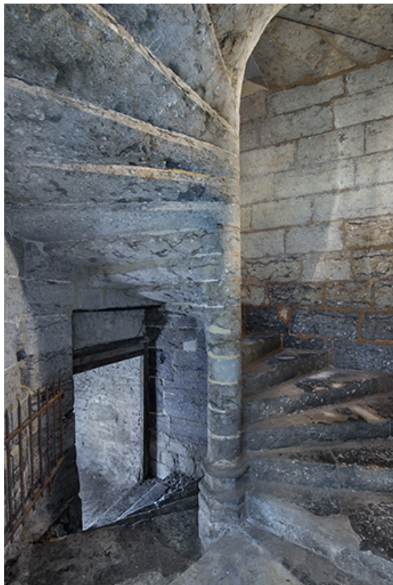
Escalier en vis : départ de la cave.

39, Salins-les-Bains, 37 rue de la Liberté