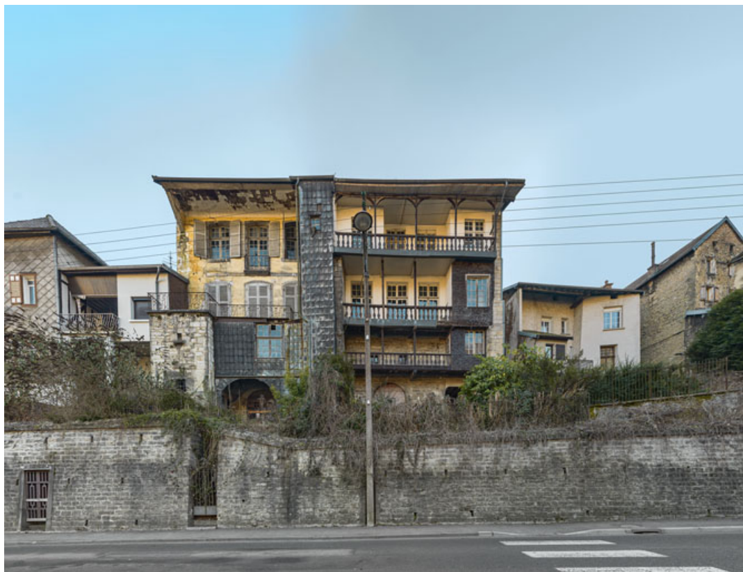
Vue d'ensemble en contre-plongée (façade de droite).

39, Salins-les-Bains, 37 rue de la Liberté