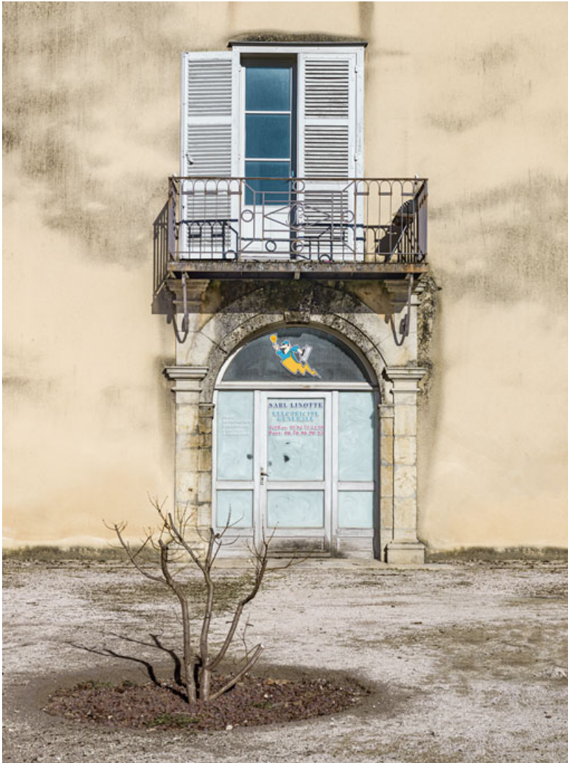
Façade sud de l'immeuble sur rue. Baies réimplantées suite à la démolition des immeubles 27 à 31 rue de la Liberté. 39, Salins-les-Bains, 37 rue de la Liberté