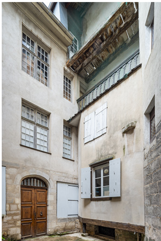
Ailes ouest et nord depuis la cour.

39, Salins-les-Bains, 37 rue de la Liberté