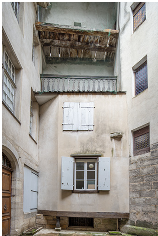
Extension nord, contre la cage d'escalier en vis.

39, Salins-les-Bains, 37 rue de la Liberté