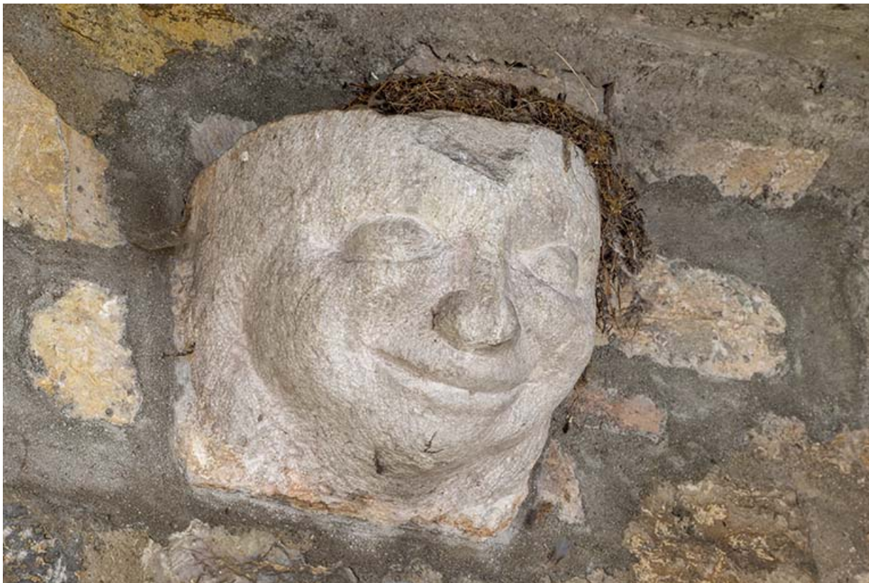
Console figurée (droite) dans le mur sud de la cour.

39, Salins-les-Bains, 37 rue de la Liberté