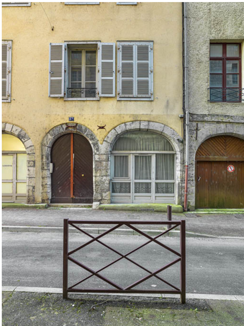
Façade antérieure du bâtiment sur rue. Partie nord.

39, Salins-les-Bains, 37 rue de la Liberté