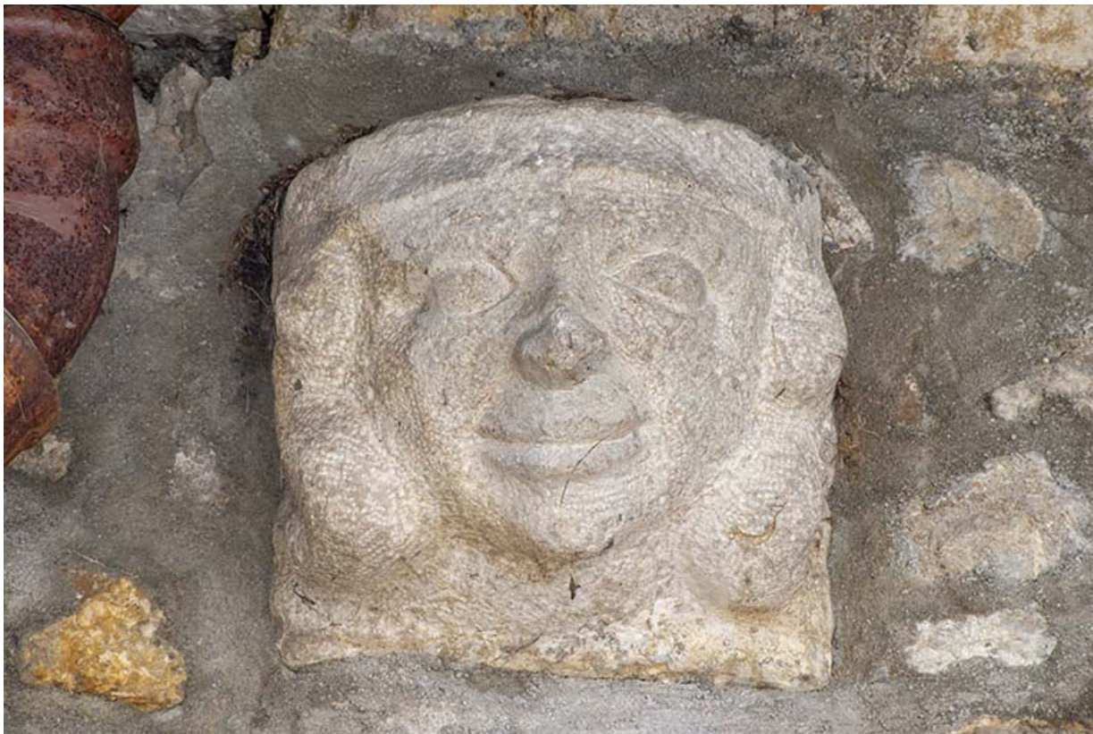
Console figurée (gauche) dans le mur sud de la cour.

39, Salins-les-Bains, 37 rue de la Liberté