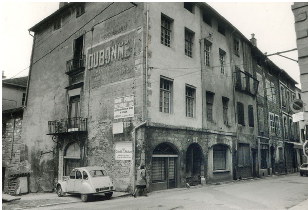
Immeubles démolis dans les années 1980 (n° 27 à 35), phot. Jean-Marie Maronnier, vers 1970.

39, Salins-les-Bains, 37 rue de la Liberté