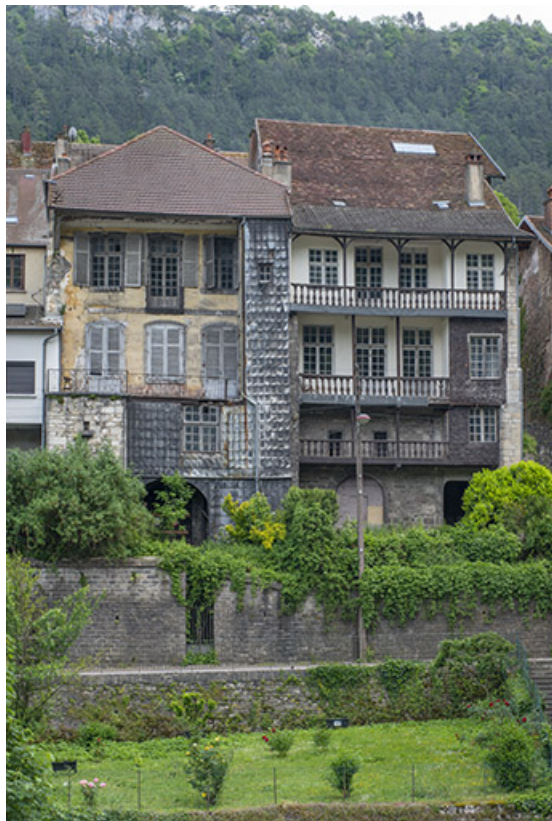
Vue d'ensemble depuis l'ouest (façade de droite).

39, Salins-les-Bains, 37 rue de la Liberté