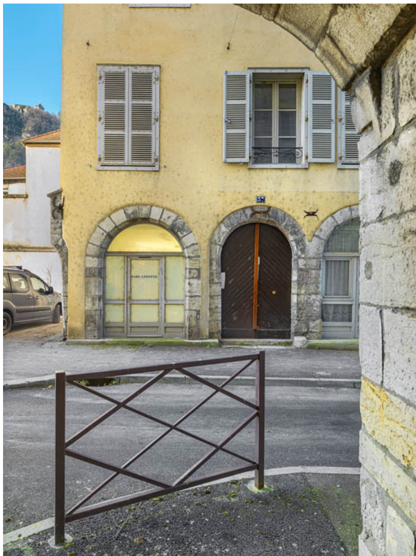
Façade antérieure du bâtiment sur rue. Partie sud.

39, Salins-les-Bains, 37 rue de la Liberté