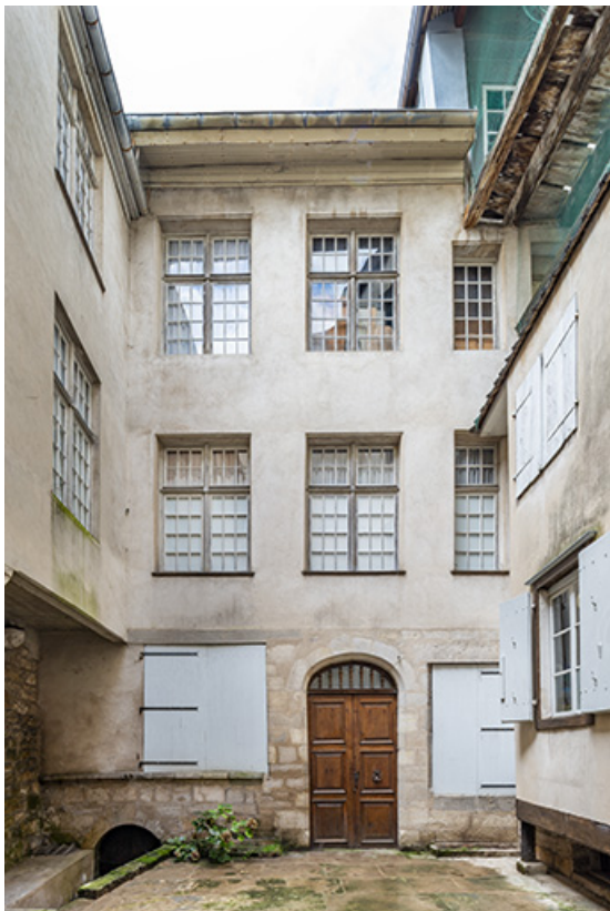
Façade est du logis sur cour.

39, Salins-les-Bains, 37 rue de la Liberté