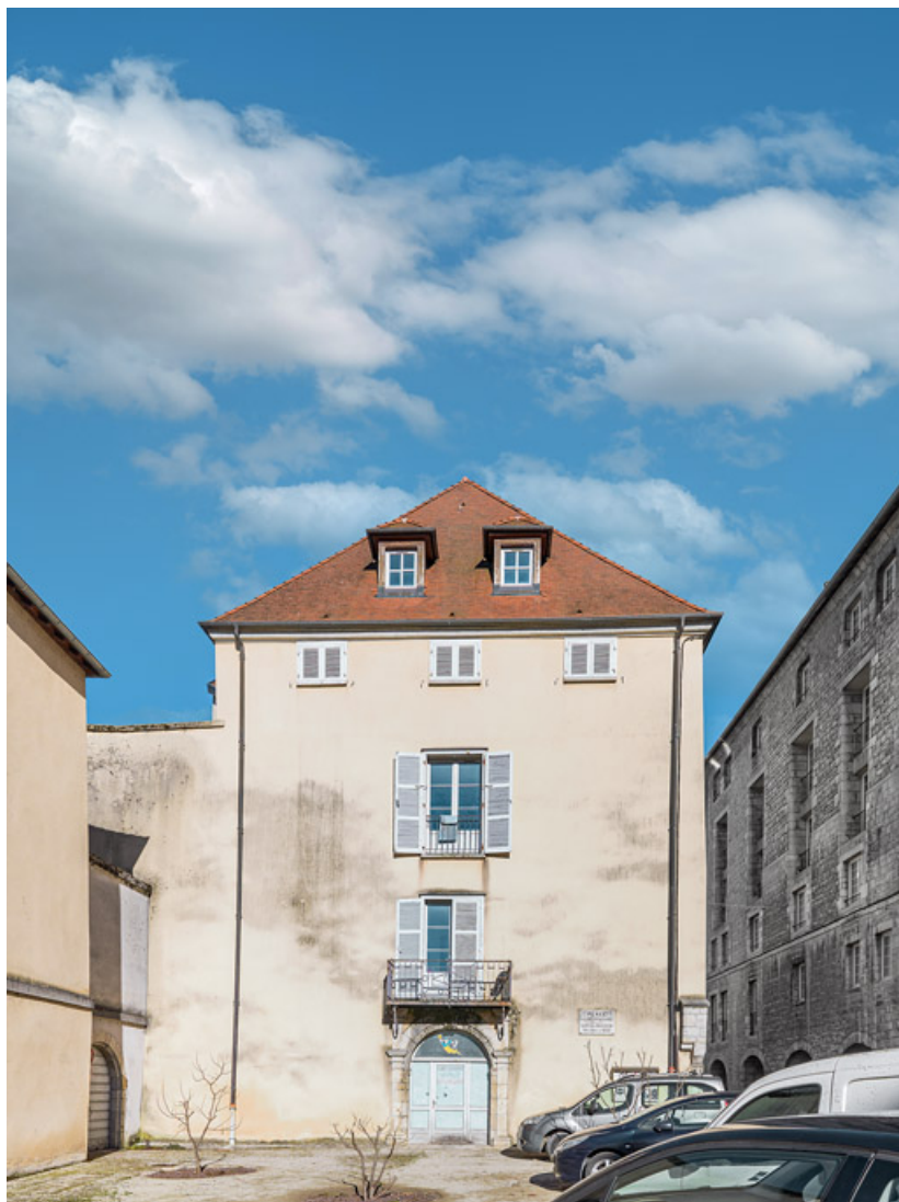
Immeuble sur rue. Façade sud donnant sur la place de la Reconnaissance. 39, Salins-les-Bains, 37 rue de la Liberté