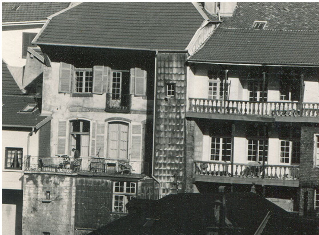
Façade ouest d'hôtels particuliers rue Gambetta (l'hôtel Marandet est à droite), phot. Georges Chenu, s.d. [milieu 20e siècle]. 39, Salins-les-Bains, 37 rue de la Liberté

Façade ouest d'hôtels particuliers rue Gambetta (l'hôtel Marandet est à droite), phot. Georges Chenu, s.d. [milieu 20e siècle]. Collection particulière.