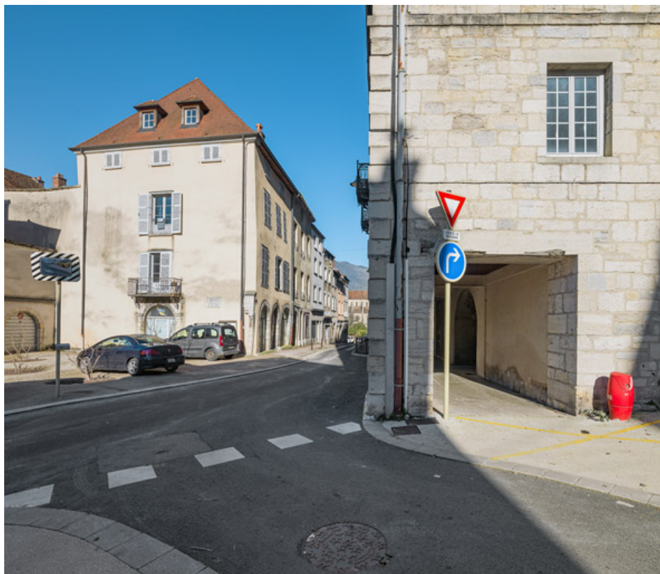
Immeuble sur rue. Vue d'ensemble depuis le bas de la rue Charles Magnien.

39, Salins-les-Bains, 37 rue de la Liberté