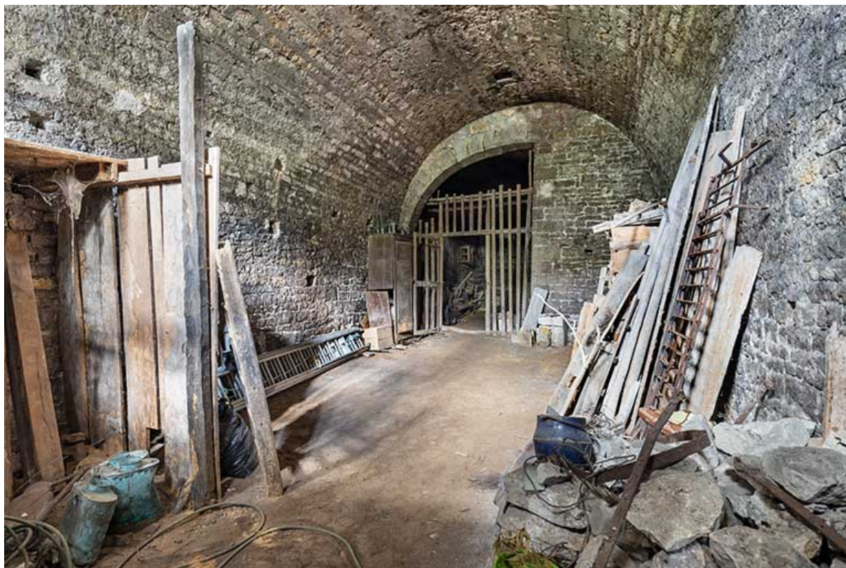
Cave : vue de trois quarts.

39, Salins-les-Bains, 37 rue de la Liberté