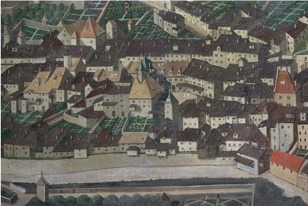
Détail du Bourg-Dessous : le baillage apparaît sous le n°68, à l'extrême droite (1628).