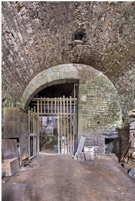
Cave : vue axiale.

39, Salins-les-Bains, 37 rue de la Liberté