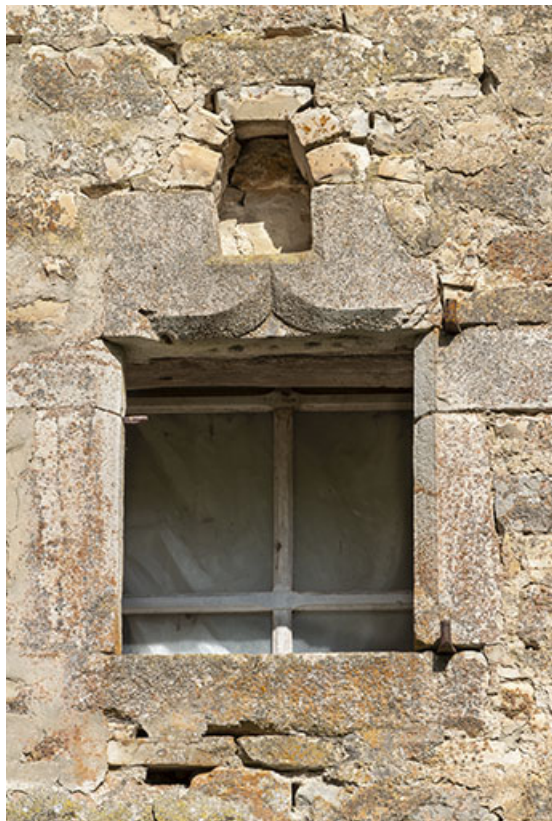
Pignon est. Détail d'un linteau sculpté de l'étable (emploi ?).