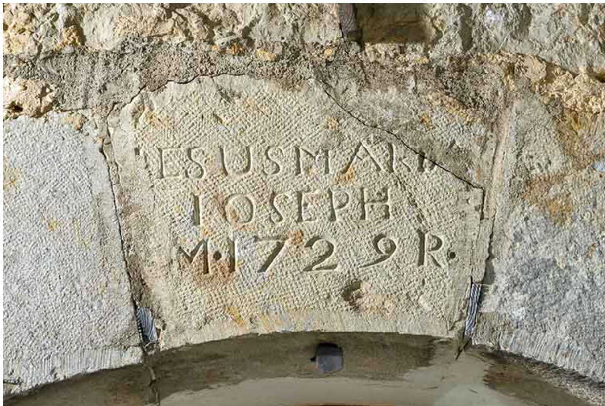
Détail d'une clef d'arcade de la porte du logement.(façade est).