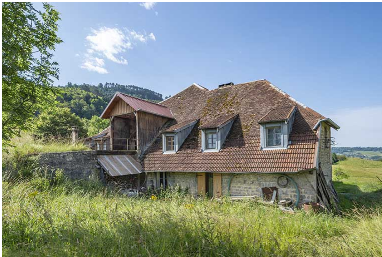
Vue depuis le nord.

39, Salins-les-Bains, lieudit : Toutvent