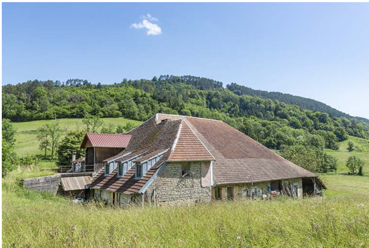
Vue d'ensemble depuis le nord-ouest.