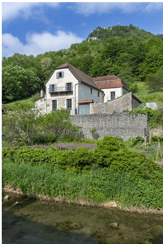
Vue d'ensemble depuis le nord-est.

39, Salins-les-Bains, lieudit : le Paradis