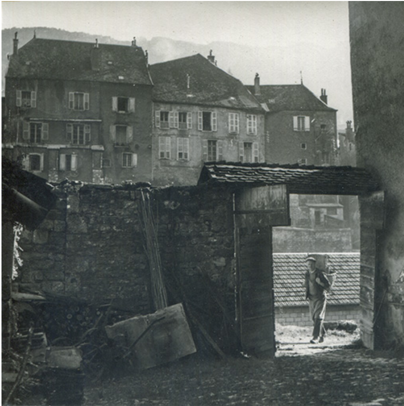
M. Rolier en tenue de vendangeur, depuis la cour de la maison, fotogr. Georges Chenu, s.d. [milieu 20e siècle]. 39, Salins-les-Bains, lieudit : le Paradis

M. Rolier en tenue de vendangeur, depuis la cour de la maison, fotogr. Georges Chenu, s.d. [milieu 20e siècle]. Collection particulière : Georges Chenu. Lieu de conservation : Collection particulière : Georges Chenu