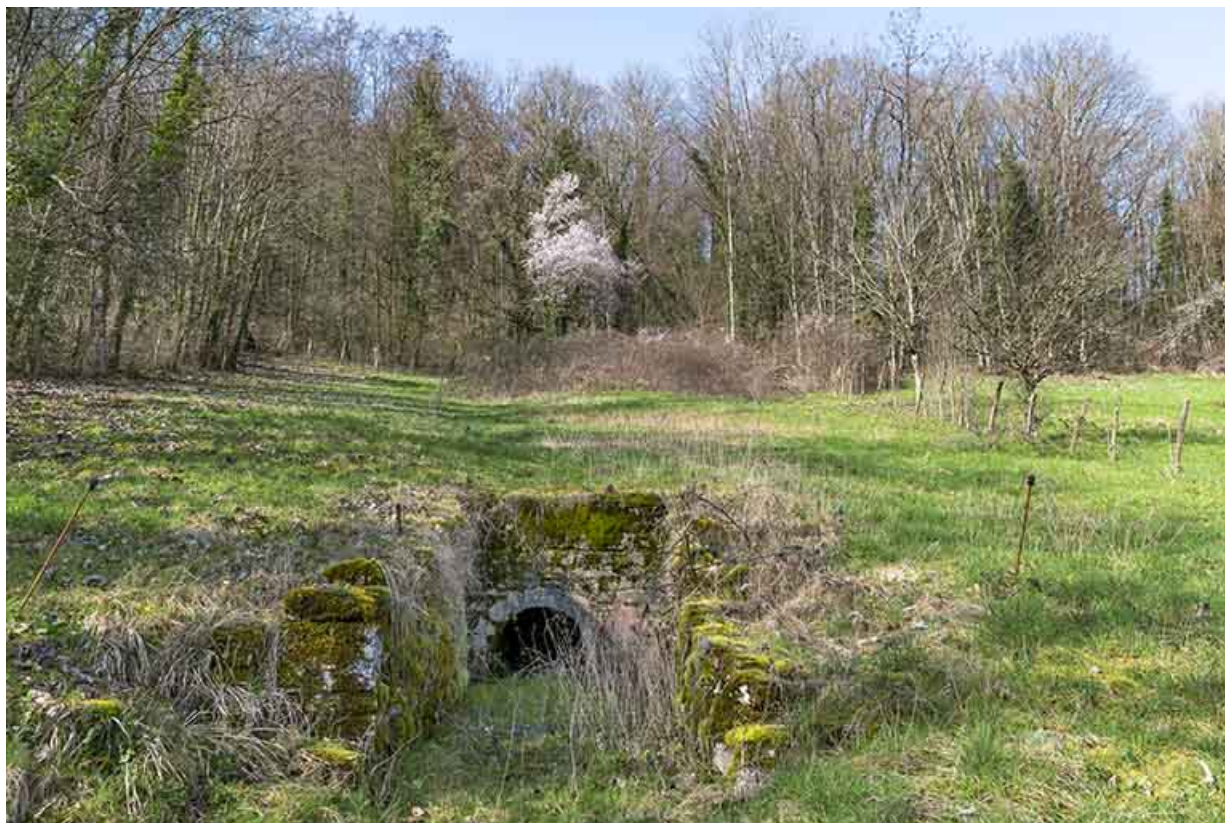
Source du Paradis, au sud de la maison.

39, Salins-les-Bains, lieudit : le Paradis