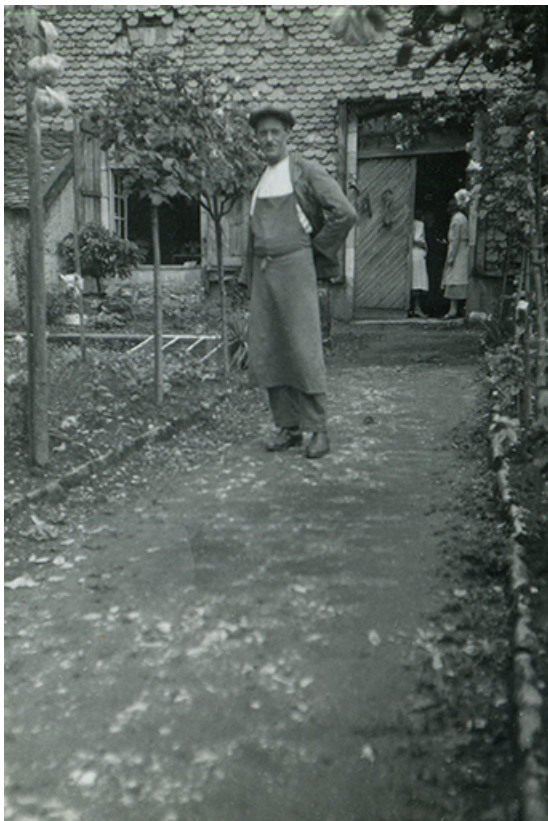
Homme en tenue de vendangeur devant la maison, fotogr., s.n., s.d. [première moitié 20e siècle]. 39, Salins-les-Bains, lieudit : le Paradis