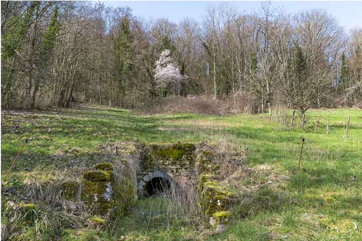
Source du Paradis, au sud de la maison.

39, Salins-les-Bains, lieudit : le Paradis