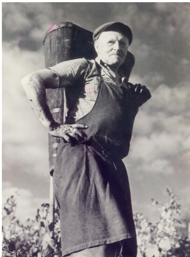
Portrait de M. Rolier, fotogr., s.d. [milieu 20e siècle]. 39, Salins-les-Bains, lieudit : le Paradis