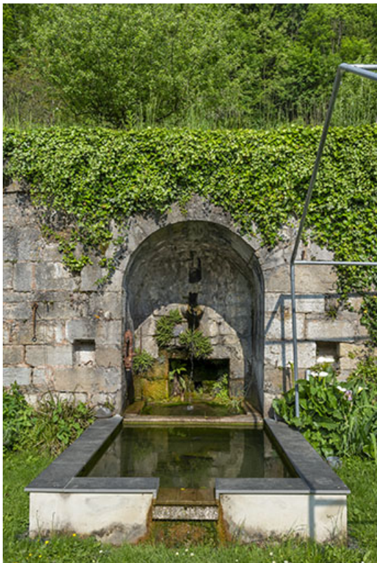
Fontaine dans la cours, au sud.

39, Salins-les-Bains, lieudit : le Paradis