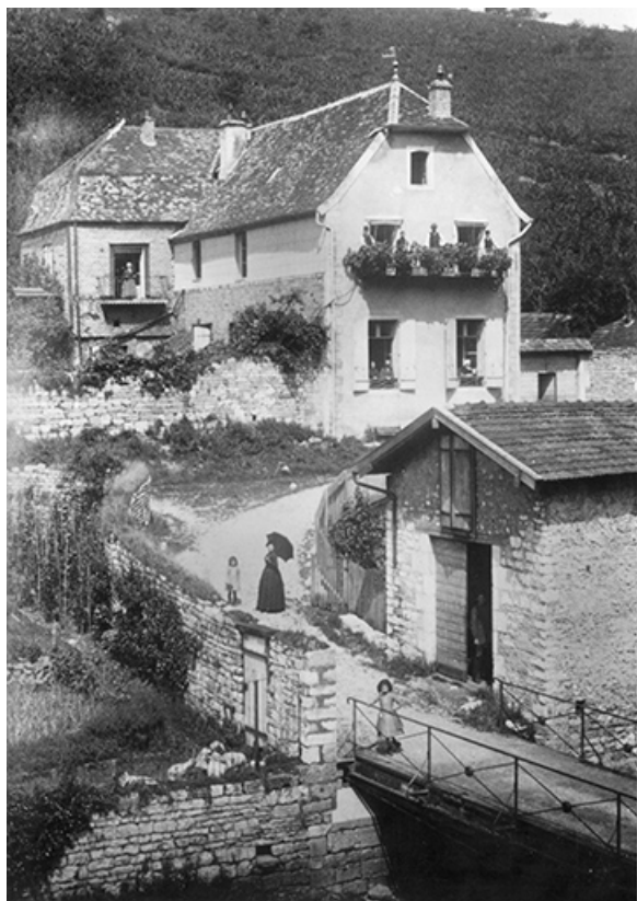
Vue de trois quarts, fotogr., s.n., s.d. [début 20e siècle]. 39, Salins-les-Bains, lieudit : le Paradis