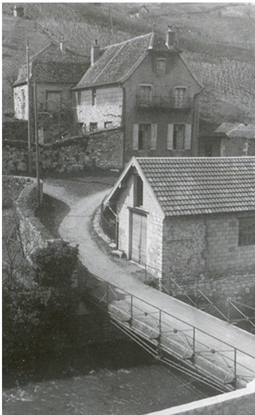
Vue d'ensemble depuis le sud-est, fotogr. Georges Chenu, s.d. [milieu 20e siècle]. 39, Salins-les-Bains, lieudit : le Paradis