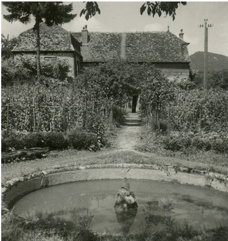
La maison vue depuis le jardin, au sud, fotogr. Georges Chenu, s.d. [milieu 20e siècle]. 39, Salins-les-Bains, lieudit : le Paradis

La maison vue depuis le jardin, au sud, fotogr. Georges Chenu, s.d. [milieu 20e siècle]. Collection particulière. Lieu de conservation : Collection particulière