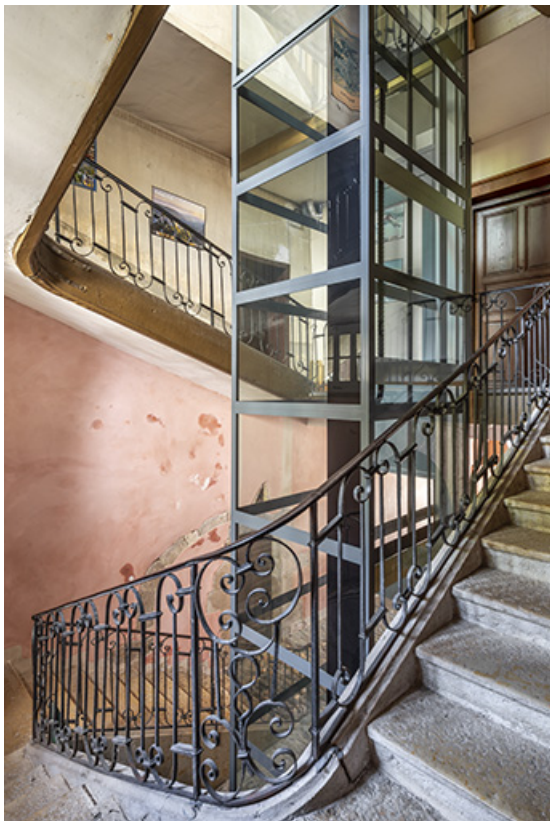
La cage d'escalier depuis le second repos.

39, Salins-les-Bains, 86 rue de la Liberté