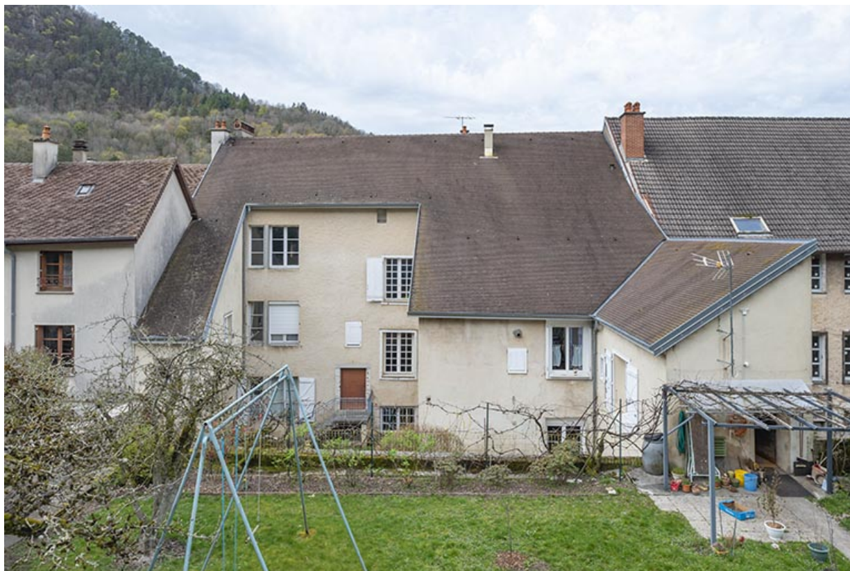
Façade postérieure de l'hôtel depuis la seconde terrasse.

39, Salins-les-Bains, 86 rue de la Liberté