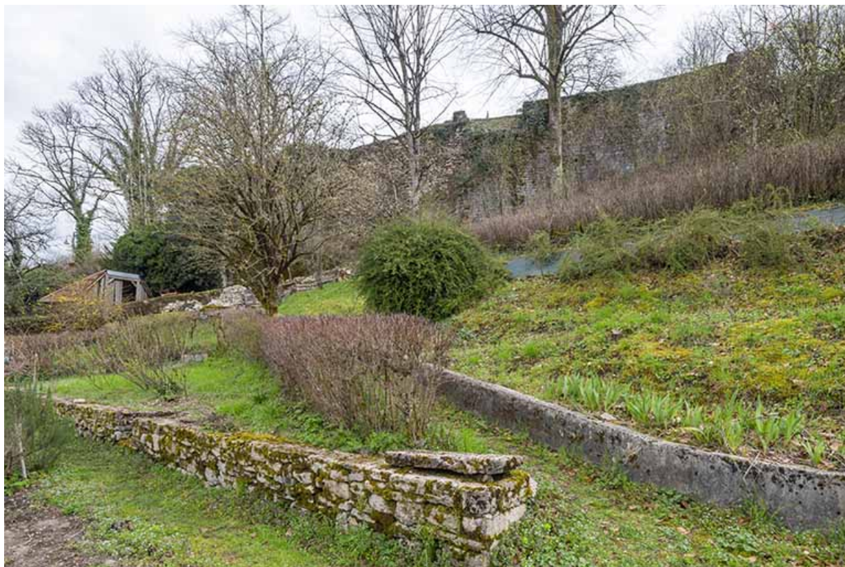
Vue depuis la première terrasse. Au second plan, parement interne de l'enceinte fortifiée.

39, Salins-les-Bains, 86 rue de la Liberté