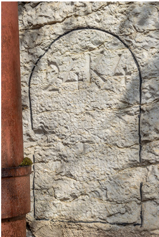
Borne gravée (24K4) au nord de la façade.

39, Salins-les-Bains, 86 rue de la Liberté