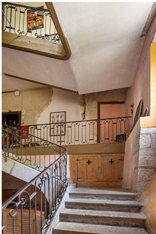
L'escalier vu depuis le premier repos.

39, Salins-les-Bains, 86 rue de la Liberté