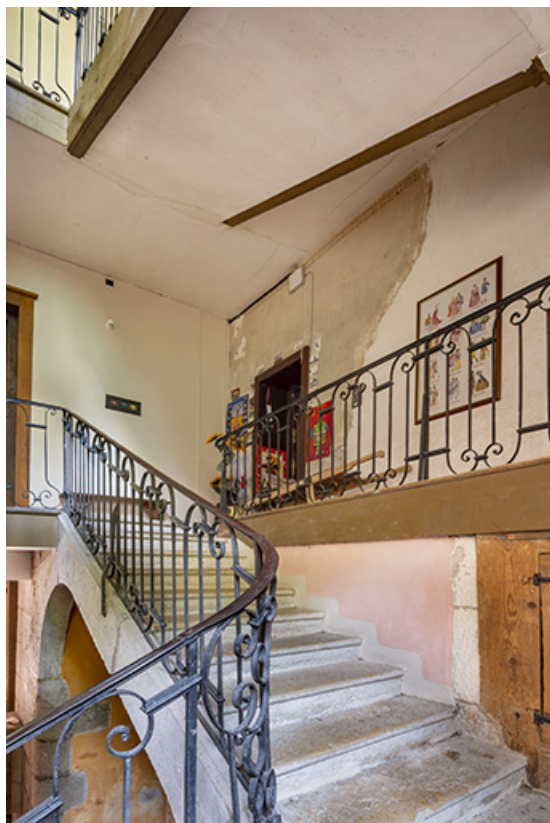
Cage d'escalier depuis la seconde volée.

39, Salins-les-Bains, 86 rue de la Liberté