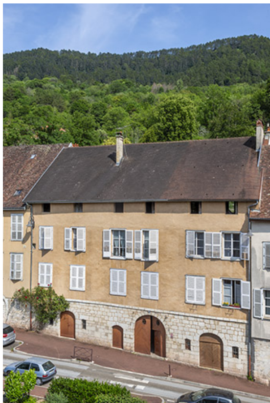
Façade antérieure vue depuis l'ouest. 39, Salins-les-Bains, 86 rue de la Liberté