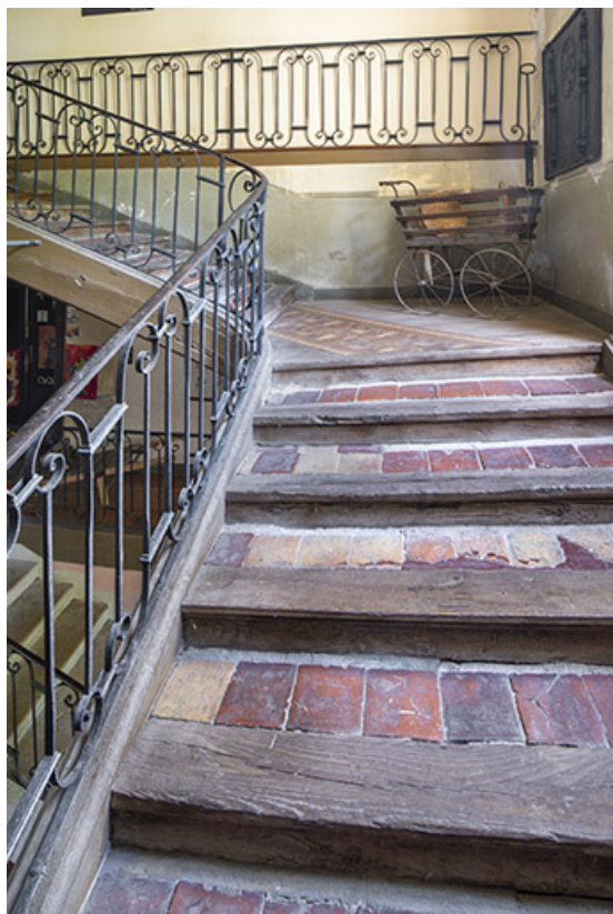
Volée d'escalier entre le premier et le second étage.

39, Salins-les-Bains, 86 rue de la Liberté