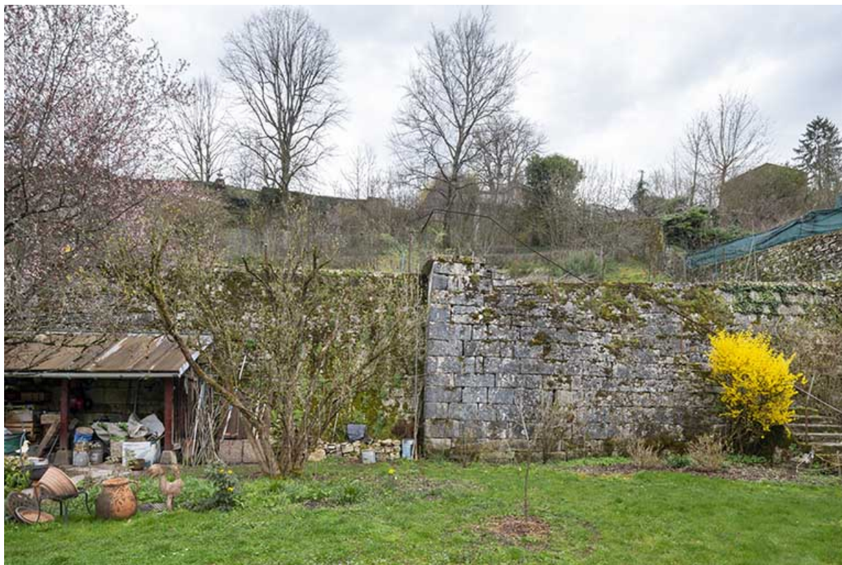
Vue depuis la terrasse en terre-plein en façade postérieure (second étage).

39, Salins-les-Bains, 86 rue de la Liberté