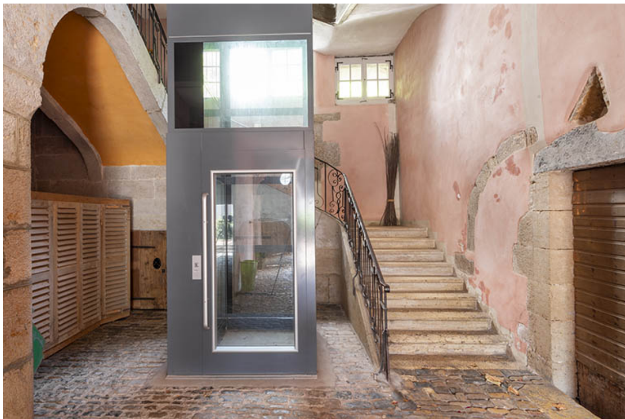
La cage d'escalier depuis l'entrée au rez-de-chaussée.

39, Salins-les-Bains, 86 rue de la Liberté