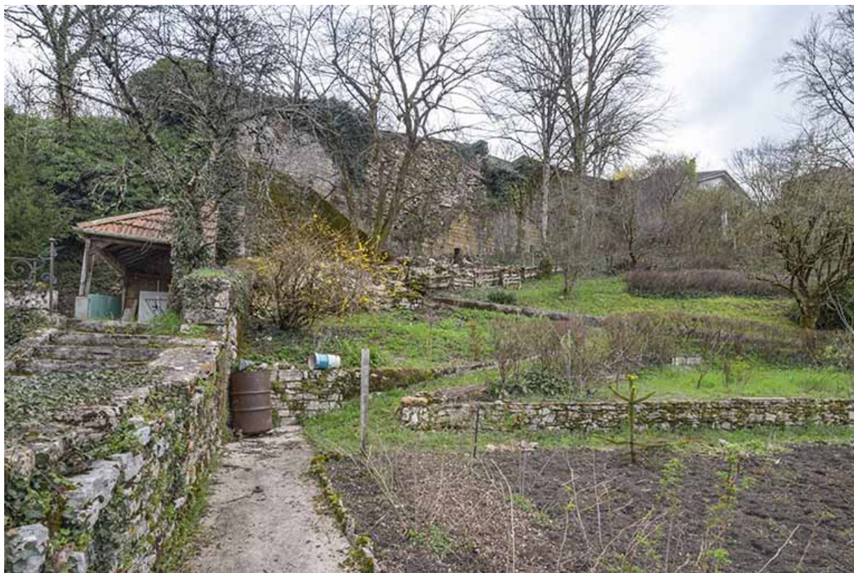
Vue depuis la seconde terrasse. Partie talutée menant au rempart.

39, Salins-les-Bains, 86 rue de la Liberté