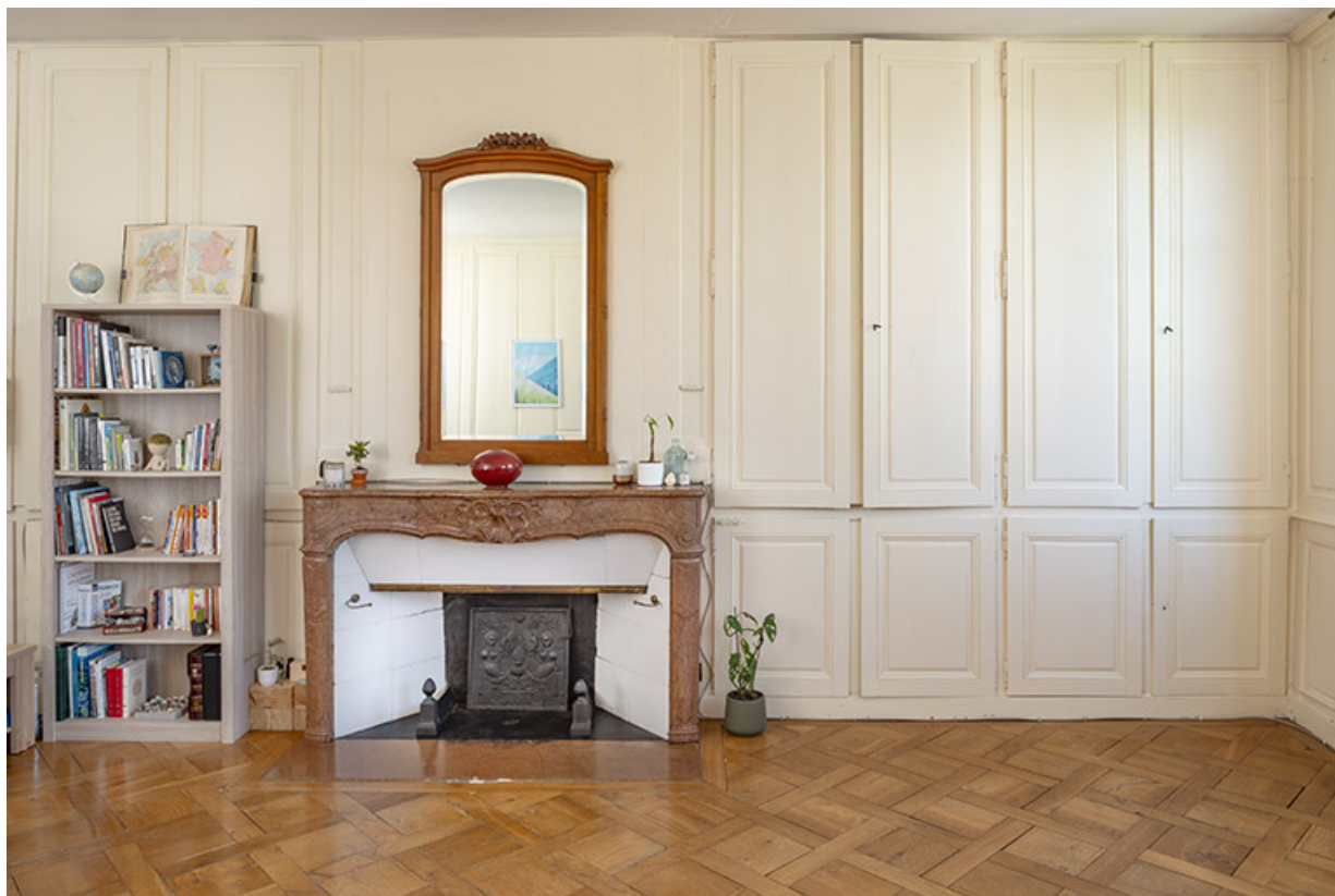
Inérieur d'un salon (deuxième étage).

39, Salins-les-Bains, 86 rue de la Liberté