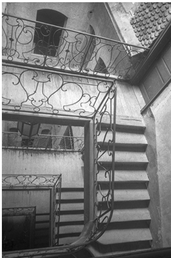
Vue plongeante sur la cage d'escalier, s.d. [vers 1960].

39, Salins-les-Bains, 18 rue de la Liberté