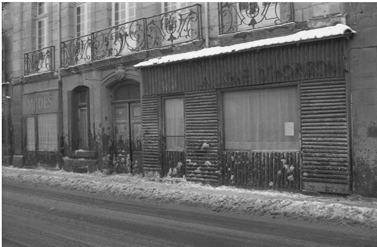
Rez-de-chaussée et devanture du magasin La ligne d'horizon, s.d. [vers 1960]. 39, Salins-les-Bains, 18 rue de la Liberté