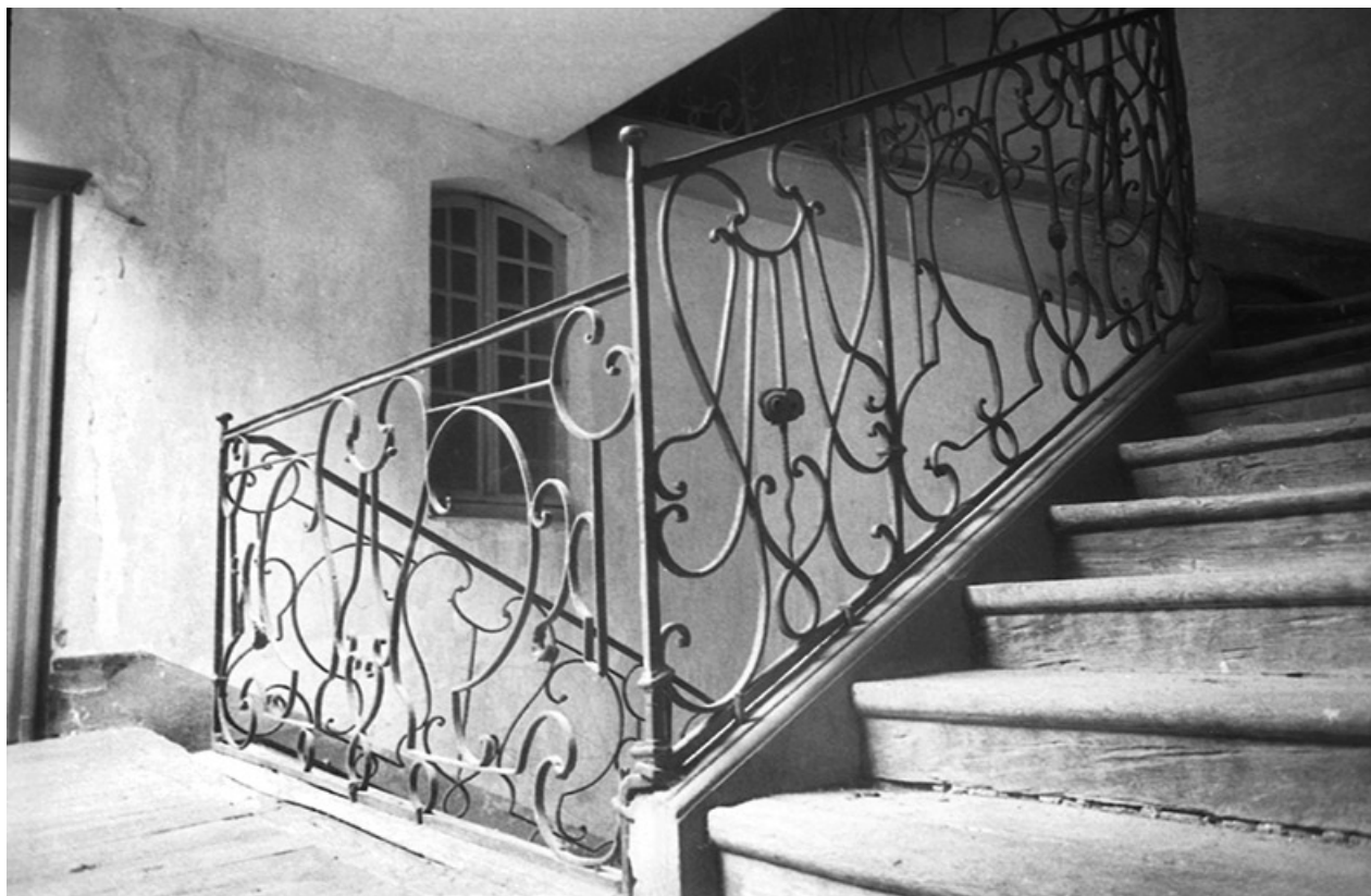
Cage d'escalier. Le troisième étage, s.d. [vers 1960].

39, Salins-les-Bains, 18 rue de la Liberté