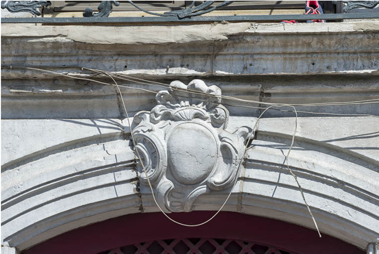
Porte principale. Détail de la clef de l'arc segmentaire.

39, Salins-les-Bains, 18 rue de la Liberté