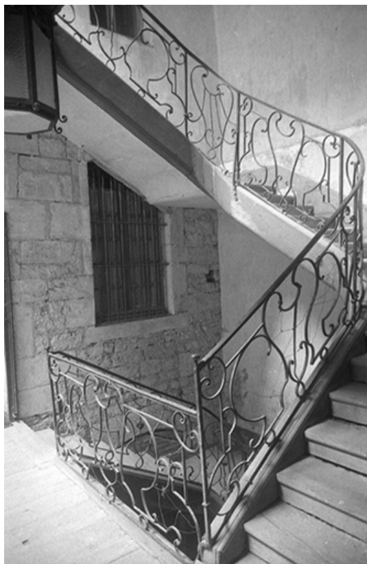
Cage d'escalier. Le second étage, s.d. [vers 1960]. 39, Salins-les-Bains, 18 rue de la Liberté