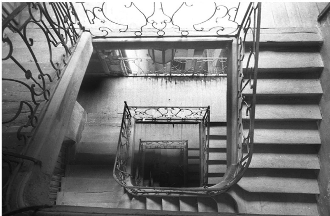
Vue plongeante sur la cage d'escalier (cadrage horizontal), s.d. [vers 1960].

39, Salins-les-Bains, 18 rue de la Liberté