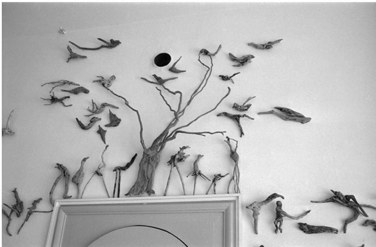
Intérieur du magasin La ligne d'horizon, s.d. [vers 1960].

39, Salins-les-Bains, 18 rue de la Liberté