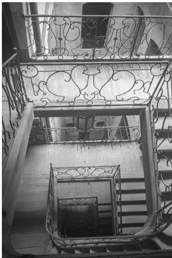
Vue plongeante sur la cage d'escalier (cadrage vertical), s.d. [vers 1960]. 39, Salins-les-Bains, 18 rue de la Liberté