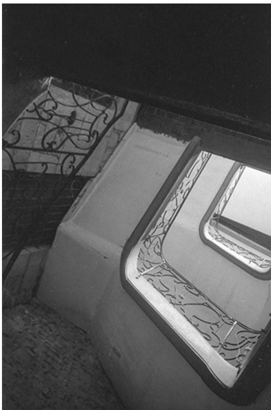
Vue en contre-plongée de la cage d'escalier, s.d. [vers 1960].

39, Salins-les-Bains, 18 rue de la Liberté