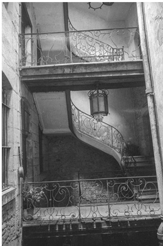
La cage d'escalier, s.d. [vers 1960].

39, Salins-les-Bains, 18 rue de la Liberté