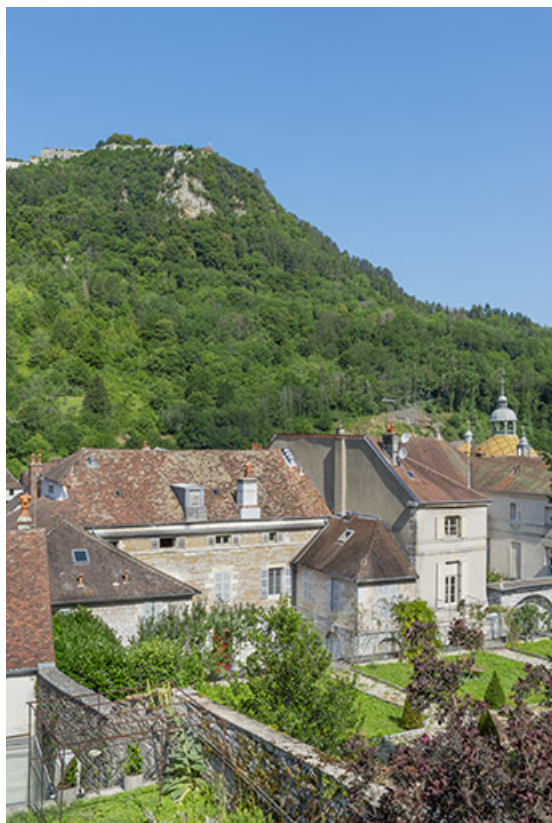
Vue plongeante depuis le sud-est.