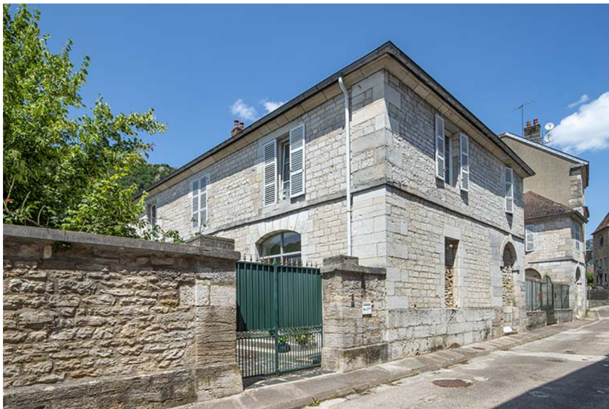
Aile sud. Façade sur le jardin.