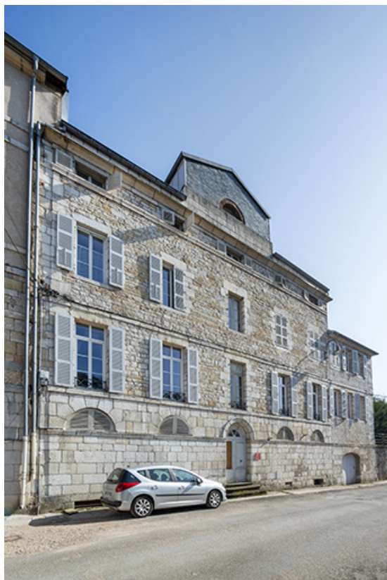
Façade postérieure vue de trois quarts.