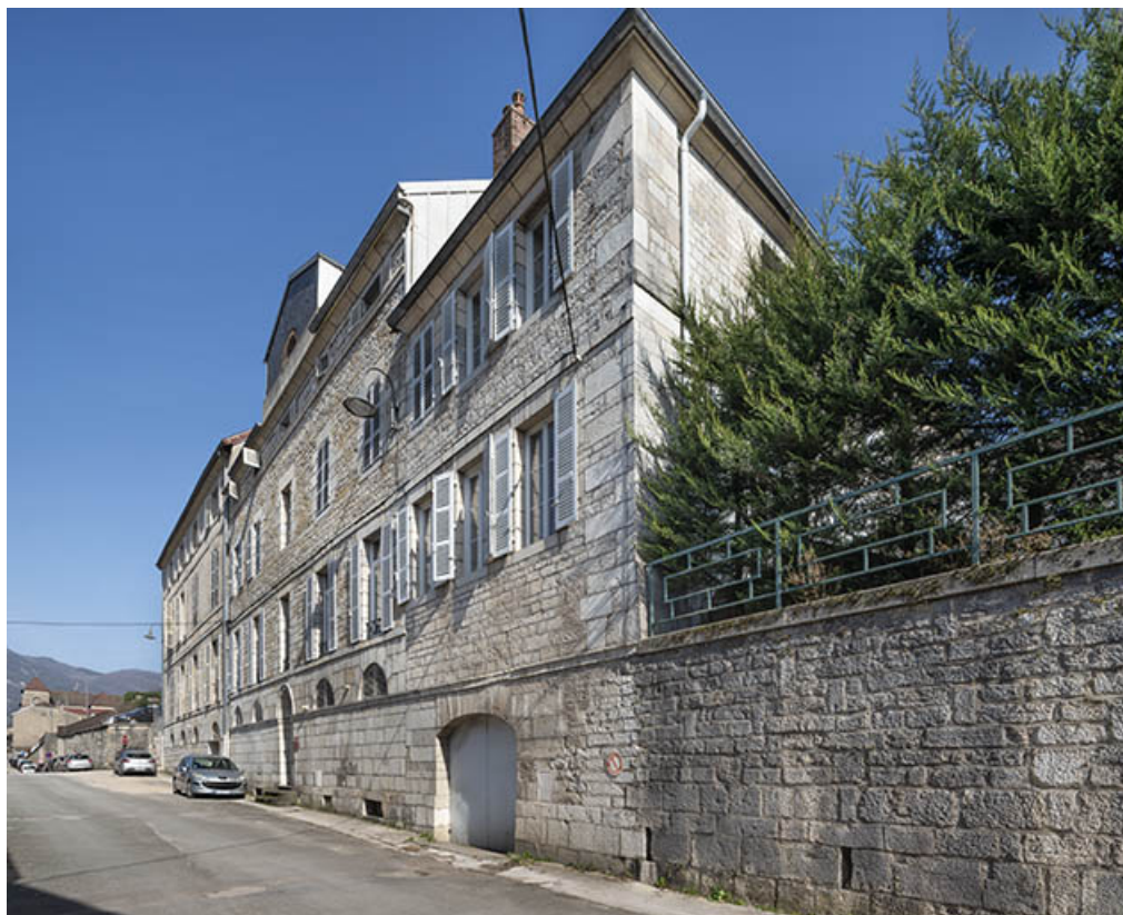
Vue d'ensemble, depuis le sud-ouest.