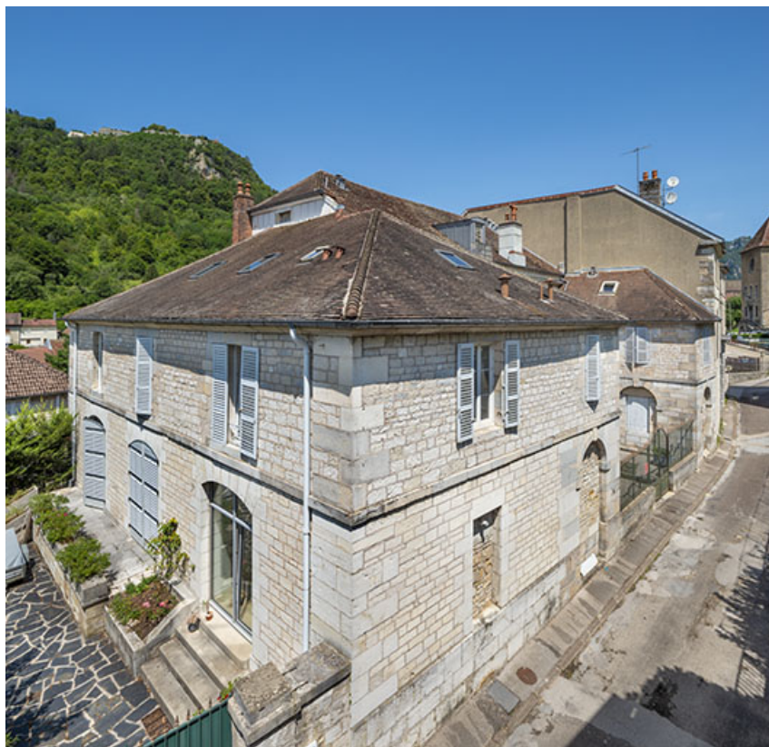
Vue plongeante depuis le sud-est.