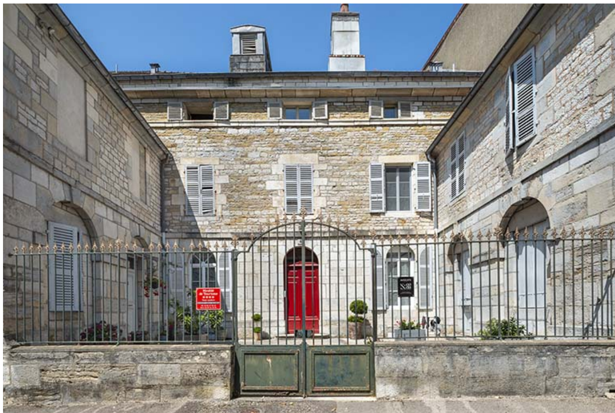
Vue de face depuis la rue d'Orgemont.