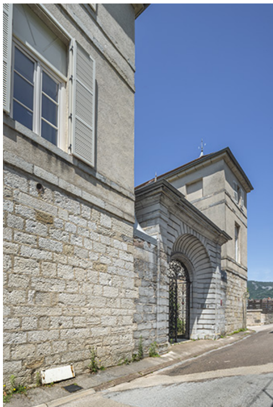
Façade antérieure vue de trois quarts gauche.