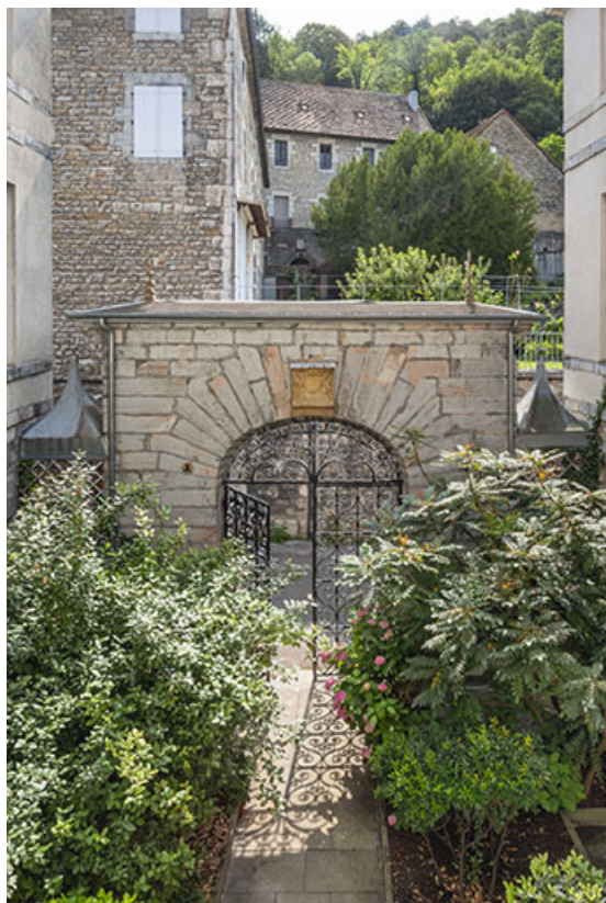
Vue de la cour depuis le premier étage.