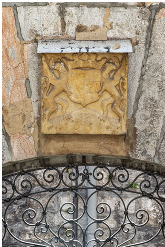
Relief armorié employé sur le revers de la porte monumentale.