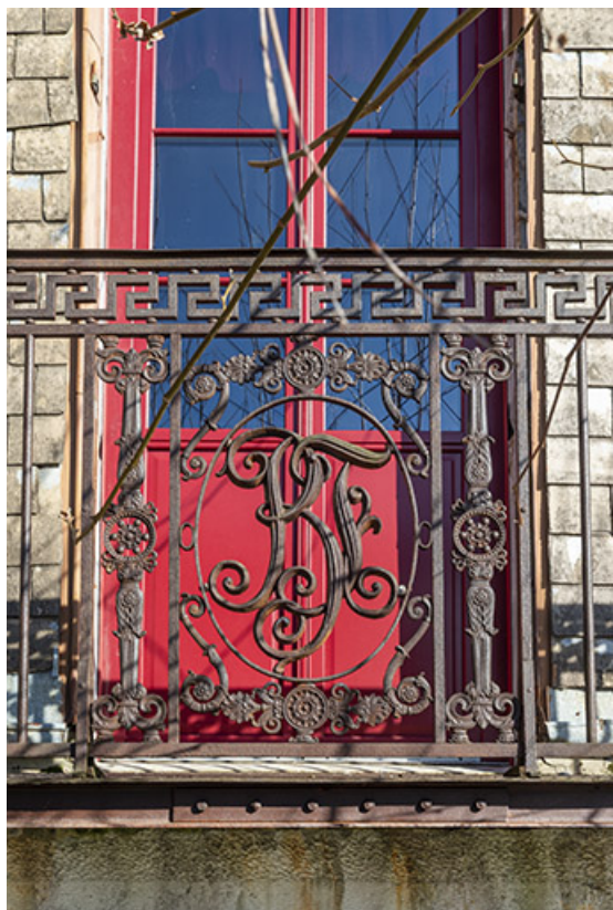
Détail du garde-corps du premier étage.