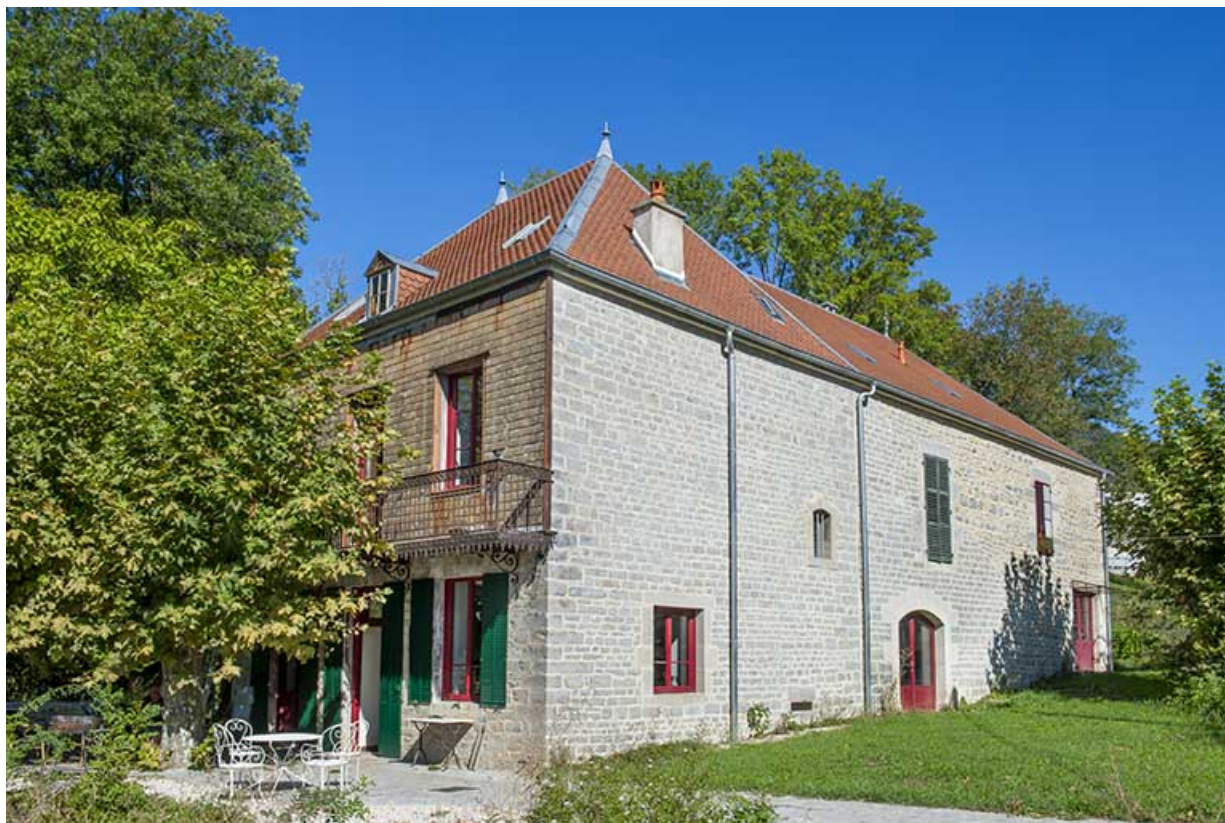
Vue de trois quarts gauche (en été).