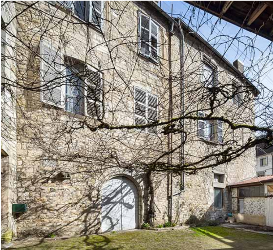
Façade sud (à gauche) depuis la cour de l'hôtel de Falletans.

39, Salins-les-Bains, 13 rue de la Liberté