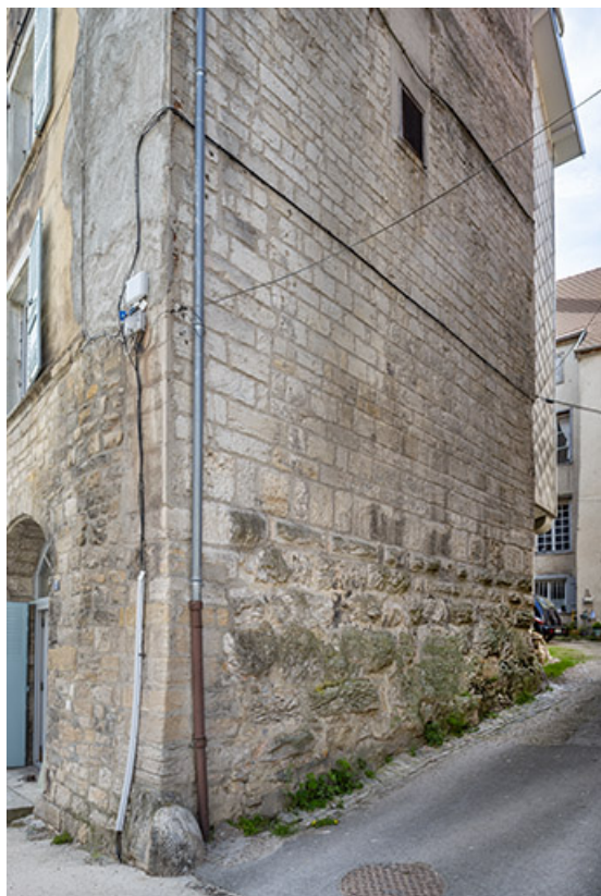
Façade nord du n°17.

39, Salins-les-Bains, 15, 17 rue de la Liberté