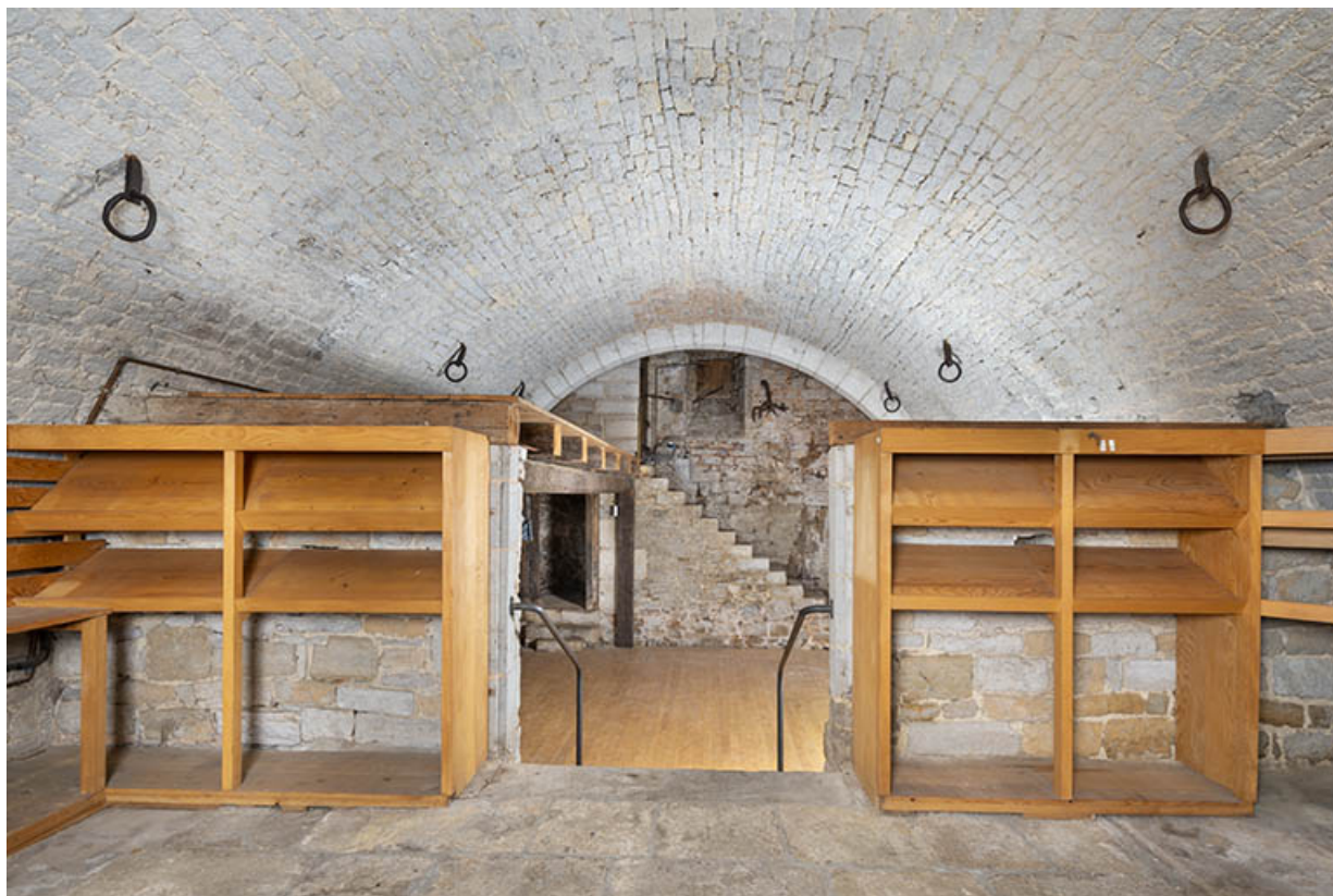
Cave (aile nord). Vue depuis l'entrée.

39, Salins-les-Bains, 13 rue de la Liberté