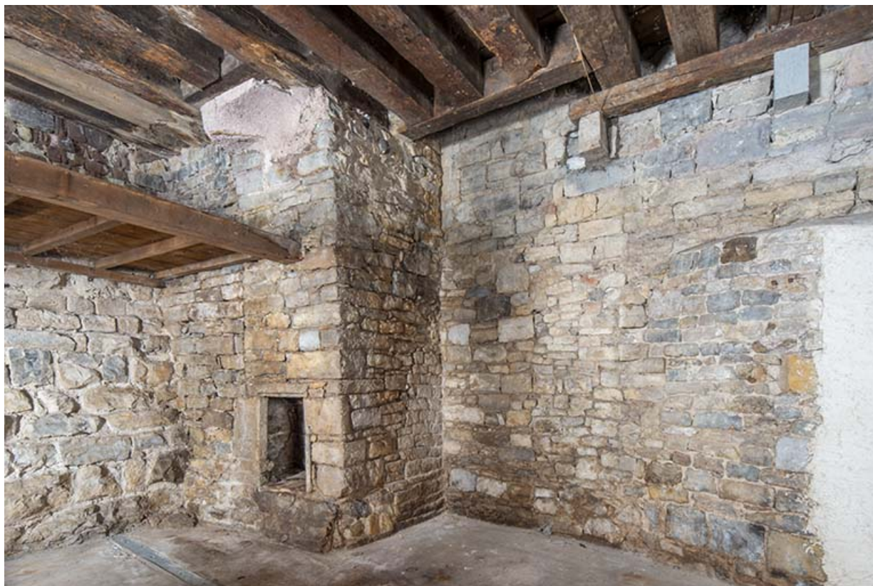
Cave ouest. Maçonneries à l'angle nord-est.

39, Salins-les-Bains, 13 rue de la Liberté