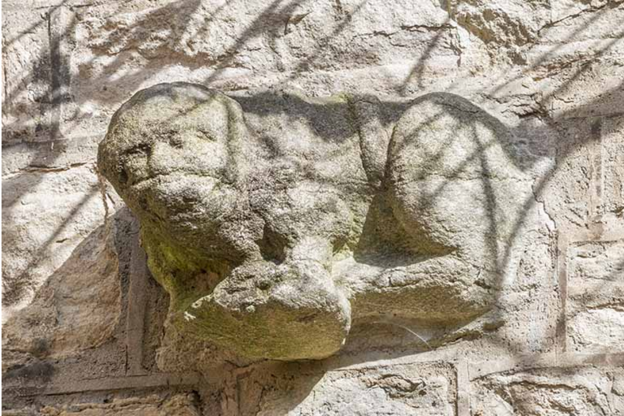
Sculpture (lion couché ?) enchassée dans la maçonnerie du mur sud.

39, Salins-les-Bains, 13 rue de la Liberté