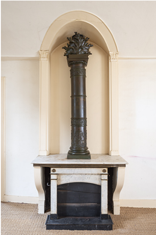
Aile nord. Cheminée (deuxième étage). 39, Salins-les-Bains, 13 rue de la Liberté