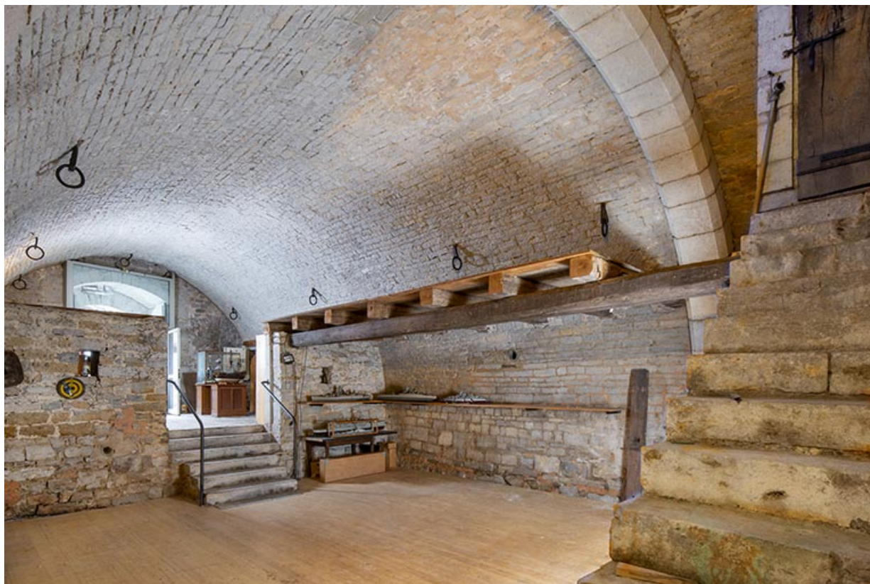
Cave est (aile nord). Vue depuis le nord-est. 39, Salins-les-Bains, 13 rue de la Liberté