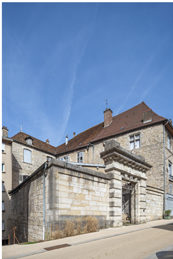
Vue de trois quarts depuis la rue.

39, Salins-les-Bains, 13 rue de la Liberté