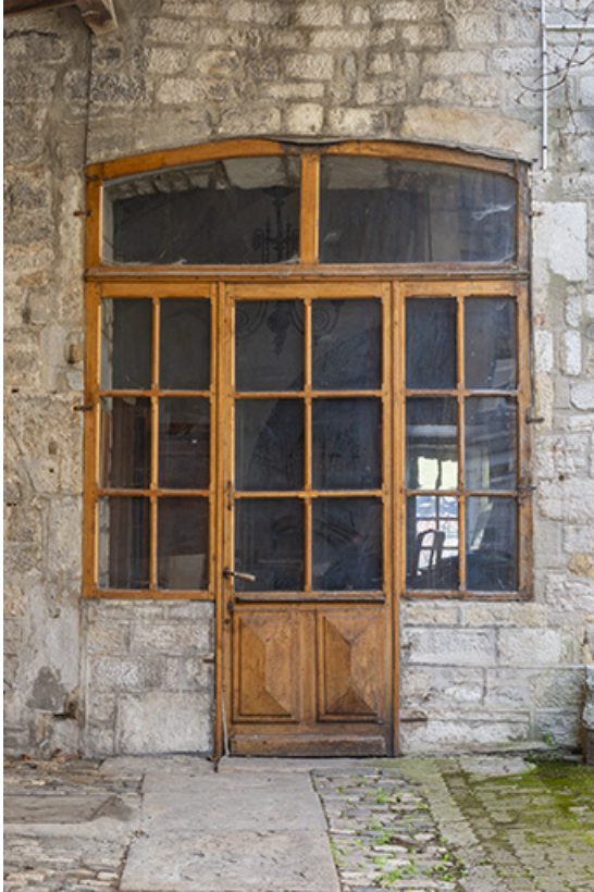
Porte gauche sur cour (mur est).

39, Salins-les-Bains, 13 rue de la Liberté