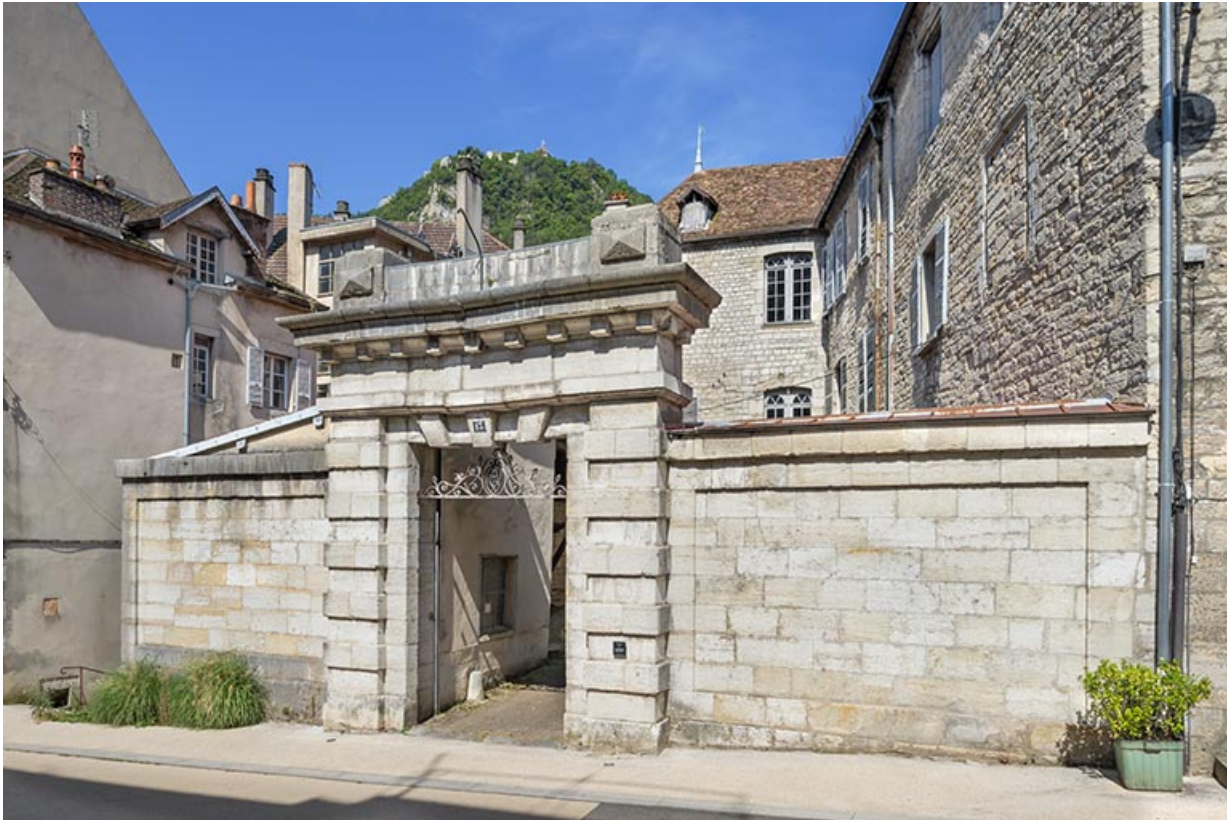
Le mur sur rue et la porte monumentale, vus de trois quarts.

39, Salins-les-Bains, 13 rue de la Liberté