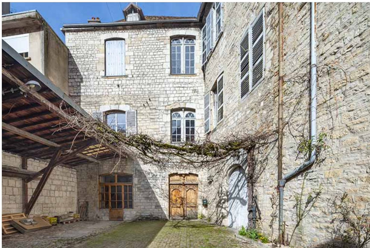
La cour vue depuis le nord-est.

39, Salins-les-Bains, 13 rue de la Liberté