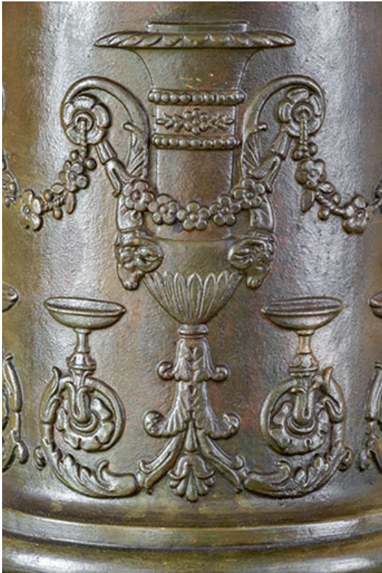
Cheminée. Détail du conduit d'évacuation (grès flammé).

39, Salins-les-Bains, 13 rue de la Liberté