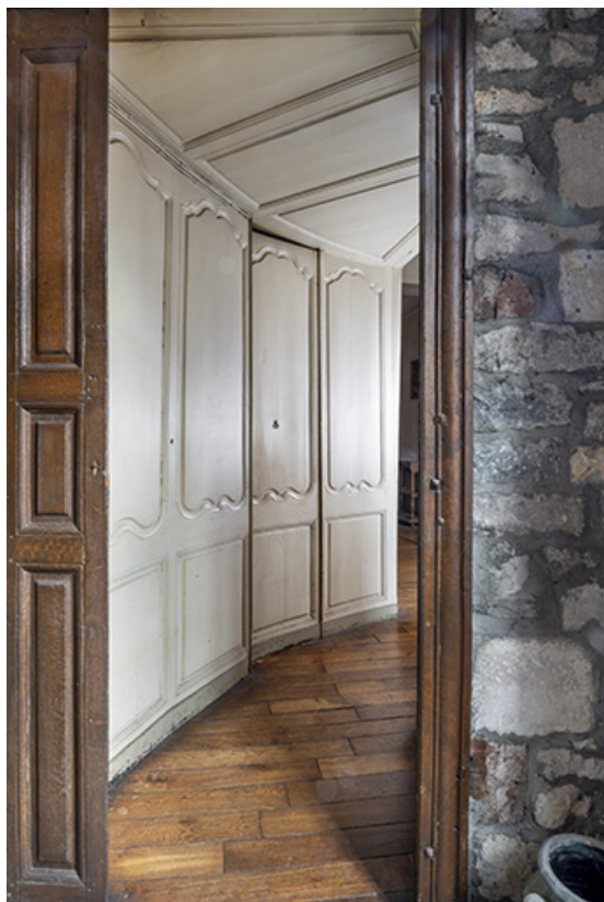
Aile nord. Entrée de l'appartement du premier étage. 39, Salins-les-Bains, 13 rue de la Liberté