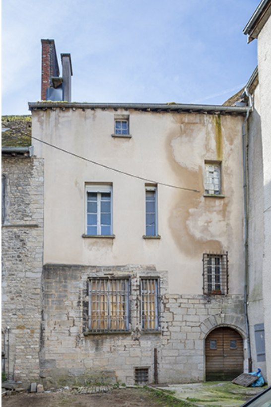
Aile nord (vue depuis la cour des halles).

39, Salins-les-Bains, 1, 3, 4 et 6 cour des Halles