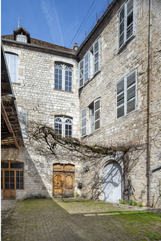
Façades est et sud depuis la cour.

39, Salins-les-Bains, 13 rue de la Liberté