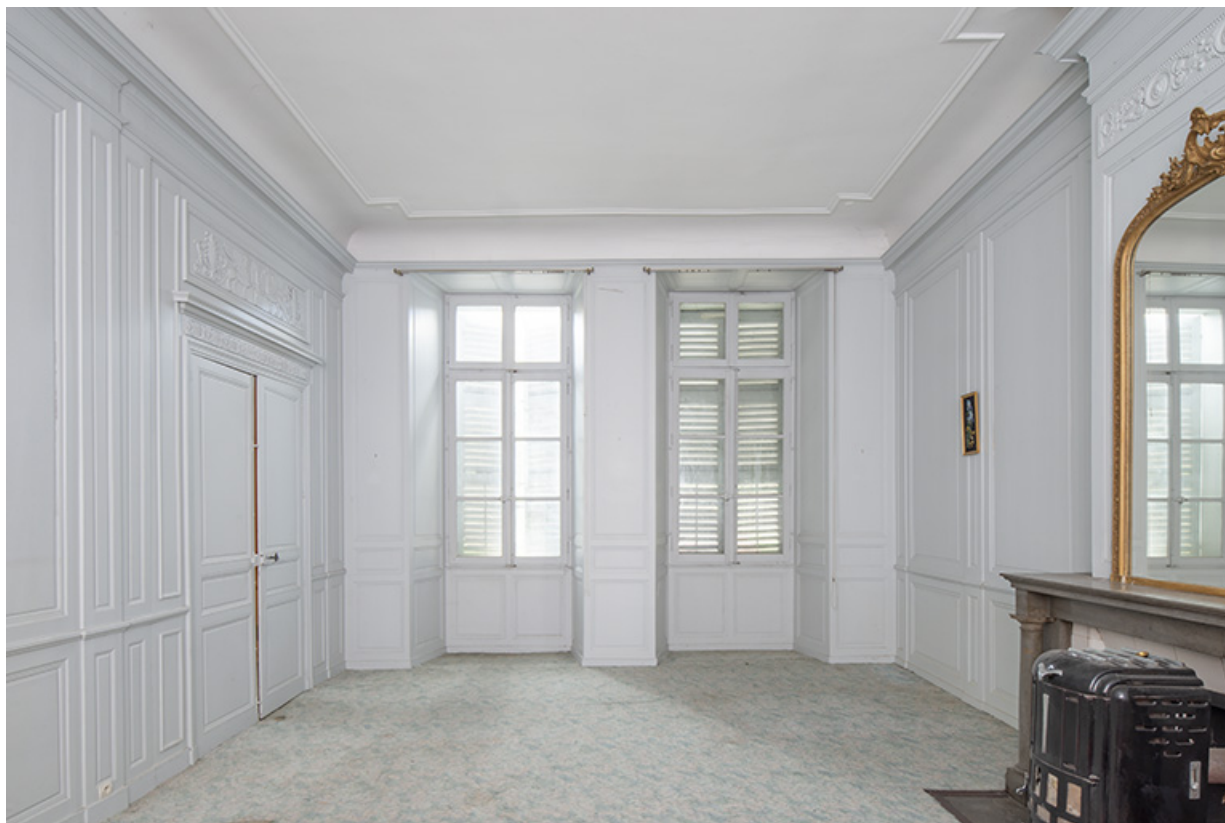
Pièce du premier étage (aile nord). Vue axiale.

39, Salins-les-Bains, 13 rue de la Liberté