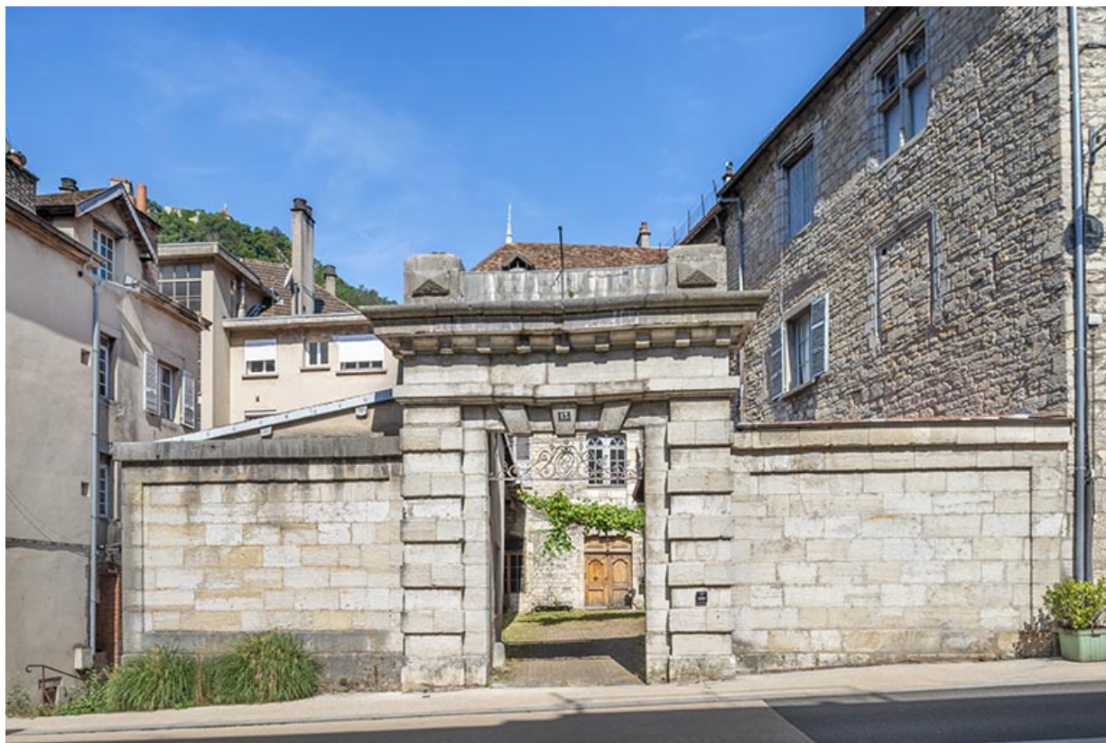
Vue de face du mur et de la porte monumentale.

39, Salins-les-Bains, 13 rue de la Liberté