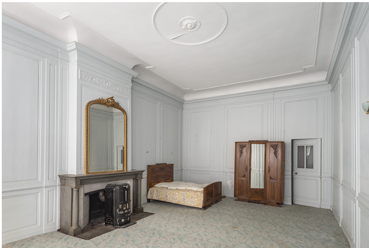
Pièce du premier étage (aile nord). Vue de trois quarts.

39, Salins-les-Bains, 13 rue de la Liberté