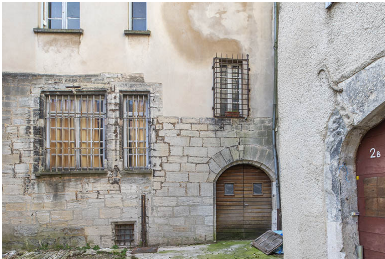
Alle nord. Premiers niveaux, depuis la cour des halles.

39, Salins-les-Bains, 13 rue de la Liberté