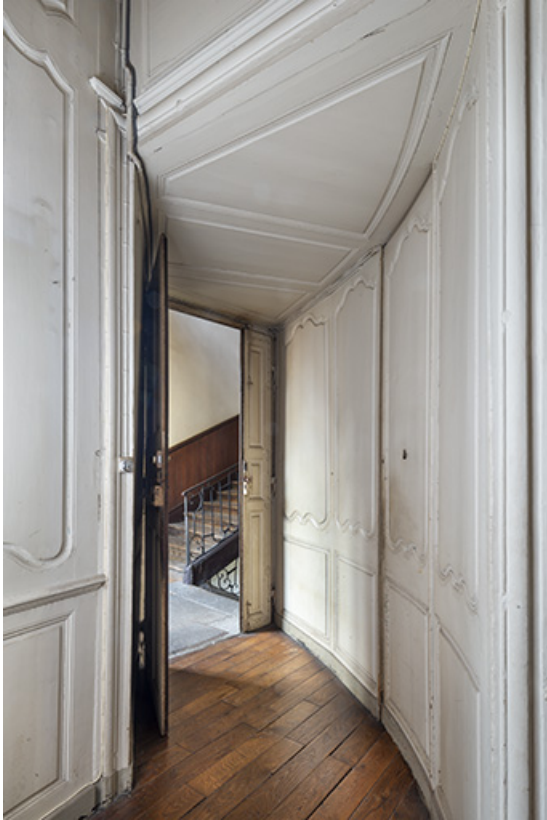
Aile nord. Couloir d'entrée de l'appartement du premier étage.

39, Salins-les-Bains, 13 rue de la Liberté