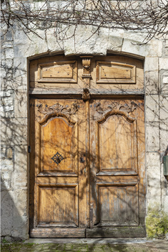
Porte droite sur cour (mur est).

39, Salins-les-Bains, 13 rue de la Liberté