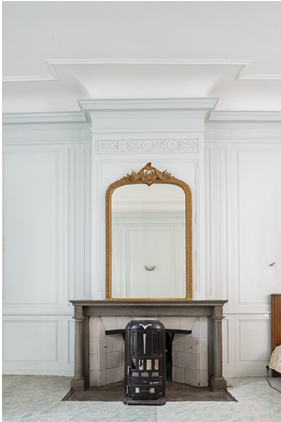
Pièce du premier étage (aile nord). Cheminée.

39, Salins-les-Bains, 13 rue de la Liberté