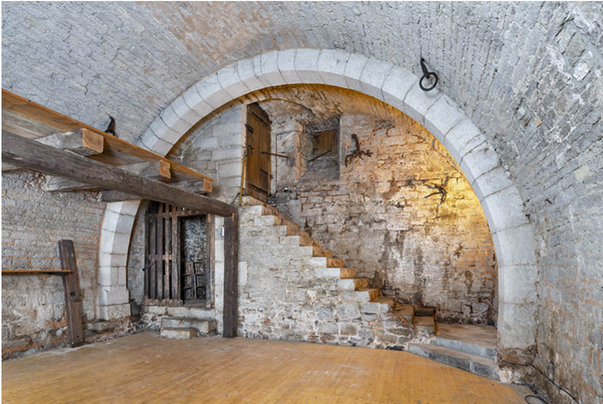
Cave est (aile nord). Extrémité septentrionale. 39, Salins-les-Bains, 13 rue de la Liberté