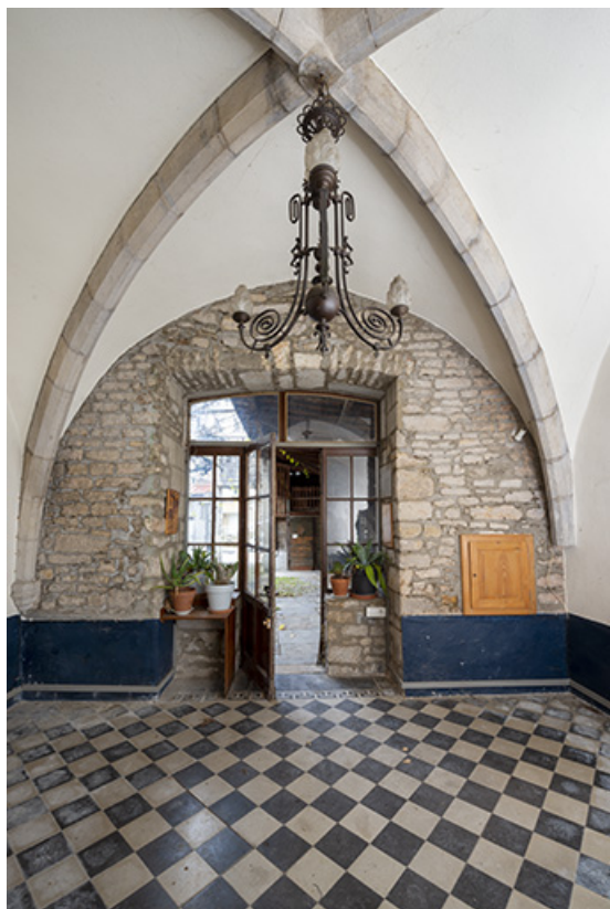
Pièce voûtée (rez-de-chaussée de la tour).

39, Salins-les-Bains, 13 rue de la Liberté