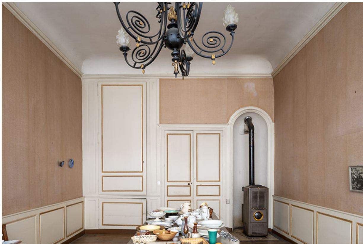
Salle à manger (?) au premier étage (aile nord).

39, Salins-les-Bains, 13 rue de la Liberté