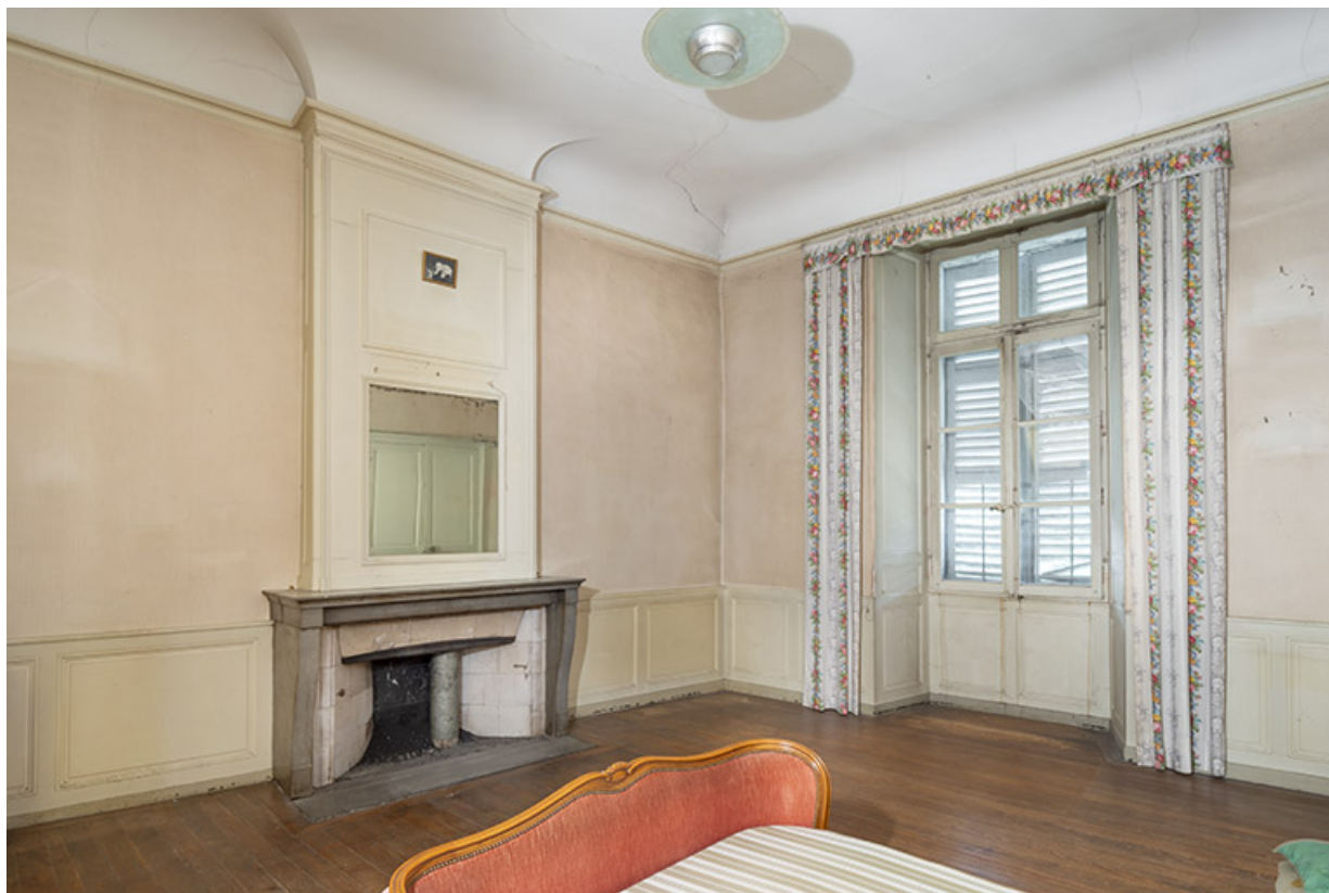
Chambre du premier étage (aile nord). Vue de trois quarts.

39, Salins-les-Bains, 13 rue de la Liberté