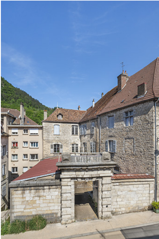
Vue plongeante d'ensemble depuis l'est.

39, Salins-les-Bains, 13 rue de la Liberté