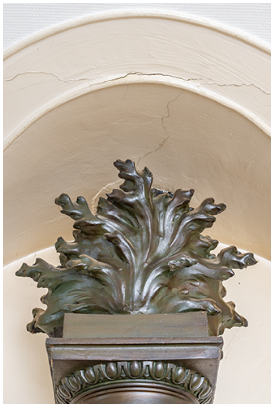
Cheminée. Couronnement du conduit d'évacuation (grès flammé).

39, Salins-les-Bains, 13 rue de la Liberté