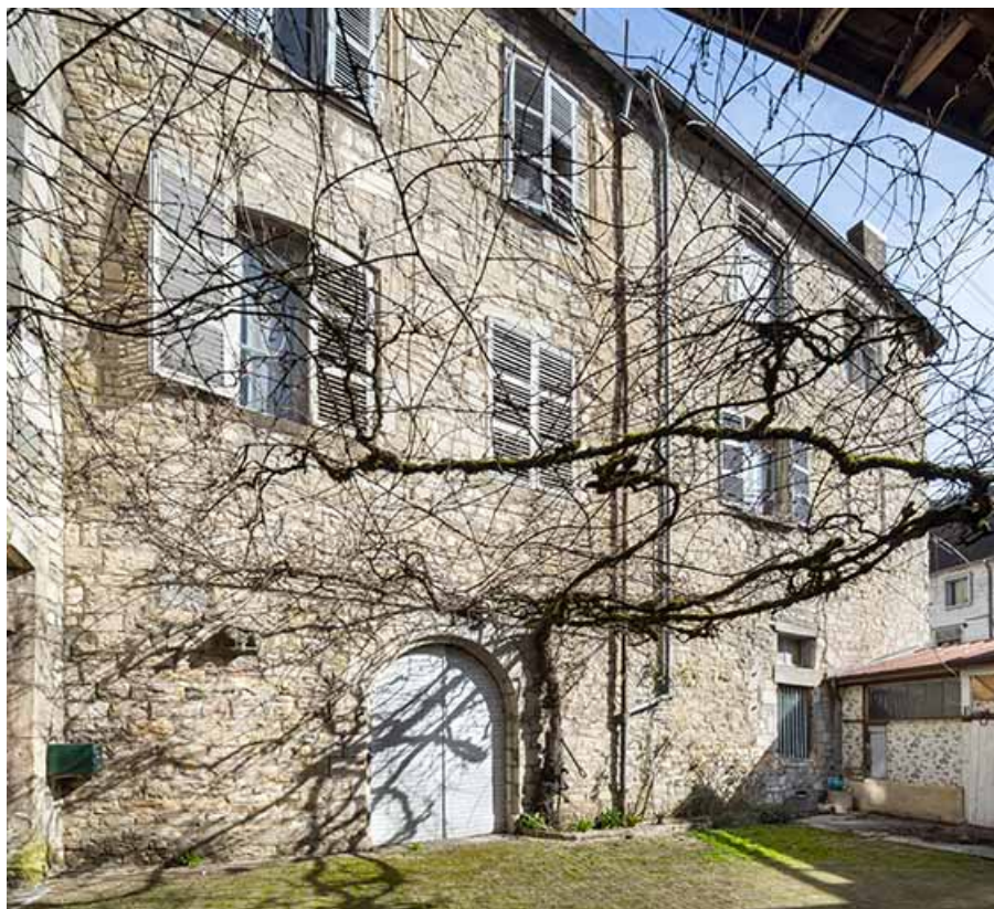
Façade sud (à gauche) depuis la cour de l'hôtel de Falletans.

39, Salins-les-Bains, 13 rue de la Liberté