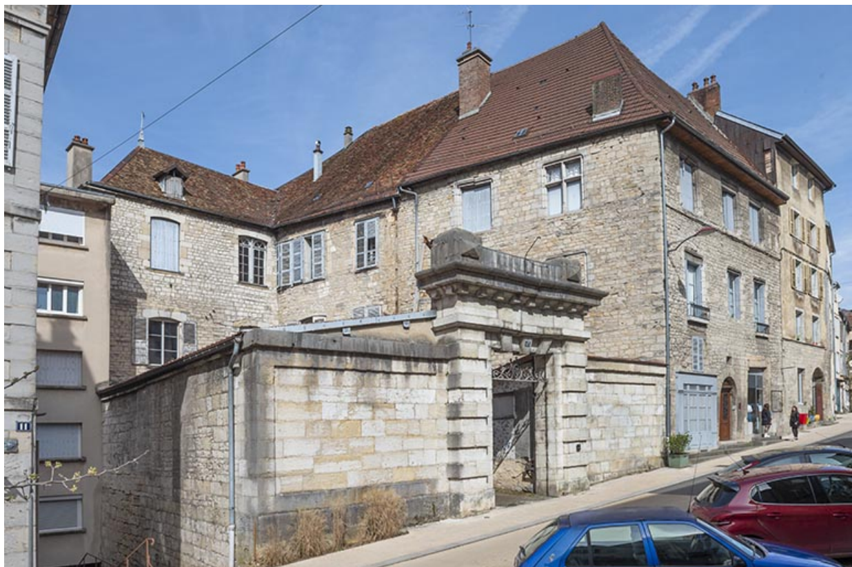
Vue d'ensemble de trois quarts gauche (l'hôtel est en fond de cour).

39, Salins-les-Bains, 13 rue de la Liberté