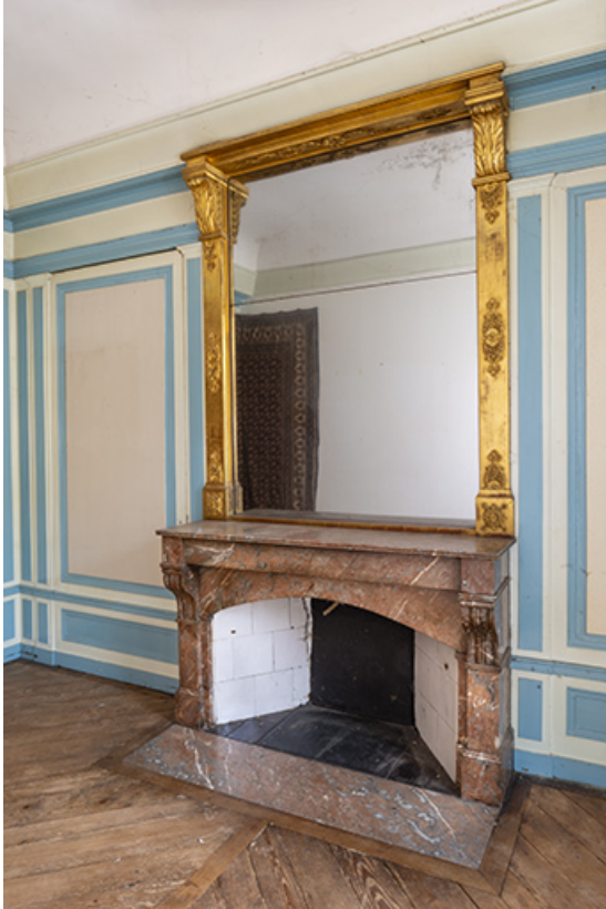
Aile nord. Cheminée (deuxième étage). 39, Salins-les-Bains, 13 rue de la Liberté