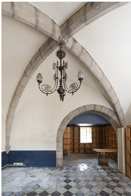
Pièce voûtée (rez-de-chaussée de la tour). Vue depuis la porte.

39, Salins-les-Bains, 13 rue de la Liberté