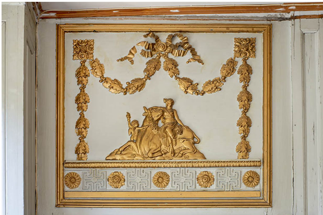
Grand salon. Dessus-de-porte historié : l'enlèvement d'Europe.

39, Salins-les-Bains, 4 rue du Chambenoz