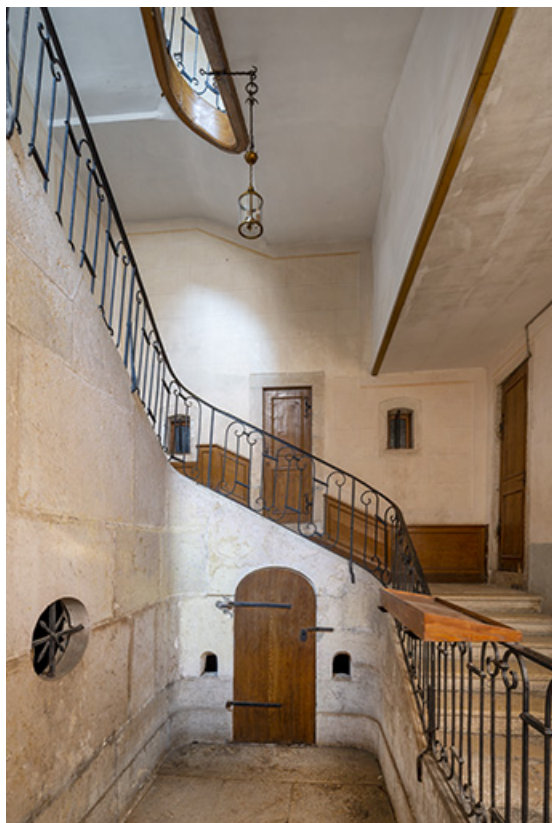
Escalier. Vue axiale depuis le rez-de-chaussée.

39, Salins-les-Bains, 4 rue du Chambenoz