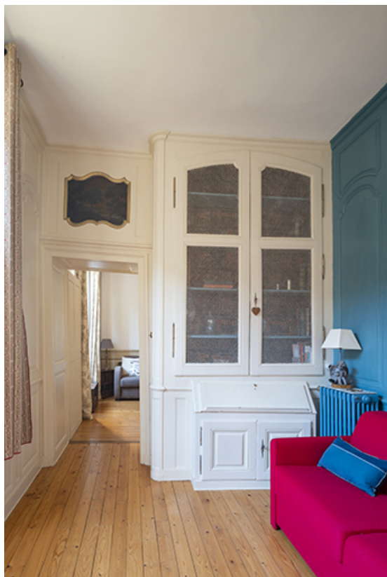
Antichambre (?) au second étage. Vue depuis la porte palière.

39, Salins-les-Bains, 4 rue du Chambenoz