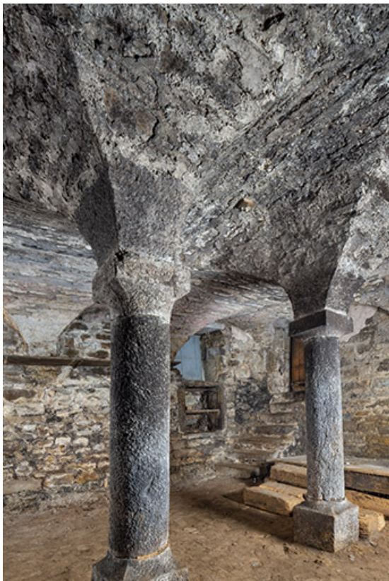
Vue d'ensemble de la cave depuis le sud.

39, Salins-les-Bains, 4 rue du Chambenoz