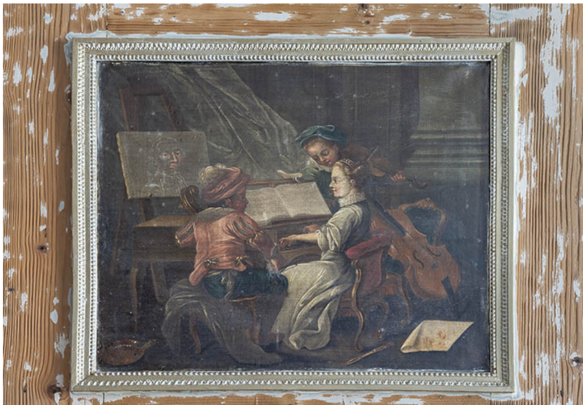
Chambre (second étage). Tableau (dessus de cheminée).

39, Salins-les-Bains, 4 rue du Chambenoz