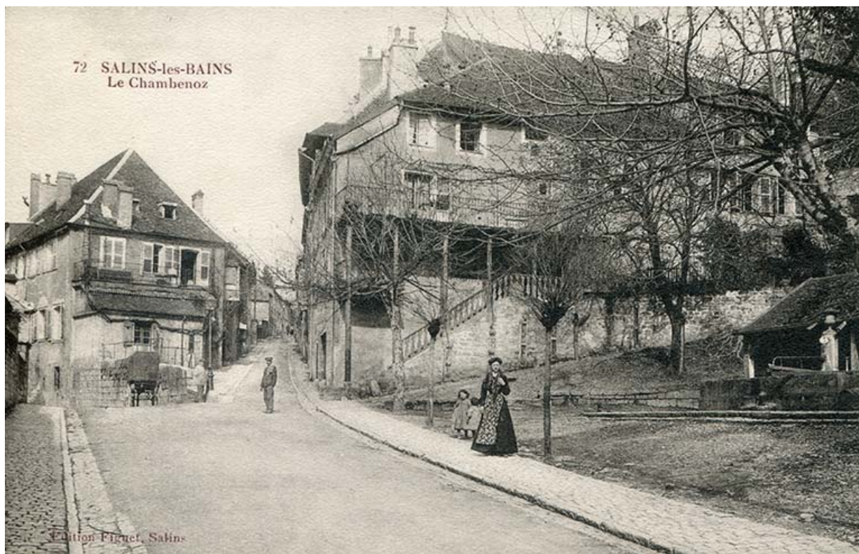
Salins-les-Bains. Le Chambenoz, carte postale, s.d. [fin 19e ou début 20e siècle].

39, Salins-les-Bains, 4 rue du Chambenoz