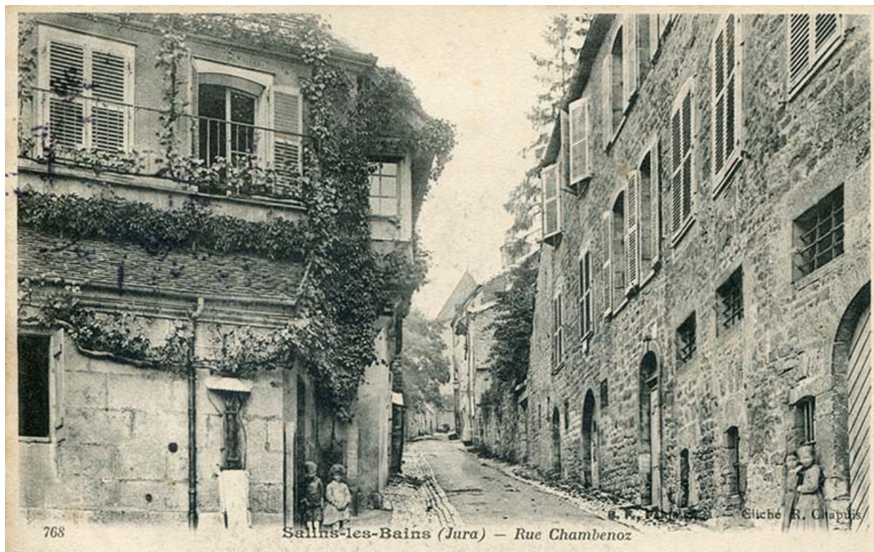
Salins-les-Bains (Jura). Rue Chambenoz, carte postale, s.d. [fin 19e ou début 20e siècle].

39, Salins-les-Bains, 4 rue du Chambenoz