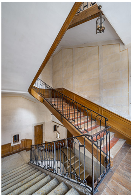
Vue de l'escalier depuis le palier du premier étage.

39, Salins-les-Bains, 4 rue du Chambenoz