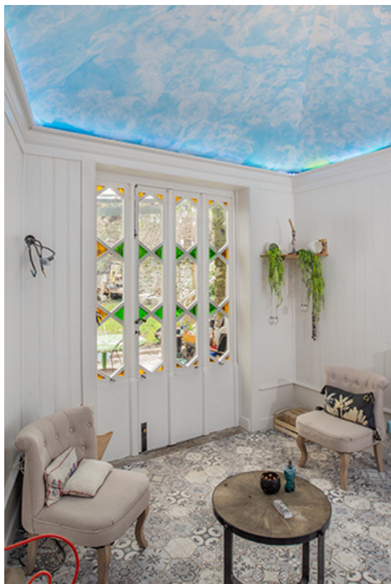
Pavillon bâti contre la façade postérieure (ancienne serre ?).

39, Salins-les-Bains, 4 rue du Chambenoz