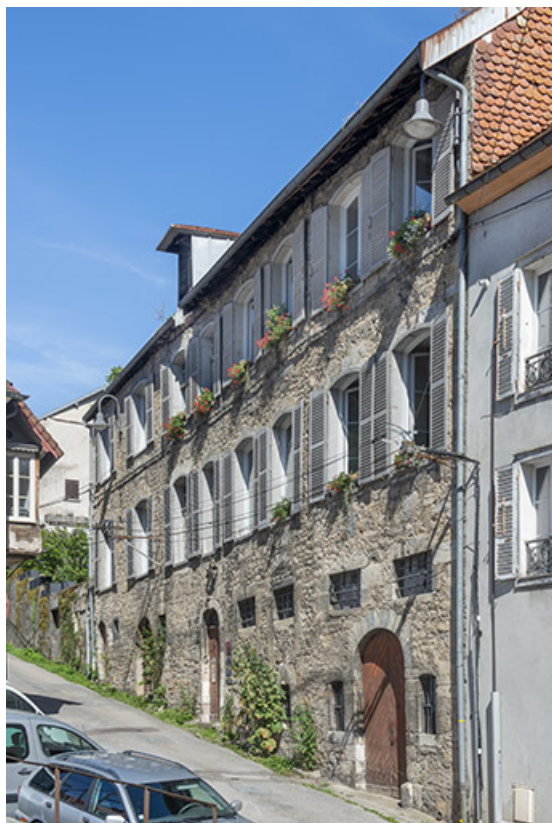
Façade antérieure vue de trois quarts droite.

39, Salins-les-Bains, 4 rue du Chambenoz