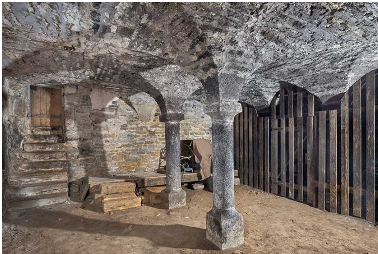
Vue d'ensemble de la cave depuis l'ouest.

39, Salins-les-Bains, 4 rue du Chambenoz