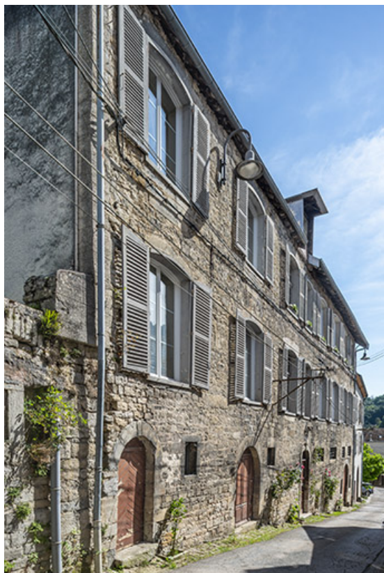
Façade antérieure vue de trois quarts gauche.

39, Salins-les-Bains, 4 rue du Chambenoz