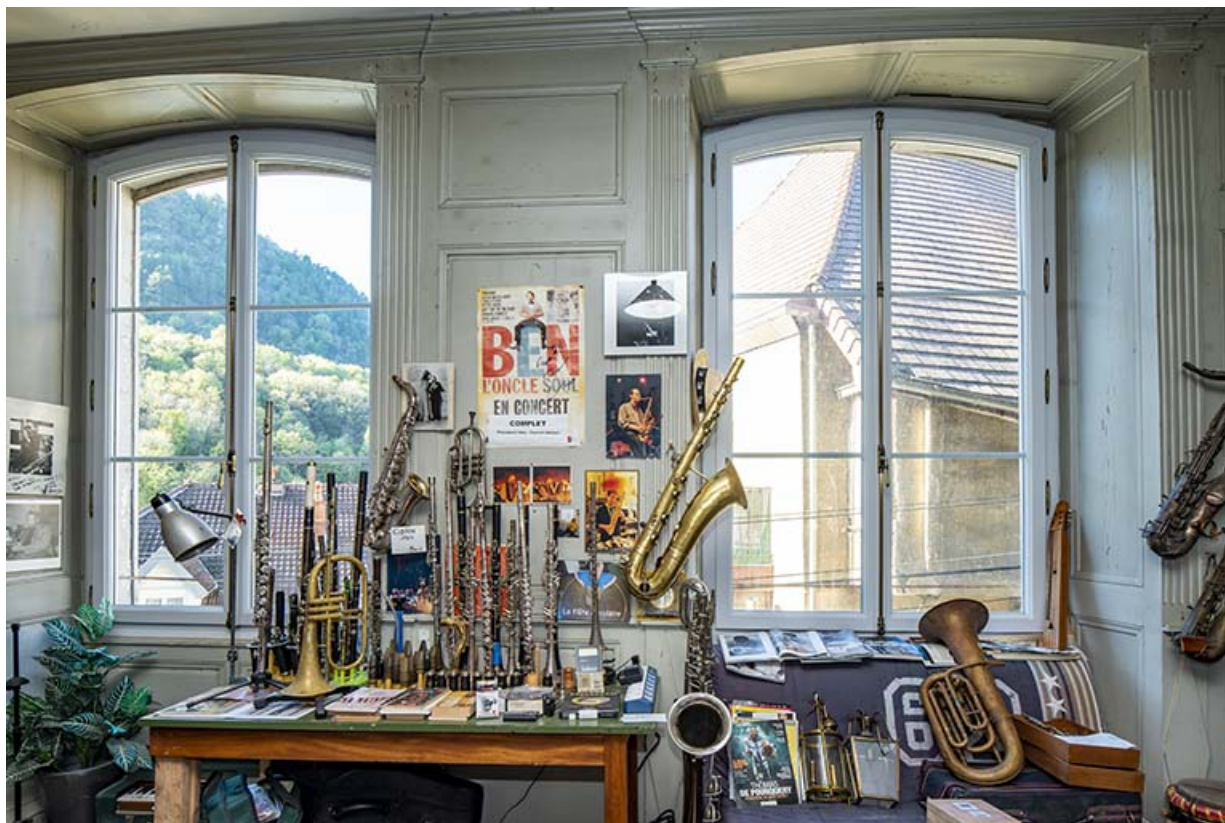
Petit salon. Fenêtres sur la rue du Chambenoz.

39, Salins-les-Bains, 4 rue du Chambenoz