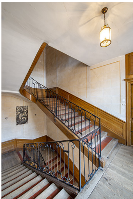
Vue de l'escalier depuis le palier du deuxième étage.

39, Salins-les-Bains, 4 rue du Chambenoz