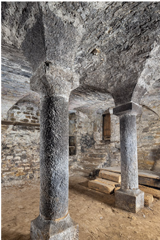
Vue de la cave depuis le sud.

39, Salins-les-Bains, 4 rue du Chambenoz