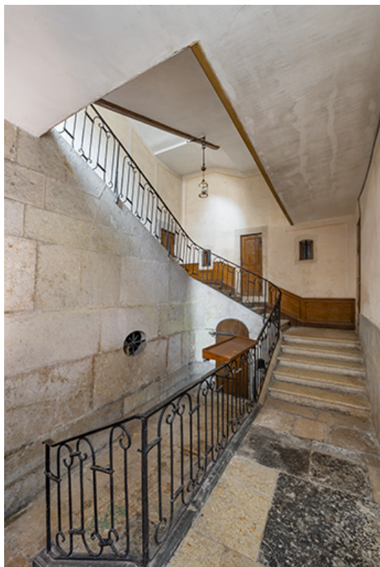
Escalier. Vue depuis l'entrée.

39, Salins-les-Bains, 4 rue du Chambenoz