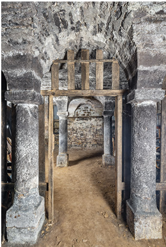
Vue axiale de la cave.

39, Salins-les-Bains, 4 rue du Chambenoz