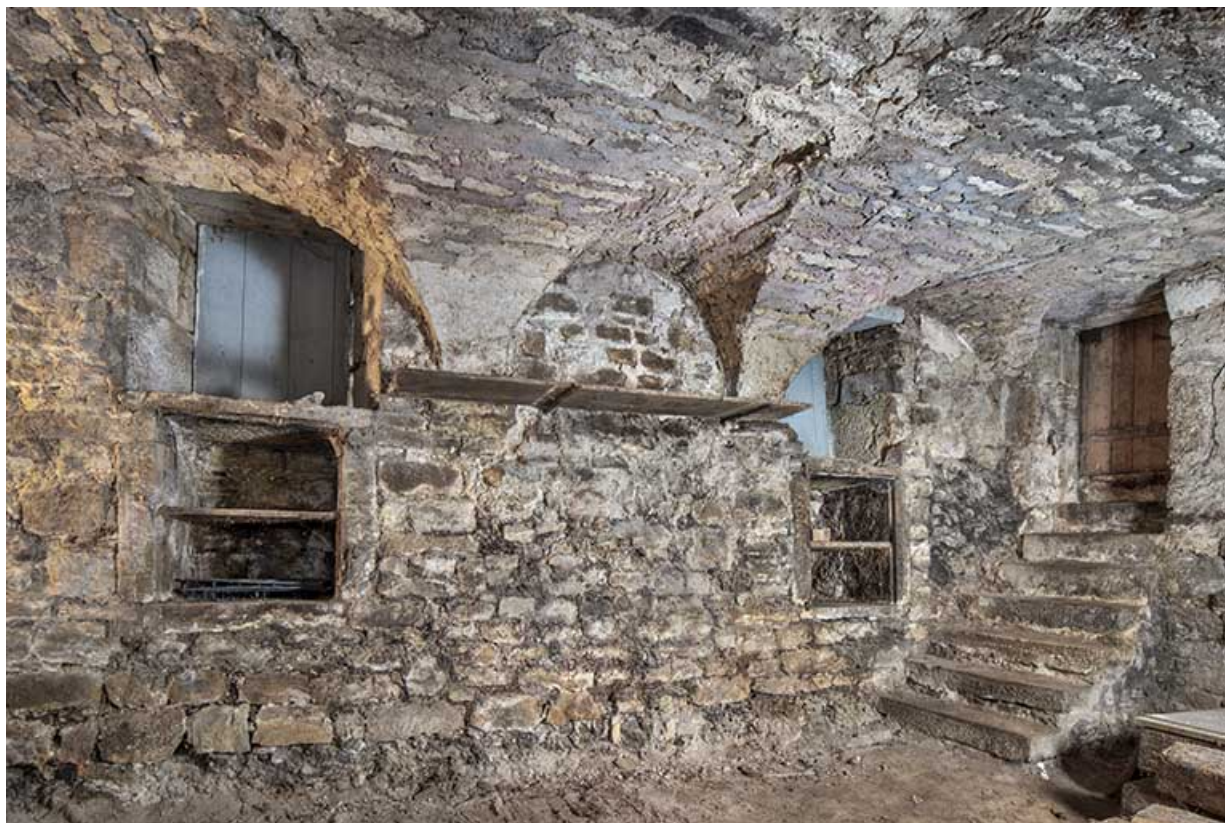
Mur ouest (sur la rue du Chambenoz) de la cave.

39, Salins-les-Bains, 4 rue du Chambenoz