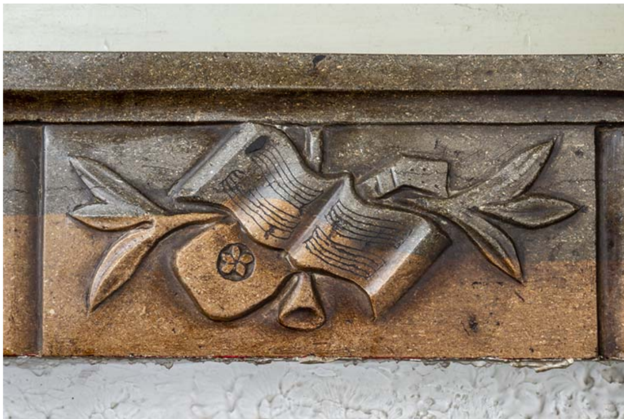
Grand salon. Détail du décor du linteau de la cheminée.

39, Salins-les-Bains, 4 rue du Chambenoz