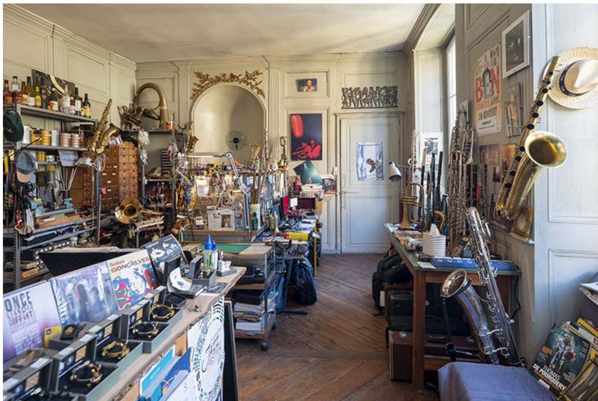
Petit salon. Vue depuis l'entrée.

39, Salins-les-Bains, 4 rue du Chambenoz