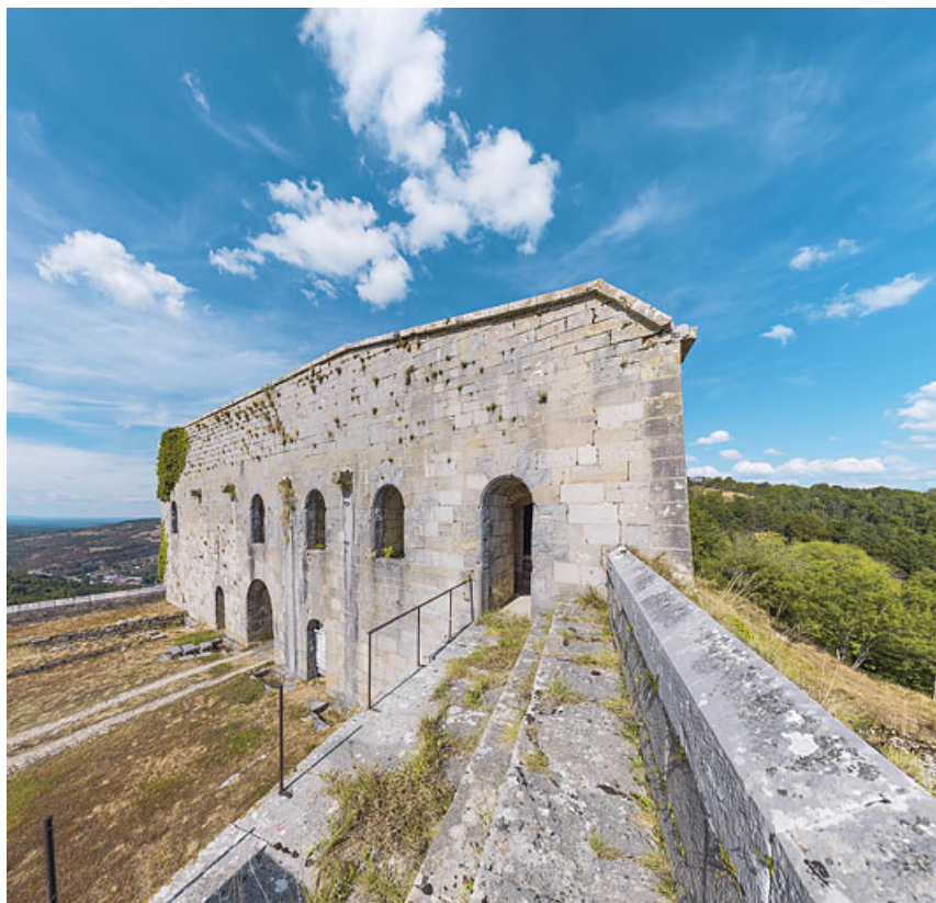
Vue de trois quarts droit de la façade postérieure.

39, Salins-les-Bains chemin Touillon, lieudit : Belin