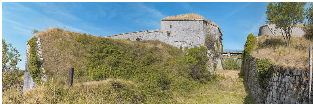
De gauche à droite : aile de l'ouvrage à cornes, le cavalier, le fossé, la contrescarpe et le réduit protégeant l'entrée du fort. 39, Salins-les-Bains chemin Touillon, lieudit : Belin