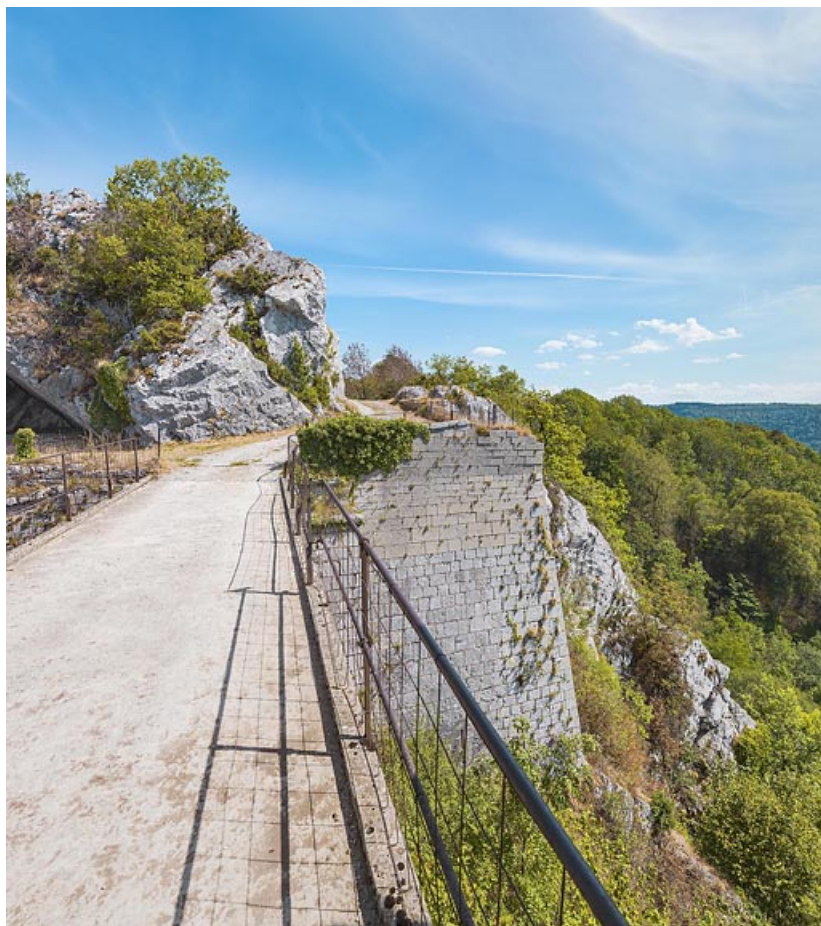
Le pont et vue partielle de la contrescarpe.

39, Salins-les-Bains chemin Touillon, lieudit : Belin