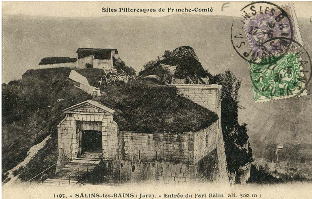
Entrée du Fort Belin Alt. 580 m. S.d.

39, Salins-les-Bains chemin Touillon, lieudit : Belin