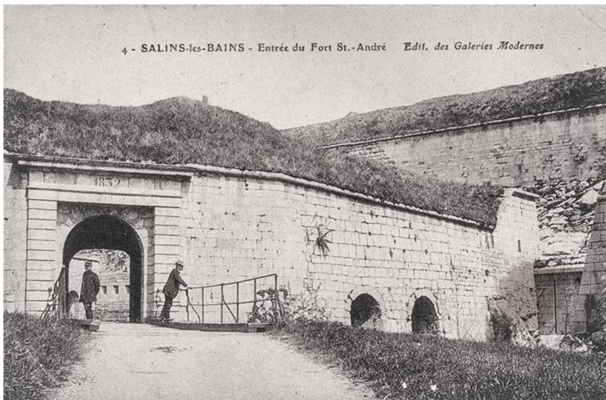
Salins-les-Bains. Entrée du fort Saint-André. S.d.

39, Salins-les-Bains chemin communal du fort Saint-André, lieudit : Fort Saint-André