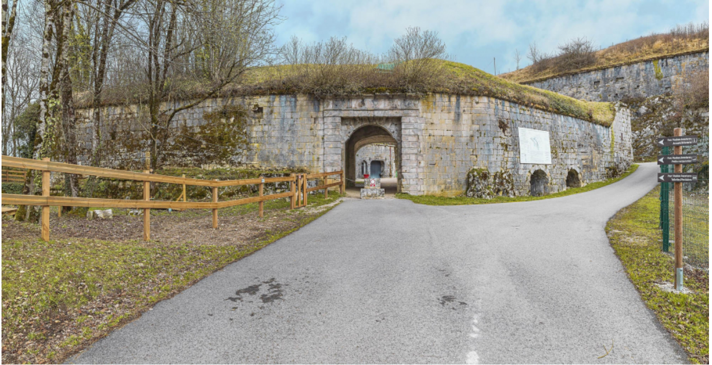
La demi-lune positionnée à l'entrée du fort.

39, Salins-les-Bains chemin communal du fort Saint-André, lieudit : Fort Saint-André