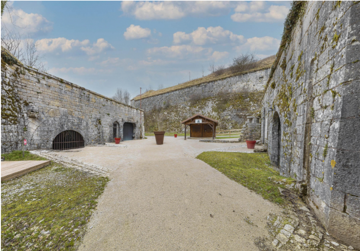
Vue de la cour intérieure.

39, Salins-les-Bains chemin communal du fort Saint-André, lieudit : Fort Saint-André