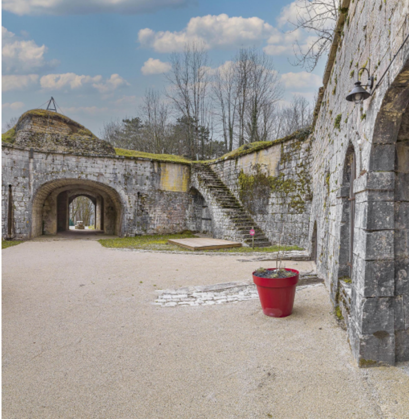
De gauche à droite : le passage, l'escalier et les portes des casemates du flanc droit. 39, Salins-les-Bains chemin communal du fort Saint-André, lieudit : Fort Saint-André