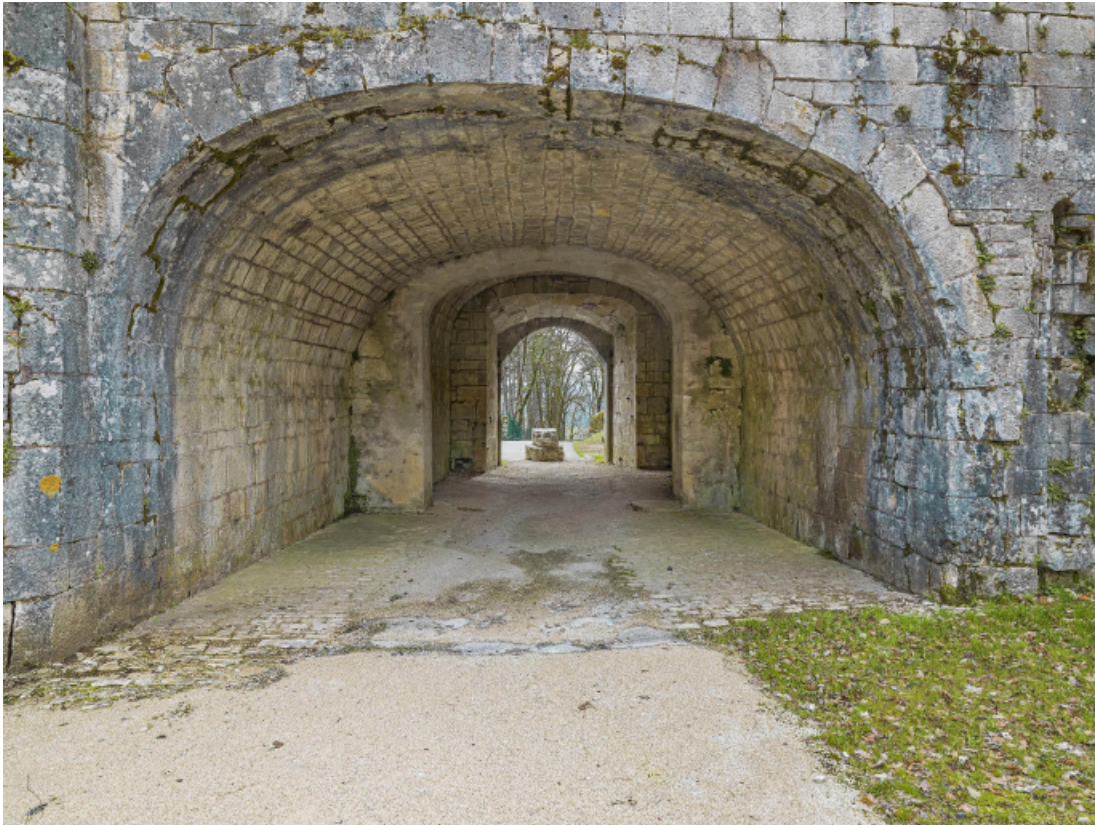
Le passage, vue depuis la cour intérieure.

39, Salins-les-Bains chemin communal du fort Saint-André, lieudit : Fort Saint-André