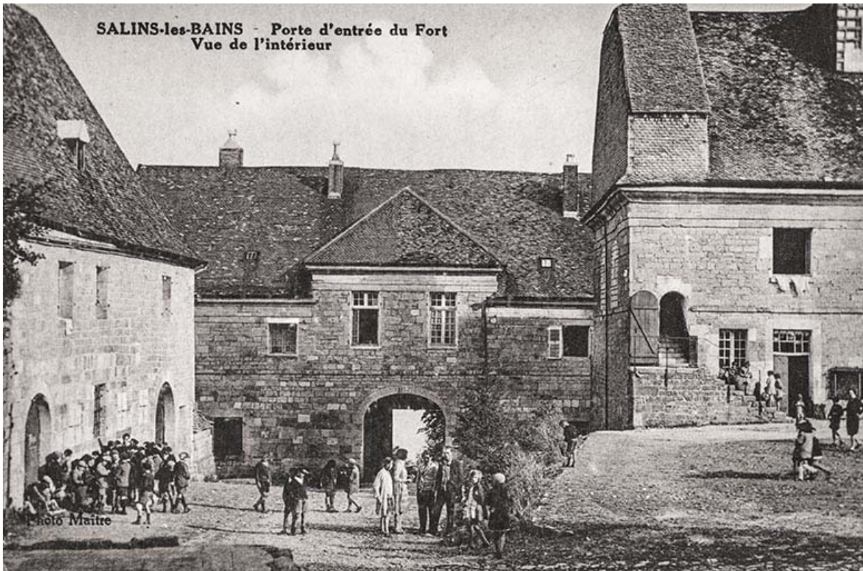
Sains-les-Bains (Jura). Porte d'entrée du fort, vue de l'intérieur. S.d.

39, Salins-les-Bains chemin communal du fort Saint-André, lieudit : Fort Saint-André