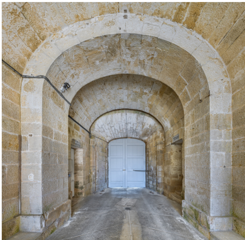
Pavillon d'entrée : passage voûté.

39, Salins-les-Bains chemin du Fort Saint-André, lieudit : Fort Saint-André