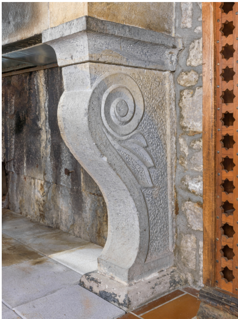
1er étage, logement destiné aux officiers : cheminée, détail du piedroit.

39, Salins-les-Bains chemin communal du fort Saint-André, lieudit : Fort Saint-André