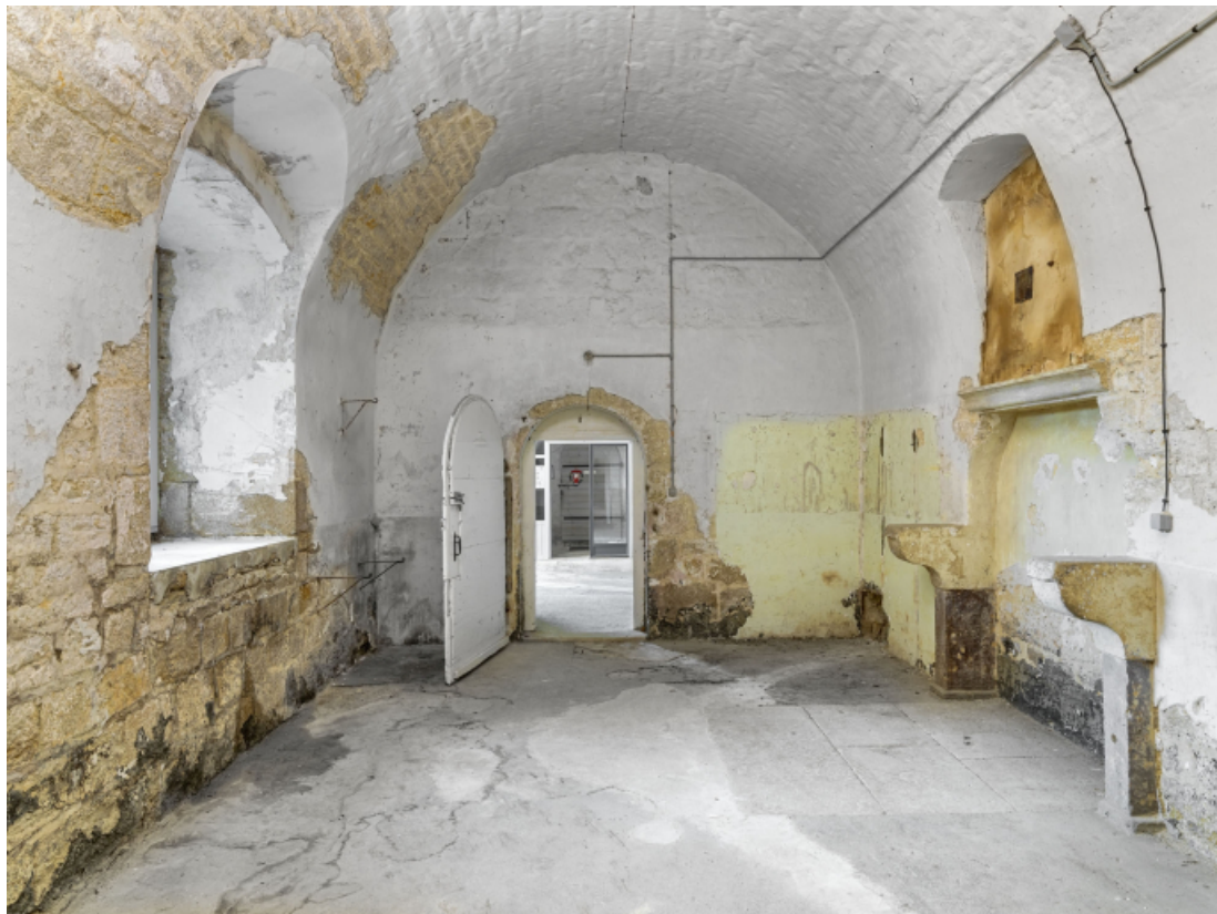
Le passage voûté : vue d'ensemble de la salle du corps de garde.

39, Salins-les-Bains chemin communal du fort Saint-André, lieudit : Fort Saint-André