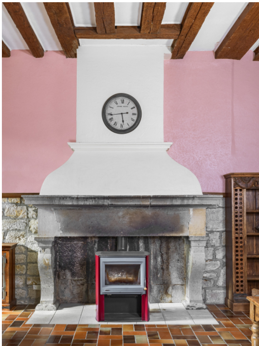
1er étage, logement destiné aux officiers : cheminée.

39, Salins-les-Bains chemin communal du fort Saint-André, lieudit : Fort Saint-André