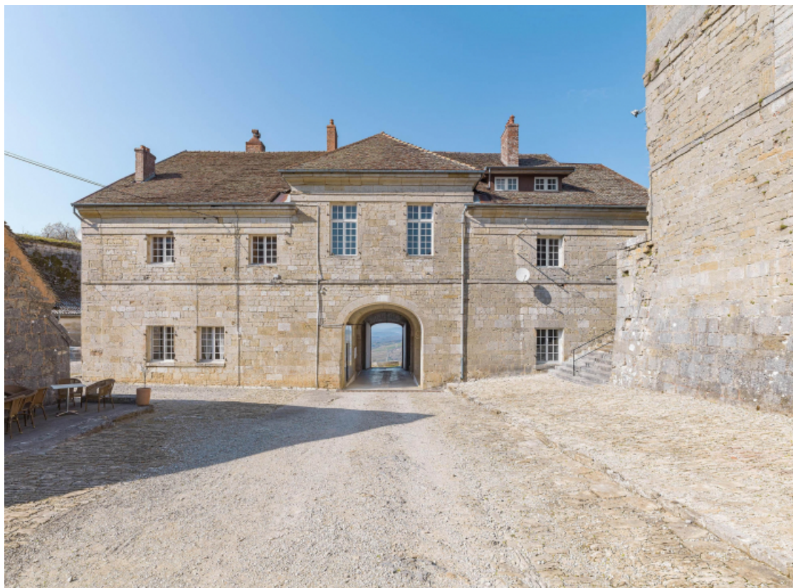
Façade postérieure du bâtiment.

39, Salins-les-Bains chemin communal du fort Saint-André, lieudit : Fort Saint-André