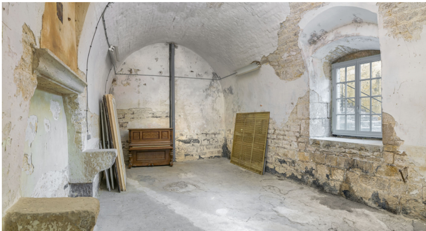
Le passage voûté : ancienne cave du major transformée en salle du corps de garde. 39, Salins-les-Bains chemin communal du fort Saint-André, lieudit : Fort Saint-André