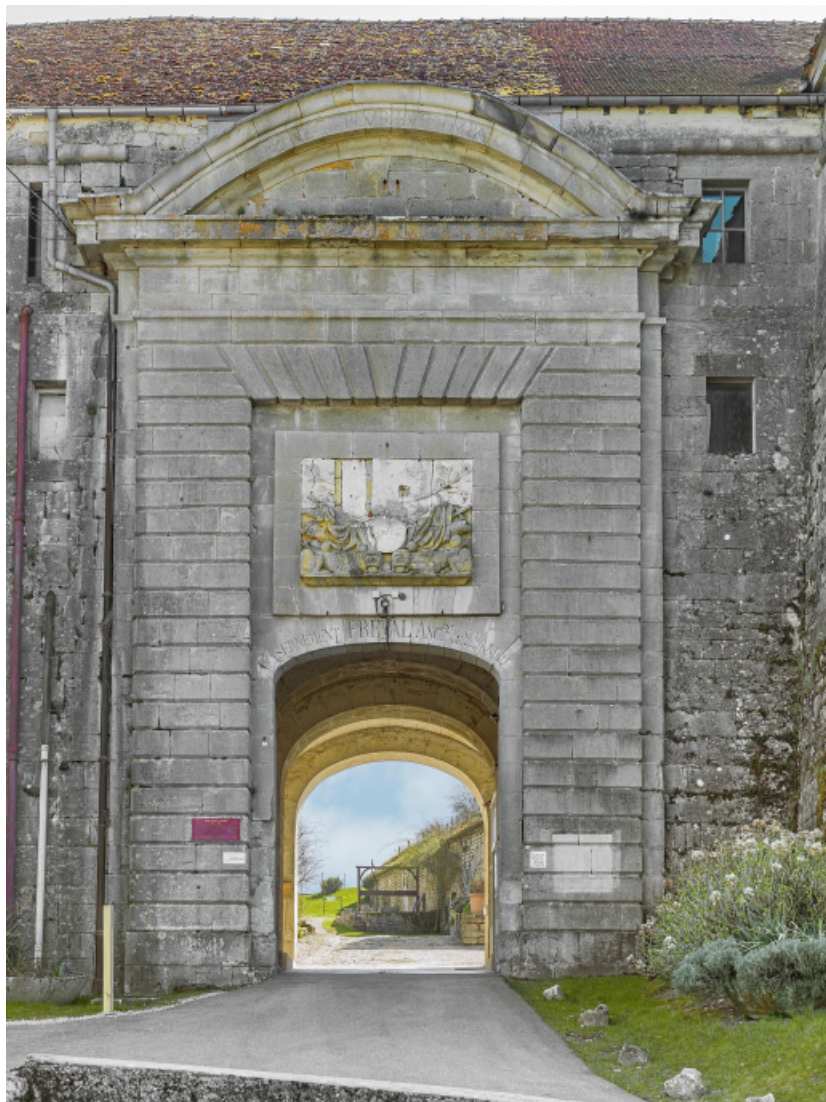
La porte d'entrée : vue d'ensemble.

39, Salins-les-Bains chemin communal du fort Saint-André, lieudit : Fort Saint-André