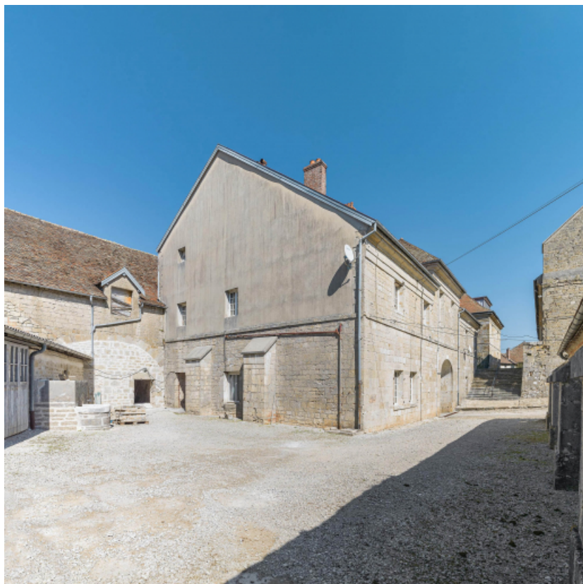
Façade postérieure : vue de trois quarts gauche.

39, Salins-les-Bains chemin communal du fort Saint-André, lieudit : Fort Saint-André