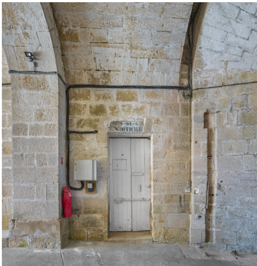
Le passage voûté : porte d'entrée du corps de garde (détail).

39, Salins-les-Bains chemin communal du fort Saint-André, lieudit : Fort Saint-André