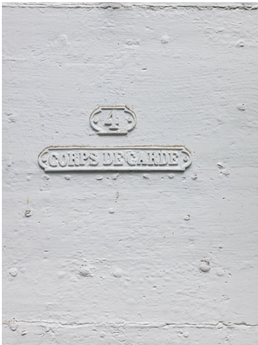
Le passage voûté : porte d'entrée du corps de garde (détail de l'inscription). 39, Salins-les-Bains chemin communal du fort Saint-André, lieudit : Fort Saint-André