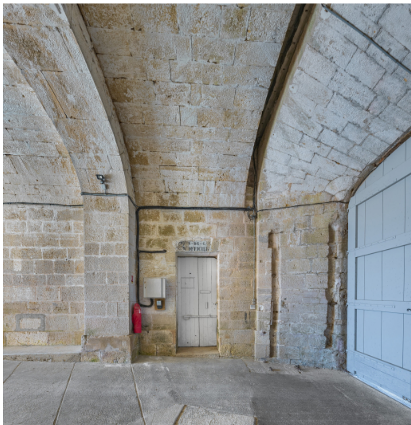
Le passage voûté : porte d'entrée du corps de garde.

39, Salins-les-Bains chemin communal du fort Saint-André, lieudit : Fort Saint-André