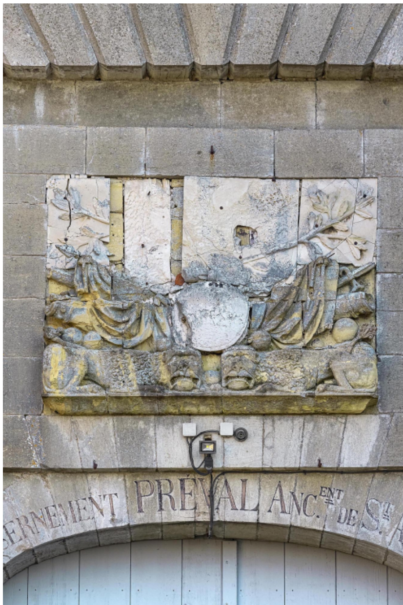
La porte d'entrée : détail de l'inscription et du bas relief.

39, Salins-les-Bains chemin communal du fort Saint-André, lieudit : Fort Saint-André