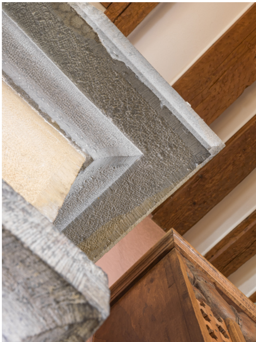
1er étage, logement destiné aux officiers : cheminée, détail du manteau.

39, Salins-les-Bains chemin communal du fort Saint-André, lieudit : Fort Saint-André