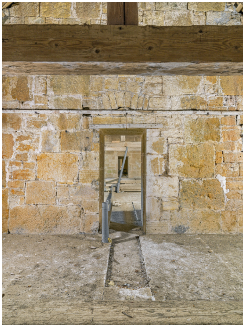
Caserne U, grenier : vue traversante.

39, Salins-les-Bains chemin communal du Fort Saint-André, lieudit : Fort Saint-André