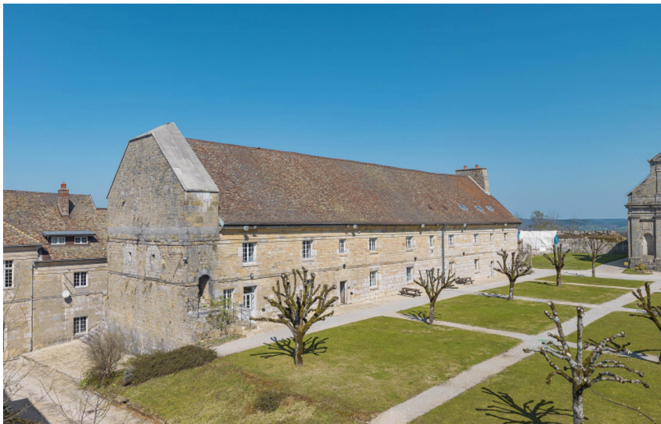
Caserne U : vue de trois quarts gauche (façades antérieure et latérale).

39, Salins-les-Bains chemin communal du Fort Saint-André, lieudit : Fort Saint-André