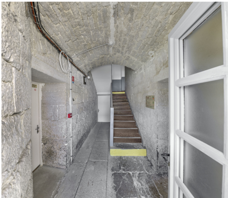
Caserne U, rez-de-chaussée : cage d'escalier.

39, Salins-les-Bains chemin communal du Fort Saint-André, lieudit : Fort Saint-André