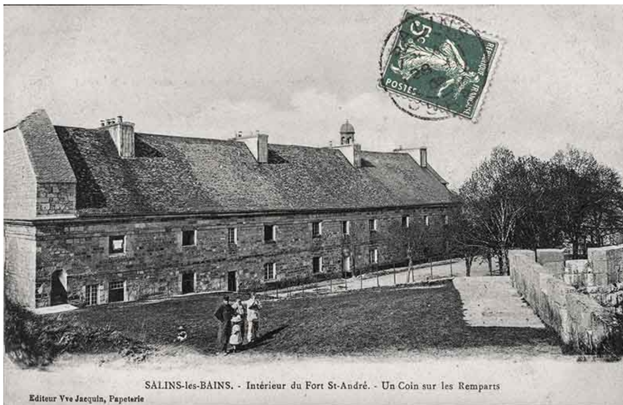
Salins-les-Bains. Intérieur du Fort Saint-André - Un Coin sur les remparts. S.d. 39, Salins-les-Bains chemin communal du Fort Saint-André, lieudit : Fort Saint-André