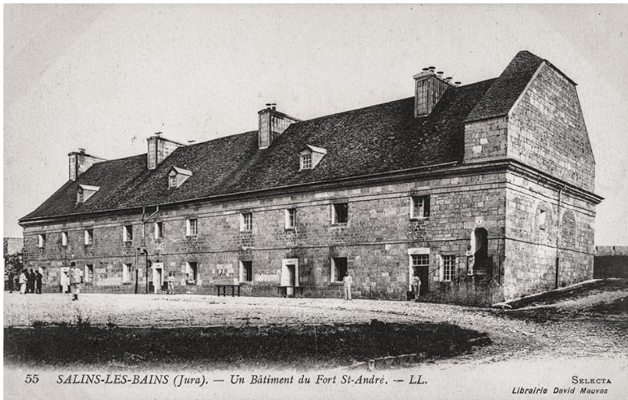
Salins-les-Bains (Jura). Un bâtiment du fort Saint-André. S.d.

39, Salins-les-Bains chemin communal du Fort Saint-André, lieudit : Fort Saint-André