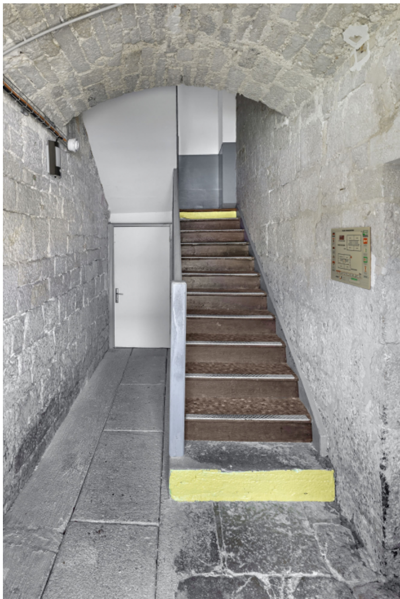
Caserne U, rez-de-chaussée : escalier et la première volée (détail).

39, Salins-les-Bains chemin communal du Fort Saint-André, lieudit : Fort Saint-André