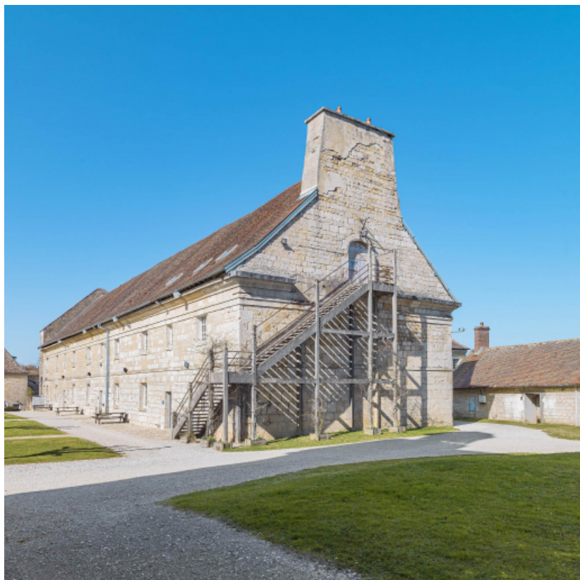
Caserne U : vue de trois quarts droit (façades antérieure et latérale).

39, Salins-les-Bains chemin communal du Fort Saint-André, lieudit : Fort Saint-André