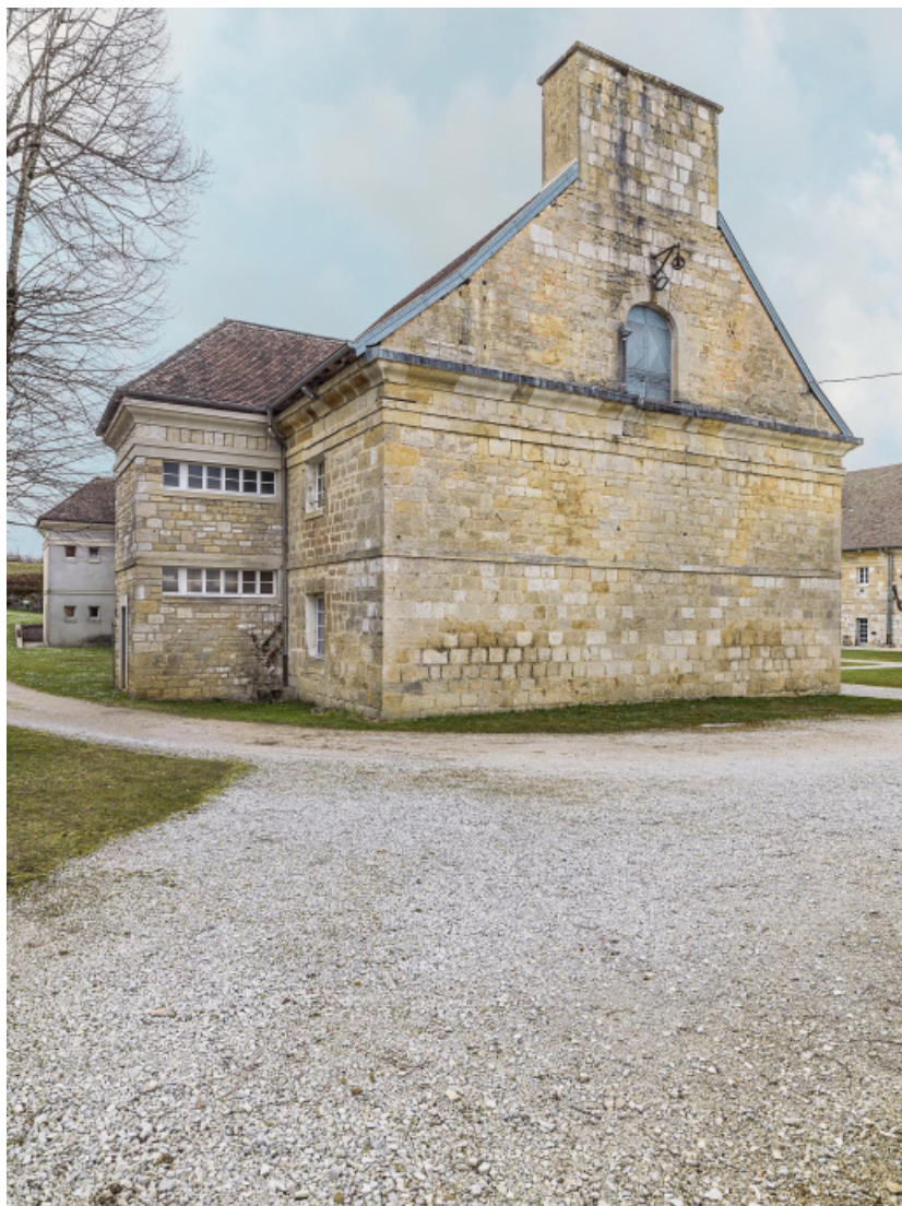
Caserne v : vue de trois quarts gauche (façades antérieure et latérale).

39, Salins-les-Bains chemin communal du Fort Saint-André, lieudit : Fort Saint-André