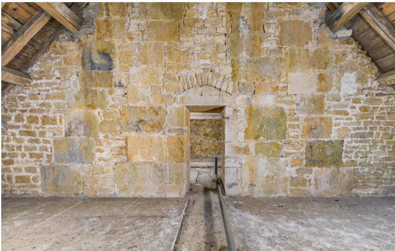
Caserne U, grenier : un des trois murs de refend.

39, Salins-les-Bains chemin communal du Fort Saint-André, lieudit : Fort Saint-André