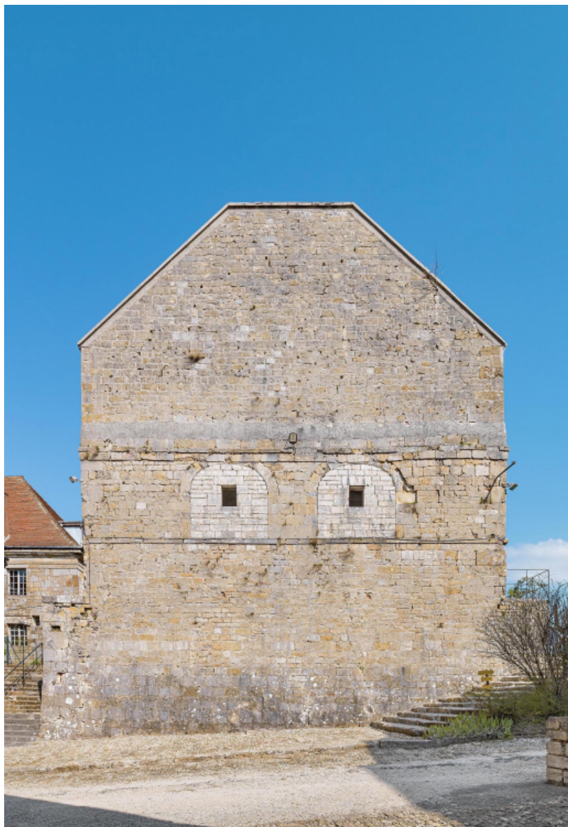
Caserne U : mur pignon épaissi, au cours du 19e siècle pour être à l'épreuve des bombes. 39, Salins-les-Bains chemin communal du Fort Saint-André, lieudit : Fort Saint-André