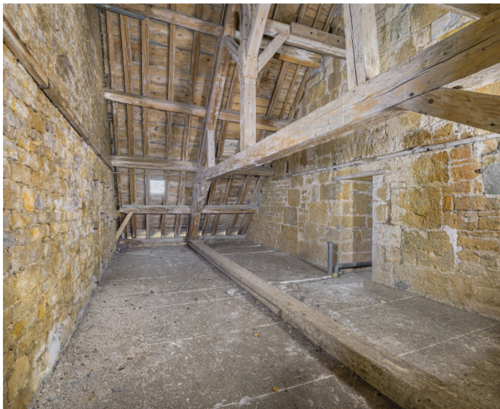
Caserne U, grenier : vue générale d'une ferme composant la charpente.

39, Salins-les-Bains chemin communal du Fort Saint-André, lieudit : Fort Saint-André