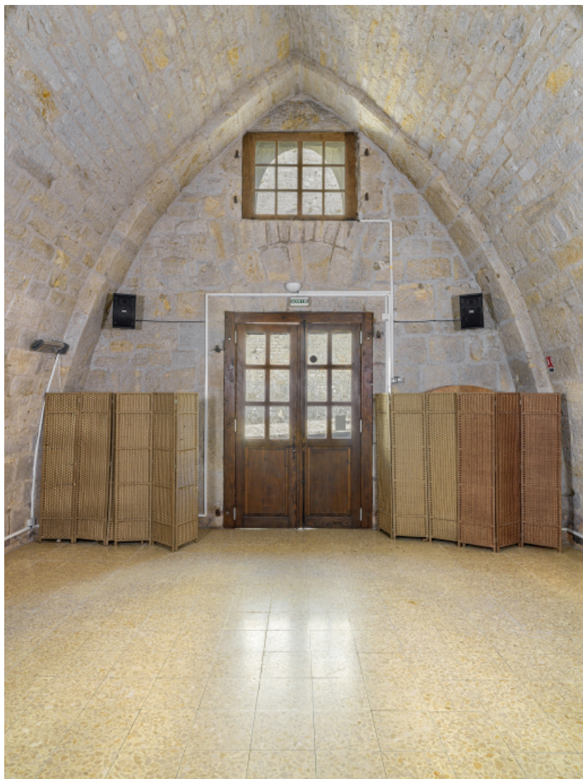
Vue intérieure depuis le mur postérieur.

39, Salins-les-Bains chemin communal du Fort Saint-André, lieudit : Fort Saint-André