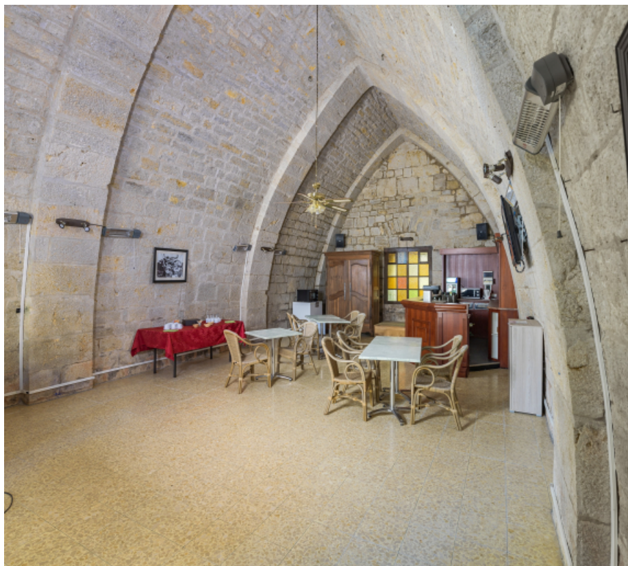
Vue de trois quarts droit.

39, Salins-les-Bains chemin communal du Fort Saint-André, lieudit : Fort Saint-André