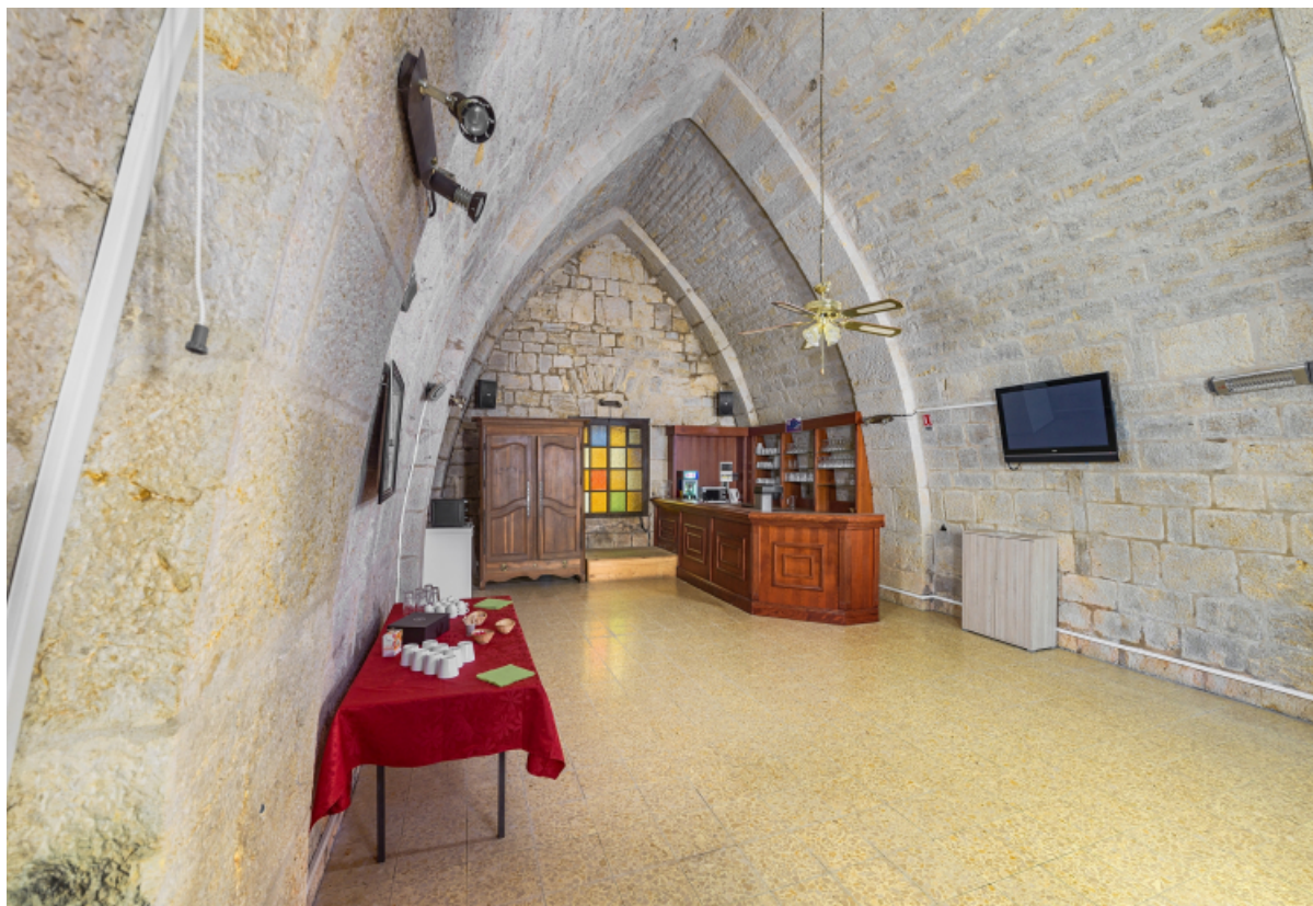
Vue de trois quarts gauche.

39, Salins-les-Bains chemin communal du Fort Saint-André, lieudit : Fort Saint-André